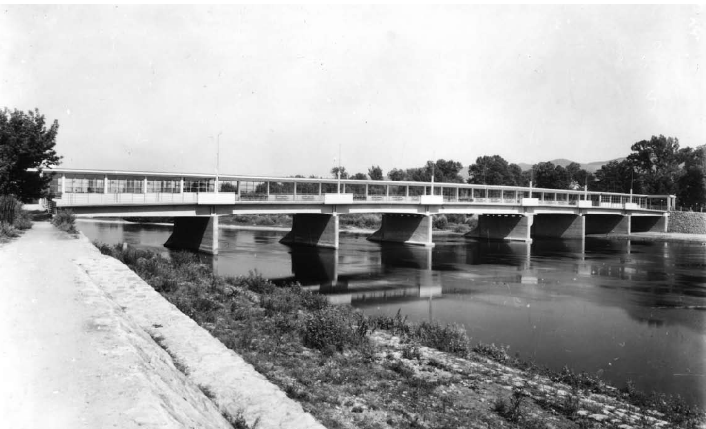
7. Most Kolumnowy w Pieszczanach, 1933, inż. Emil Belluš.