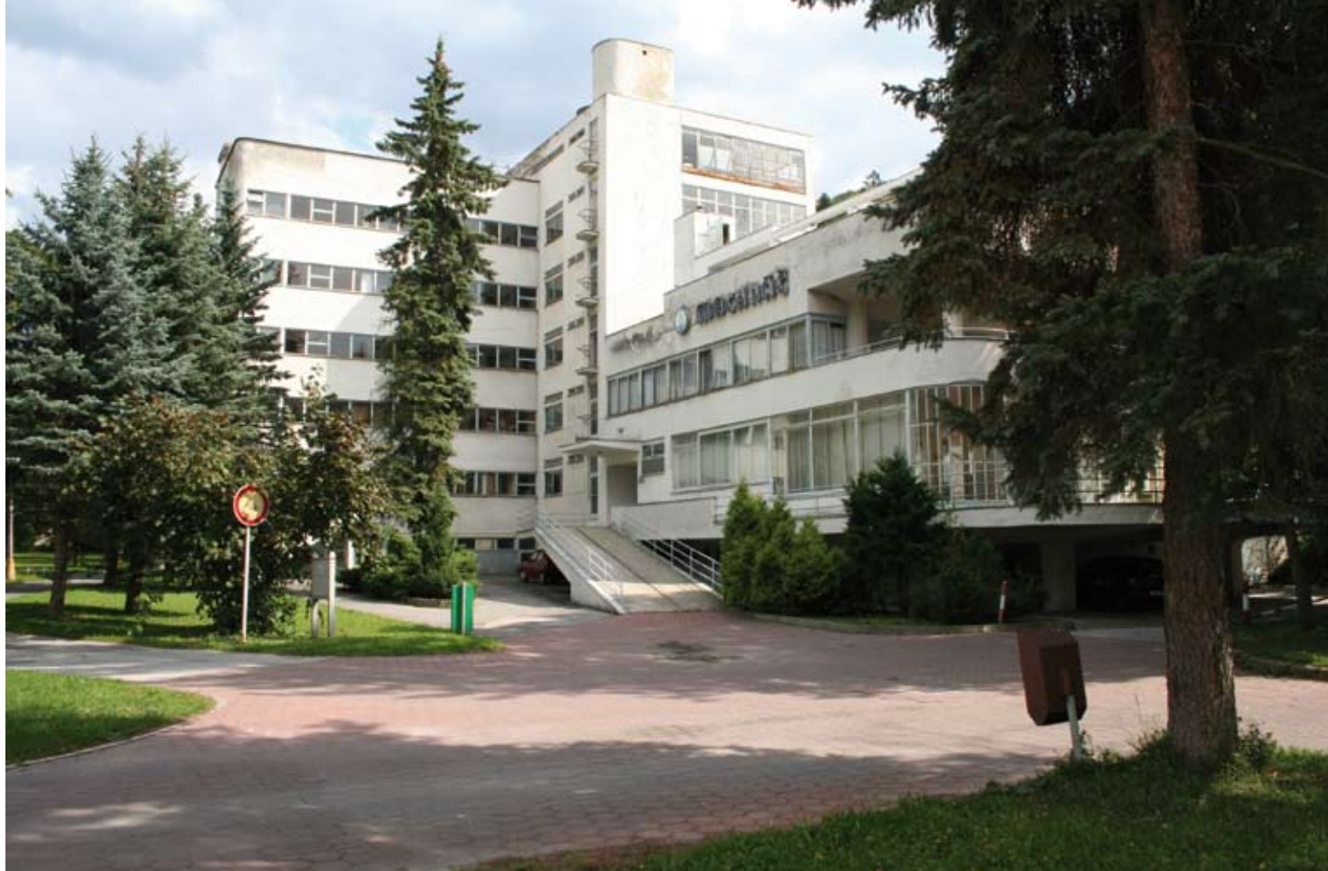
8. Sanatorium Machnáč w Trenčianskych Ciepliacach, 1932, arch. Jaromír Krejcar.

DOCOMOMO Słowacja pracuje nad rejestrem i dokumentacją wpisanych na jego listę obiektów. Obecnie rejestr ten obejmuje 49 obiektów architektury modernistycznej i nie jest jeszcze zamknięty 6 . Po nowojorskiej konferencji międzynarodowej DOCOMOMO poświęconej późnemu modernizmowi, naukowcy słowaccy skupili swą uwagę badawczą na dziełach tej epoki.