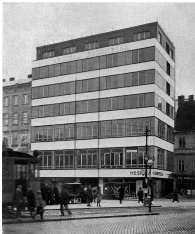
6. Miejski Bank Oszczędnościowy w Bratysławie 1931, arch. Juraj Tvarožek, (Fot. Matica slovenská, Martin)

W związku z organizowaną w latach 20-tych szeroką opieką zdrowotną, zakłady ubezpieczeń społecznych rozpoczęły budowę szeregu nowych biurów, szpitali, ośrodków leczniczych i sanatoriów. W toku tych działań powstało na Słowacji kilka znakomitych dzieł architektury modernistycznej. Jedno z pierwszych, być może najlepsze, to sanatorium Machnáč (1932) w Trenczyńskich Cieplicach, zaprojektowane przez znamienitego przedstawiciela praskiej awangardy Jaromira Krejčara. W momencie powstania sanatorium było największym budyn-