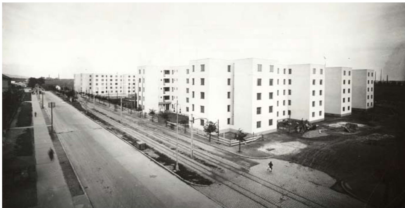
5. Zespół mieszkalny Nová Doba w Bratysławie, 1932 – 1942, arch. Fridrich Weinwurm i Ignác Vécsei.