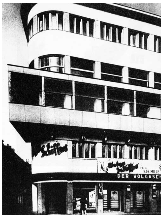
3. Królewiec (dziś Kaliningrad). Kino Prisma , 1928, proj. H. Hopp i G. Lucas