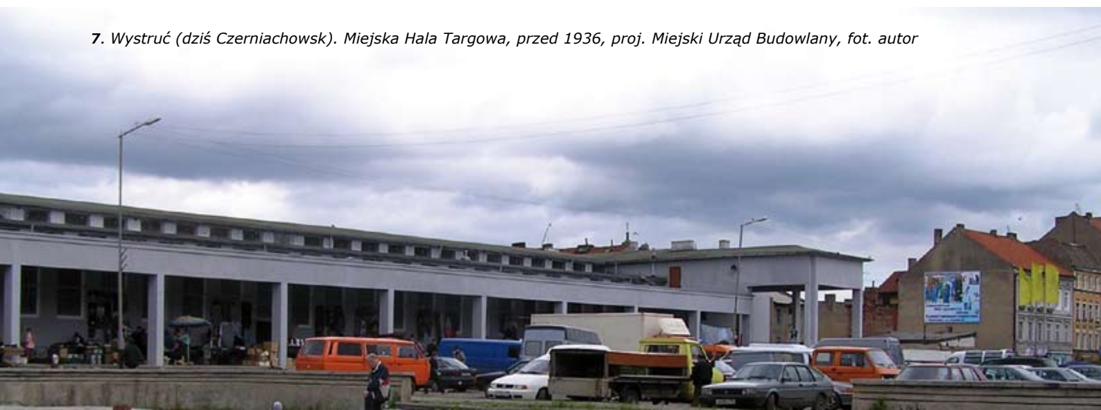
7. Wystruć (dziś Czerniachowsk). Miejska Hala Targowa, przed 1936, proj. Miejski Urząd Budowlany