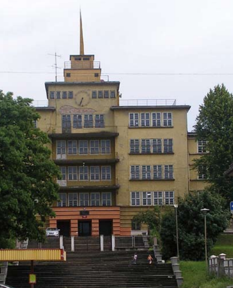
8. Elbląg. Dawna Jahnschule, 1928-1929, projektant nieznany

(il. 8). Znakomicie ukształtowana bryła szkoły składa się z kilku prostopadłościennych segmentów. Najwyższy z nich ulokowano na osi symetrii założenia, podkreślając jego znaczenie (główne wejście) imponującą iglicą. Szkoła elbląska to jeden z najlepszych przykładów architektury międzywojennej w całych Prusach Wschodnich. Warto wspomnieć o kompozycyjnych związkach tej budowli z otoczeniem. Do szkoły wzniesionej na szczycie skarpy wiodą od zachodu monumentalne schody flankowane u nasady przez dwa bliźniacze piętrowe domy z narożnymi wykuszami. Kojarzą się one ze stylistyką stosowaną podczas wschodniopruskiej odbudowy po I wojnie, choć przypuszczać można, iż wzniesiono je w tym samym okresie, co szkołę.