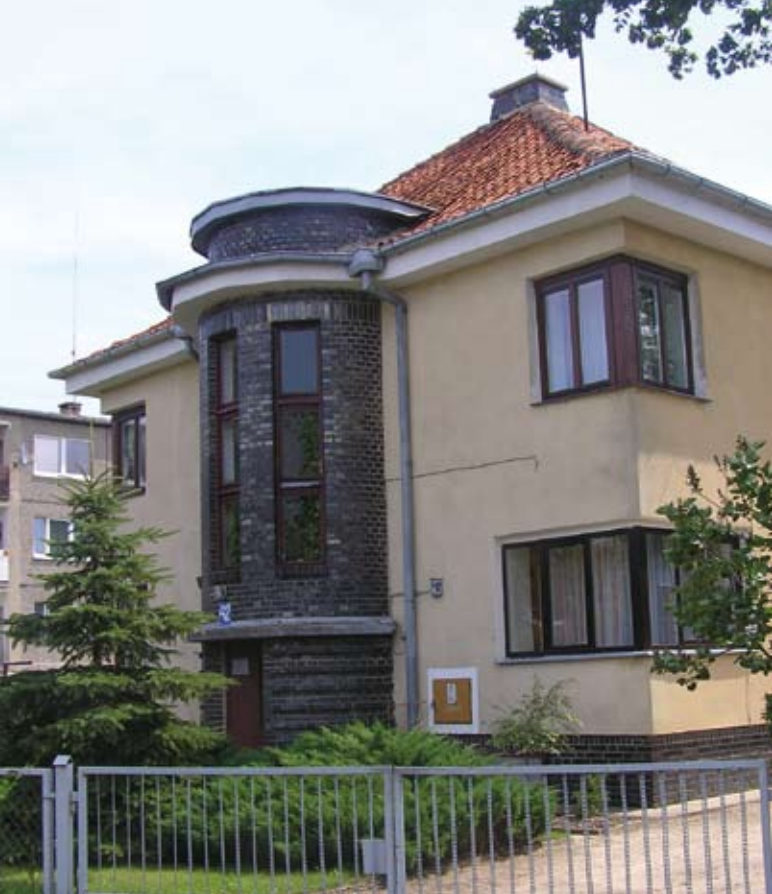
10. Lidzbark Warmiński. Willa przy ul. Polnej, ok. 1930, projektant nieznany, fot. autor