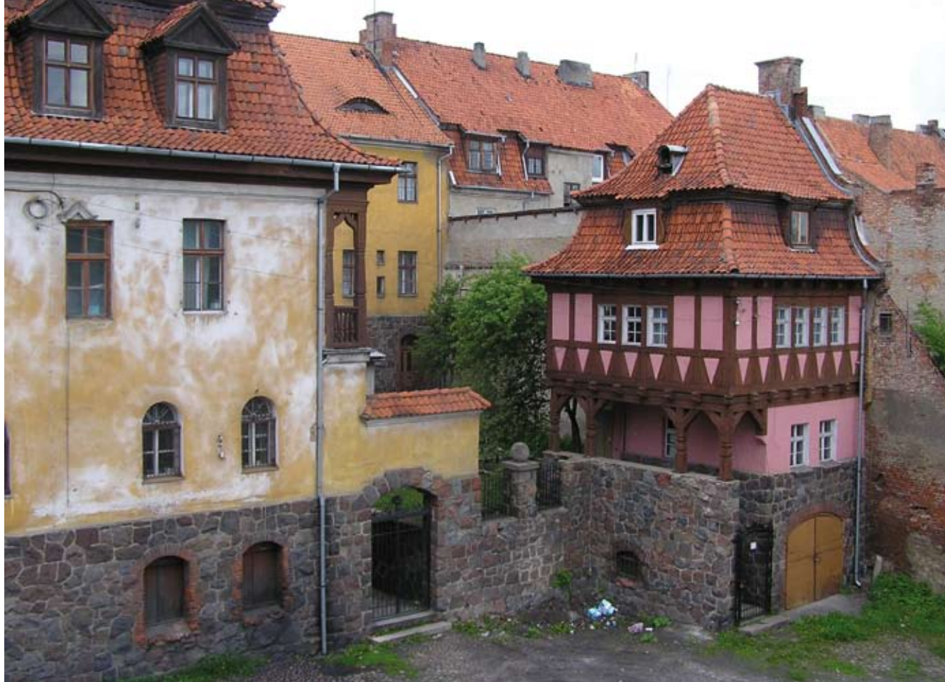
1. Dąbiejmy (dziś Ożarów). Dom Wiechertów, przed 1922, proj. E. Lindenburger (?), fot. autor

Pierwszym badaczem, który podjął próbę scharakteryzowania obrazu architektury wschodniopruskiej w okresie od końca XIX w. po lata 30-te następnego stulecia był Nils Aschenbeck 6 . Autor ten opierał się w swej pracy wyłącznie na dostępnych mu archiwalnych publikacjach. Dlatego zapewne umknął mu szereg budowli, słabiej zaakcentowanych w literaturze (lub w niej nieobecnych), aczkolwiek ważnych dla oblicza prowincji wschodniopruskiej. W formie popularnonaukowej budownictwo tego okresu omówione zostało również na łamach czasopisma „Borussia” 7 . Inne, w gruncie rzeczy nieliczne publikacje mają charakter monograficzny i poświęcone są albo poszczególnym architektom bądź miastom 8 . Zazwyczaj trudno uznać je za opra-