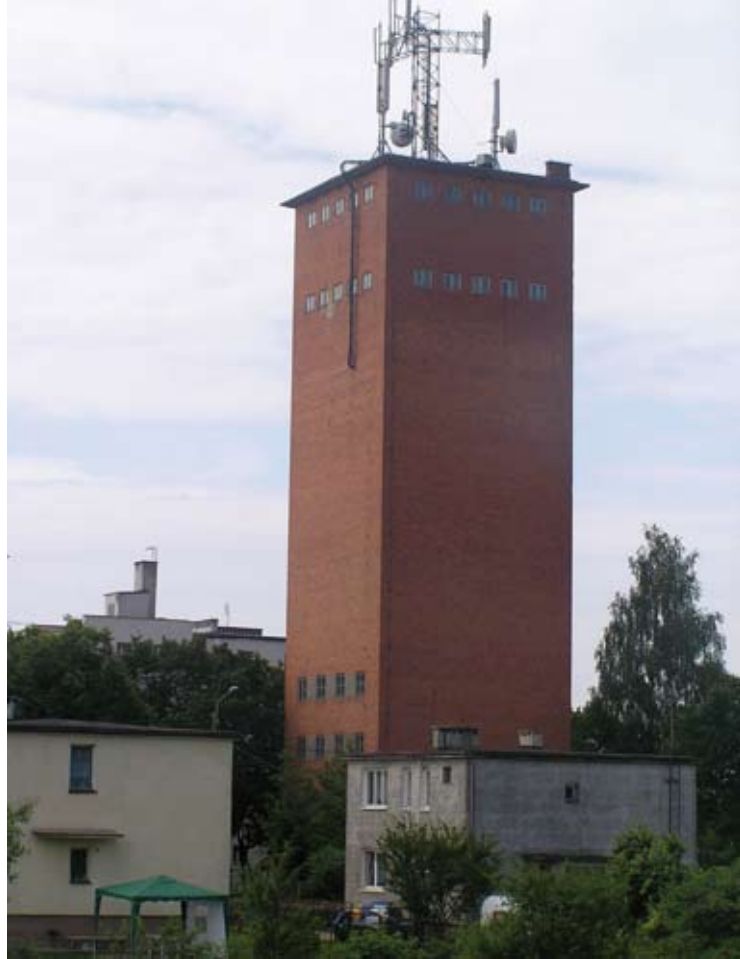
9. Morąg. Wieża ciśnieniowa, ok. 1928, proj. K. Frick, fot. autor

Do grupy budowli stanowiących specyficz-