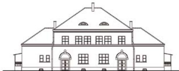
TYP II / OGRODOWA