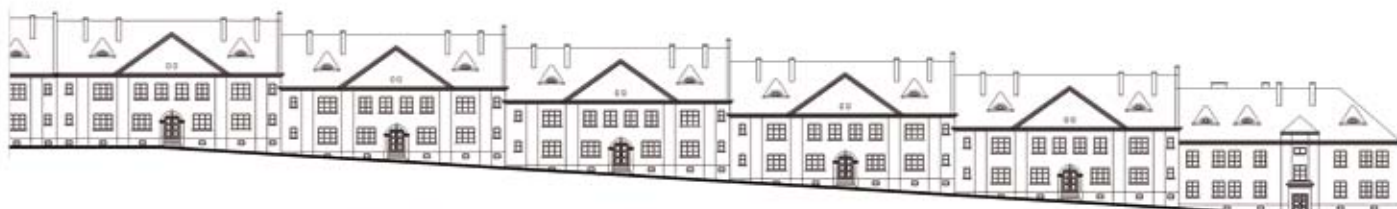
PIERZEJA - UL. WIEJSKA (TYP VI, TYP VII)