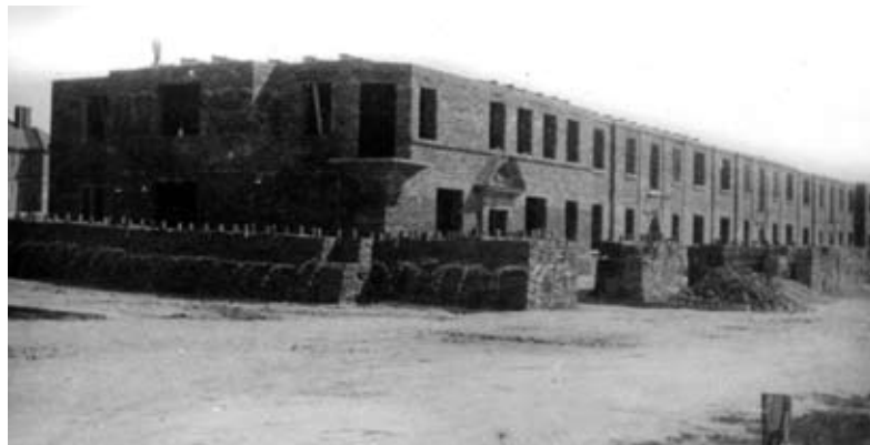
3. Budowa osiedla „Dyrekcja”, budynki mieszkalne, Muzeum Kolejnictwa w Warszawie, z albumu Mikołaja Leszczyńskiego-Głębowskiego, 1929 r.

Budowę rozpoczęto z olbrzymim rozmachem, na jej terenie pracowało około 2000 robotników. Wytoczono 22 nowe ulice, przy których rozpoczęto wznoszenie budynków mieszkalnych i gmachu dyrekcji. W tym samym mniej więcej czasie, na rozparcelowanych przez miasto sąsiadujących z założeniem terenach majątku, rozpoczęła się budowa prywatnych budynków. Na obszarze około 370 hektarów powstawało osiedle około 250 domów jednorodzinnych 4 . Niestety niezwykle ciężka zima na przełomie 1928-1929 oraz trudne warunki geologiczne spowodowały spękania świeżych murów i osiadanie fundamentów. Jesienią pod niezabezpieczone fundamenty dostała się woda, która nie mogła wsiąknąć w nieprzepuszczalny margiel, a po zamarnięciu w niektórych miejscach wysadziła mury 5 . Prace, pomimo wykonania natychmiastowych napraw zostały wyraźnie spowolnione. Rozpoczęto dochodzenie i odwołano dotychczasowego naczelnika budowy. Tempo prac wzrosło dopiero w lipcu 1929 r. wraz z powołaniem przez władze nowego naczelnika, którym został inż. Mikołaj Leszczyński-Głębowski. Wznowioną wówczas inwestycję przerwa-