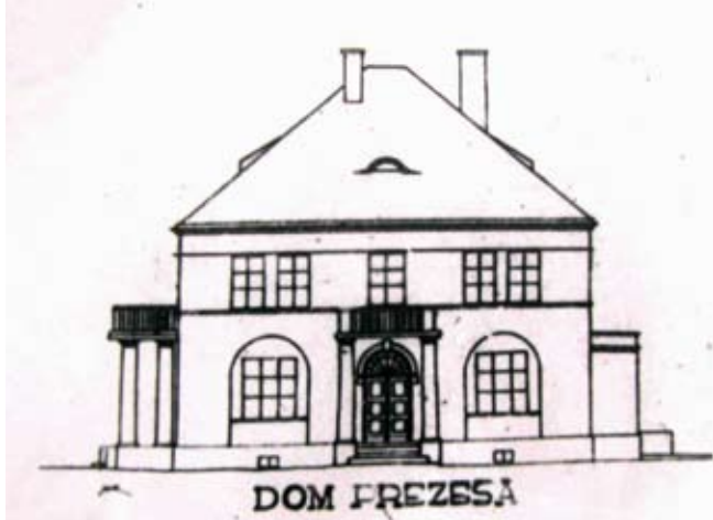
5. Osiedle „Dyrekcja” w Chełmie, niezrealizowane budynki mieszkalne, autorzy Adam Kuncewicz, Adam Paprocki, Muzeum Kolejnictwa w Warszawie, z albumu Mikołaja Leszczyzny-Glybowskiego, 1929 r.

Na terenie osiedla brak jest wolnostojących budynków wielopiętrowych. Budynki typu od IV do XI, o dwóch i trzech kondygnacjach łączono w bloki o liczbie modułów zależnej najczęściej od długości ulicy, której pierzeję stanowiły. Typ IV i V posiada trzy kondygnacje mieszkalne, pozostałe dwie. W bloki wieloklatkowe łączono ze sobą typy IV z V, VI z VII oraz VIII z IX. Układ połączonych modułów wyglądał zawsze tak samo, wewnątrz bloku wznoszono budynki typu IV, VI i VII, a pierzeję zamykano V, VI i IX.