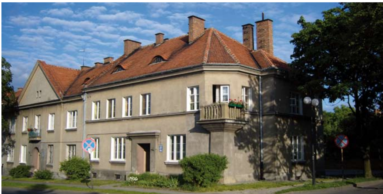
10. Budynki typu VIII i IX ulica Żwirki i Wigury

W tej sytuacji zachowanie wartości osiedla – przy jednoczesnym podniesieniu jego standardu użytkowego i estetycznego – zależy od przejęcia inicjatywy przez samorząd miejski. Wymaga to jednak by lokalna społeczność doceniła ponadlokalną wartość tego zabytku. Trzeba mieć nadzieję, że tak się stanie, bo jest to warunek właściwej ochrony być może najważniejszego zabytku Chełma.