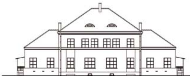
TYP II / FRONT