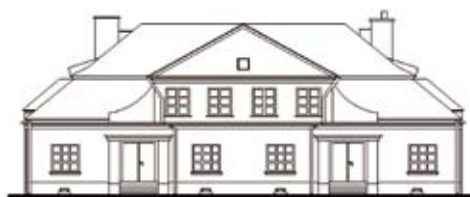
TYP III / OGRODOWA