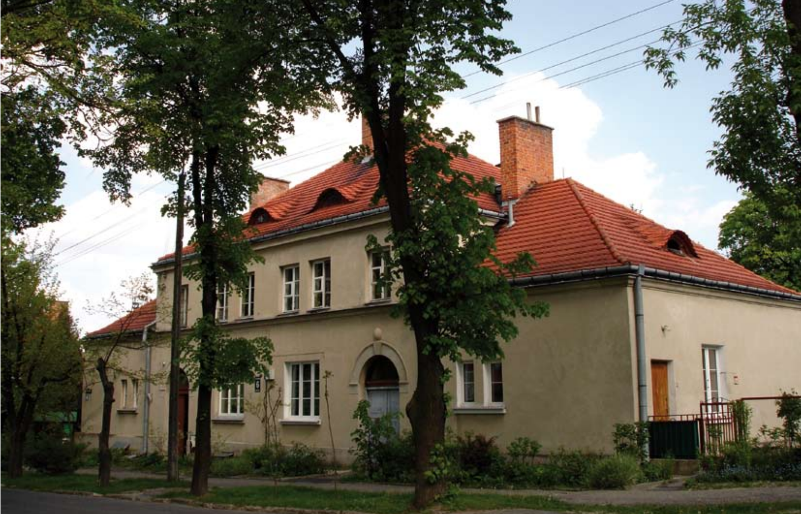
8. Budynek typu II ulica Czackiego

nie dwudziestolecie. Po 1989 roku zmieniły się stosunki własnościowe i w większości obiektów związały się wspólnoty, administrujące niewielką liczbą bloków czy nawet mieszkań. Rozdrobnienie oraz presja mieszkańców związana z chęcią wprowadzania zmian w przyszłości może utrudnić ochronę konserwatorską. Ważnym czynnikiem, który pozwolił obiektom przetrwać pomimo upływu 80 lat jest wysoka jakość robót budowlanych i materiałów użytych do ich wzniesienia.