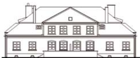
TYP III / FRONT