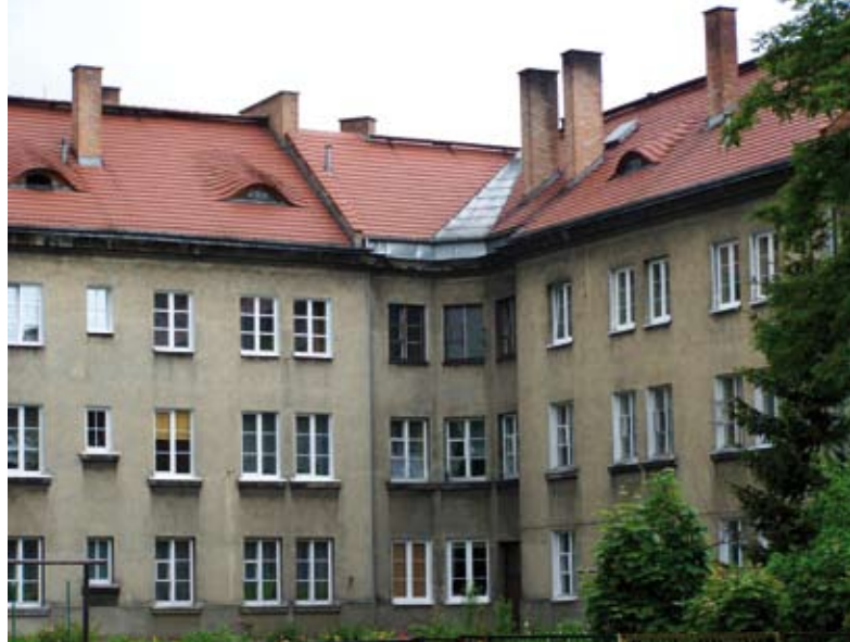
9. Budynki typu IV i V ulica Piłsudskiego

Narastającym problemem jest natomiast stan techniczny obiektów. Techniczne zużycie tej zabudowy nieuchronnie prowadzi do konieczności podjęcia remontów kapitalnych, szczególnie w perspektywie podnoszonych standardów cieplnej ochrony budynków. Tylko remonty kapitalne, dokonane w skali całych obiektów, dałyby możliwość zachowania wystroju architektonicznego – okien, elewacji, pokrycia dachów. Z kolei zaplanowanie cyklu remontów dla całego osiedla w uzgodnieniu z urzędem konserwatorskim pozwo-