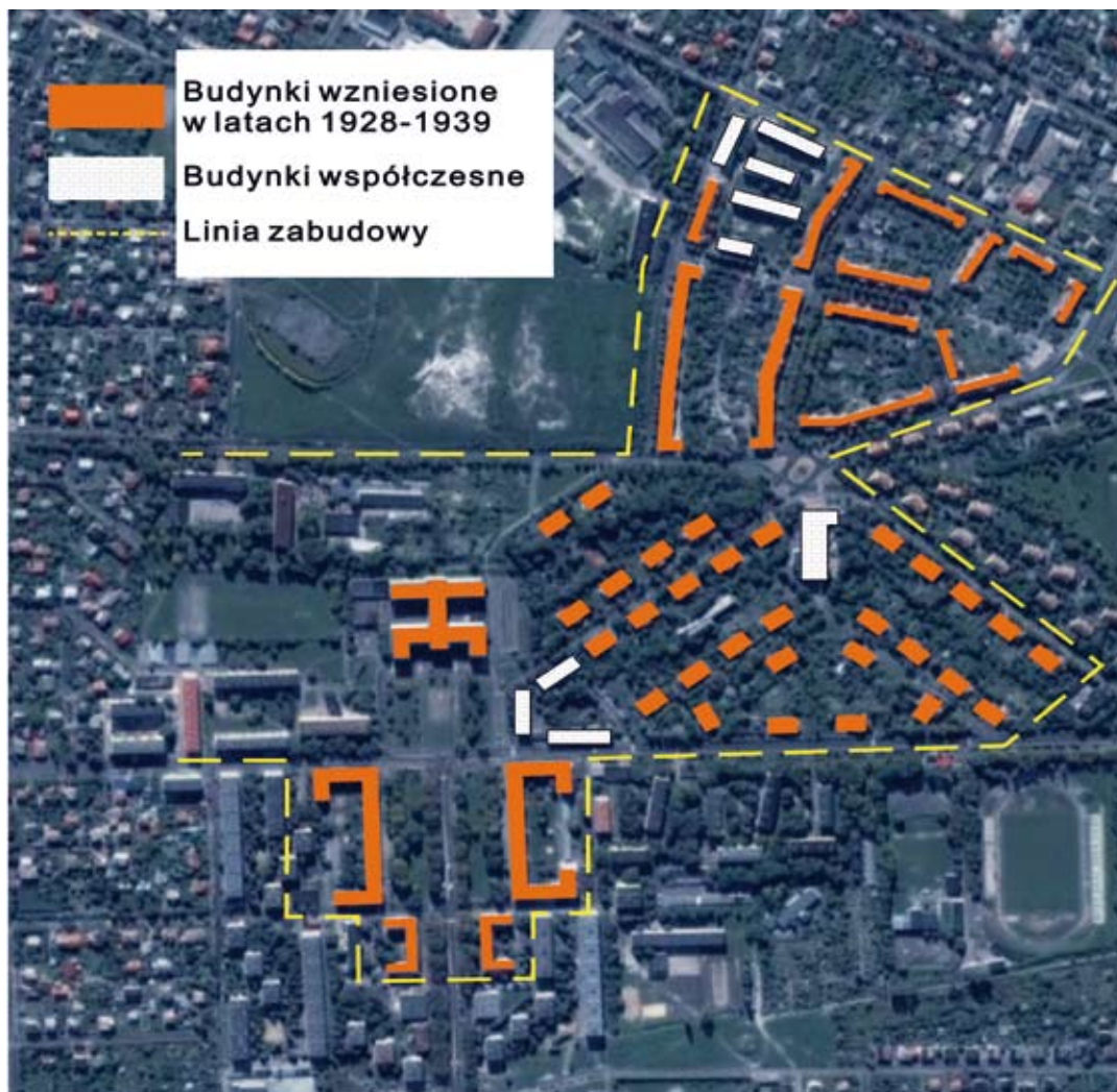
4. Chelm osiedle Dyrekcja, Szkic na podstawie Gogle Earth.