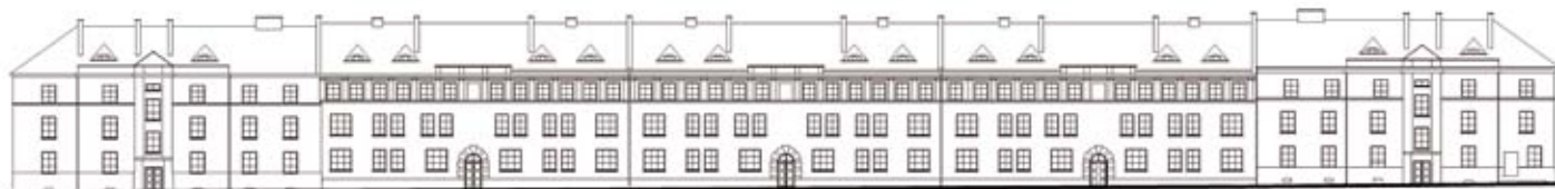
PIERZEJA - UL. PIŁSUDSKIEGO (TYP IV, TYP V)