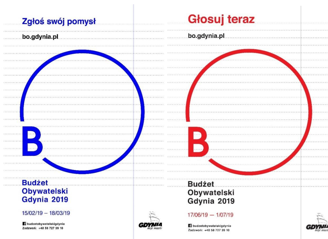
Rys. 2: Plakaty zachęcające do złożenia wniosku i do zagłosowania na projekty Budżetu Obywatelskiego