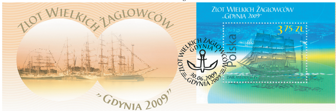
PIERWSZY DZIEŃ OBIEGU FDC POCZTA POLSKA