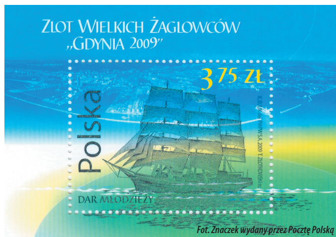
Fot. Znaczek wydana przez Pocztę Polską

Wystawa filatelistyczna w Urzędzie Poczтовым Gdynia 1 oraz Fiat Topolino - dodatkową atrakcją przygotowaną przez pocztę będzie wystawa filatelistyczna o tematyce marynistycznej, zorganizowana w holu Urzędu Poczтового Gdynia 1 oraz zabytkowy samochód Fiat Topolino, który będzie można obejrzeć w miejscu zlotu przy stoisku pocztowym.