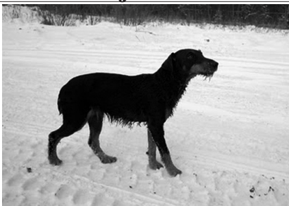
Fot. Jagdterier Tora. Piesek „przekonał” sarnę do podróży przez kanały i ta po chwili znalazła się bezpiecznie w siatce.

przystąpili do wielogodzinnej, niezwykle trudnej operacji.