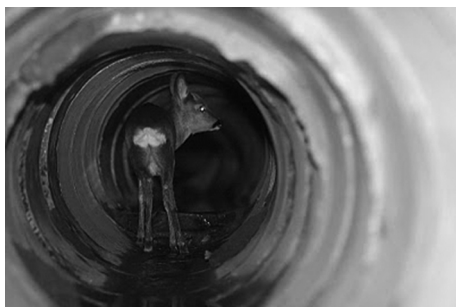
Próby przepłoszenia w siatkę na nic się zdały. Sarna nie chciała się przesunąć na krok.