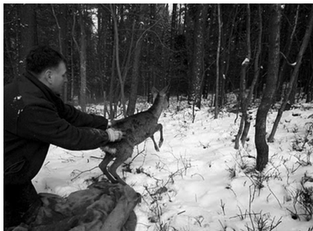
Fot. Uwolnienie młodego jelonka i wypuszczenie do lasu.

Zwierzątko spłoszone schowało się do jednego z kanałów. Próby wywabienia go przez ludzi nie powiodły się, dopiero psiak Tora potrafił to uczynić skutecznie! Jelonek uciekając przed swoim naturalnym wrogiem wybiegł do zastawionej już w owym głębokim na 6 m basenie - sieci. Czekali tu już na niego ludzie. Cały, zdrowy choć bardzo przerażony