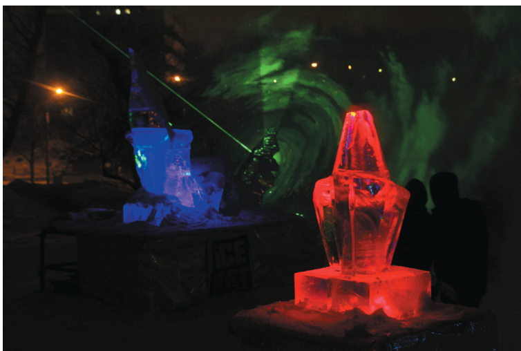
Rzeźby lodowe w iluminacji laserowej.