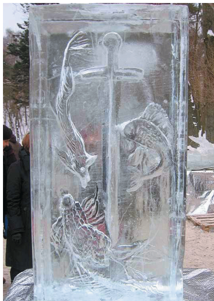
Impresja na temat Herbu Gdyni.

Rzeźby można było podziwiać w dniach 6 - 17 lutego, a w piątkowy wieczór 12 lutego również w laserowej iluminacji. Oto kilka fotografii, które pokazują piękno lodowych figur. □