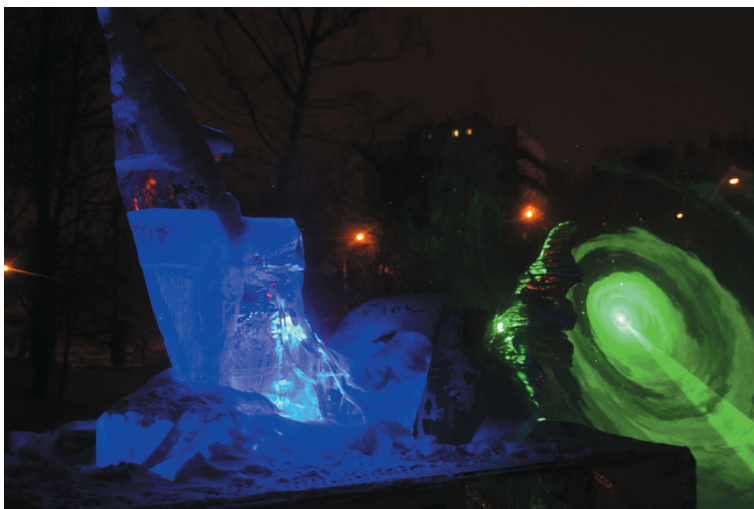
Rzeźby lodowe w iluminacji laserowej.