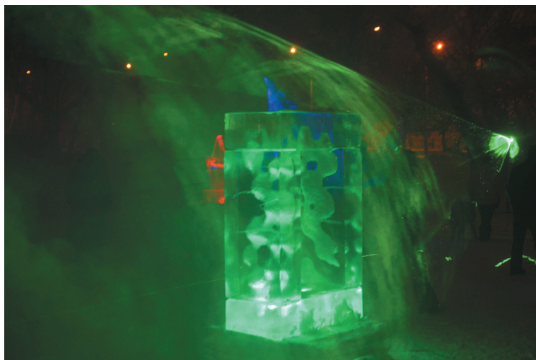
Rzeźby lodowe w iluminacji laserowej.