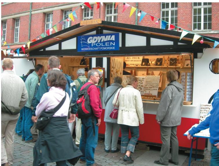
Kieler Woche - stoisko Gdyni.

Współpraca Gdyni i Kilonii ma istotny wymiar w aspekcie gospodarki komunalnej. W 1996 roku nawiązana została współpraca między Ogrodnikami Miejskimi Gdyni i Kilonii, w wyniku której powstała idea zagospodarowania terenu w Gdyni w rejonie ulic Morskiej – Wiejskiej – Chylońskiej przy pomocy partnera niemieckiego. Teren