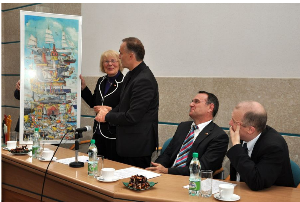
Przekazanie prezentu okolicznościowego od miasta Kilonii