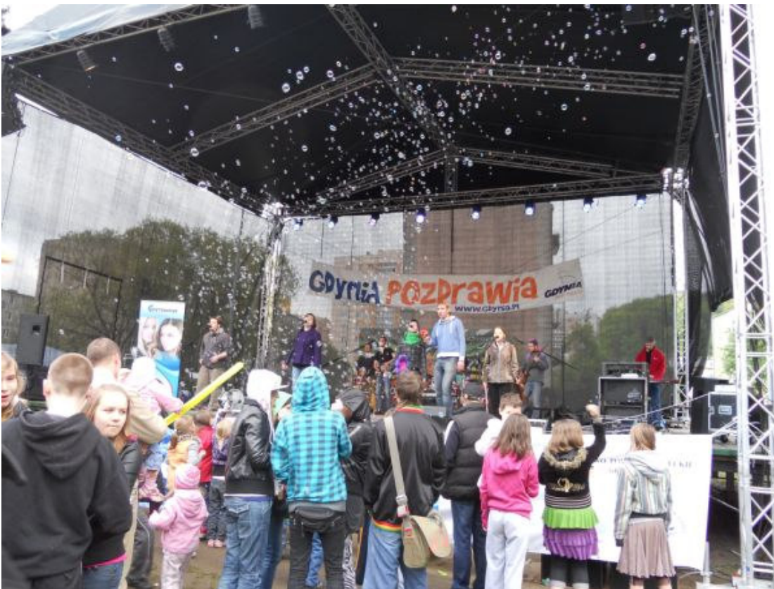
Festyn w Parku Kilońskim w dniu 15.05.2010