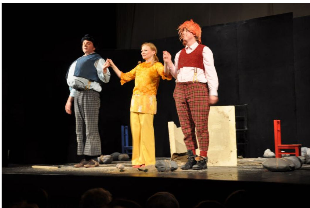
Spektakl „Zwei Monster” w Teatrze Miejskim w Gdyni, 14.05.2010