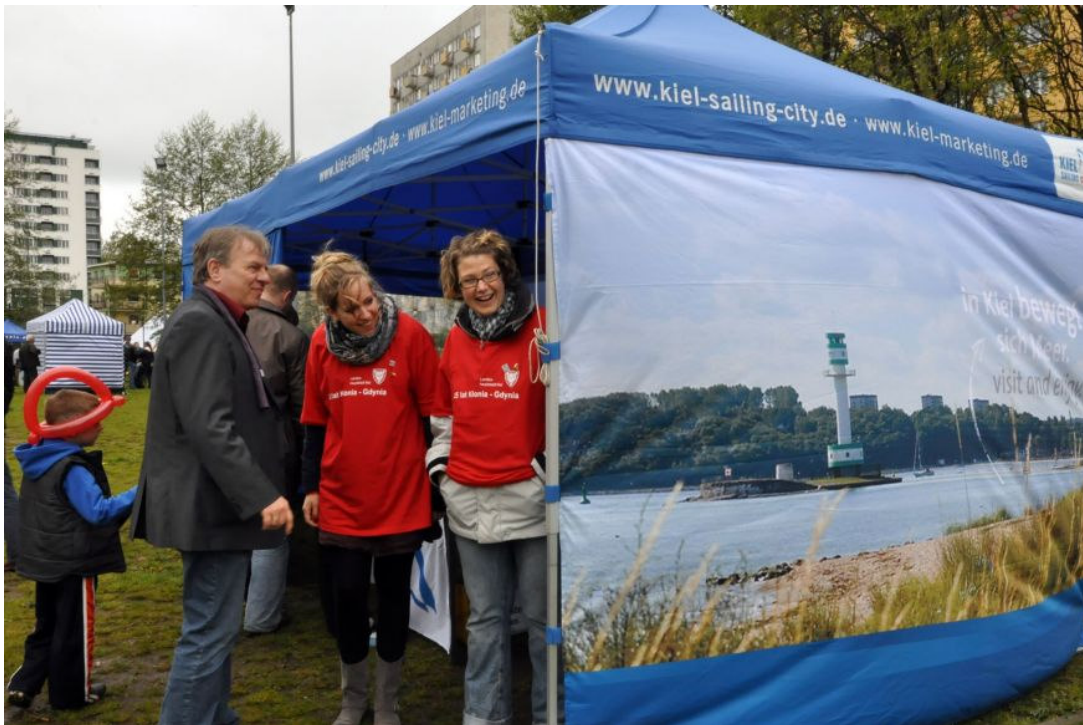
Stoisko Informacji Turystycznej Kilonii na festynie w Parku Kilońskim