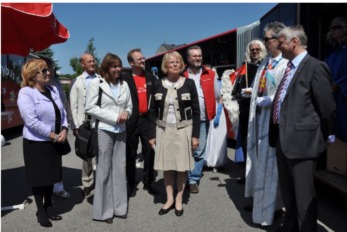
Uroczystość nadania nazwy „Gdynia” jednemu z autobusów kilońskich, 17.06.2010