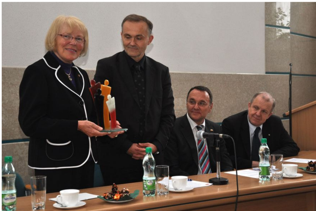
Przekazanie prezentu okolicznościowego od miasta Gdyni