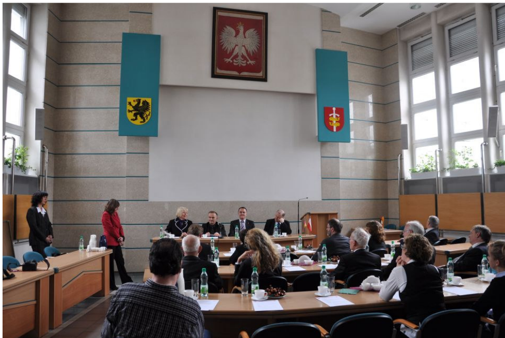
Uroczyste spotkanie w sali Rady Miasta Gdyni w dniu 14.05.2010