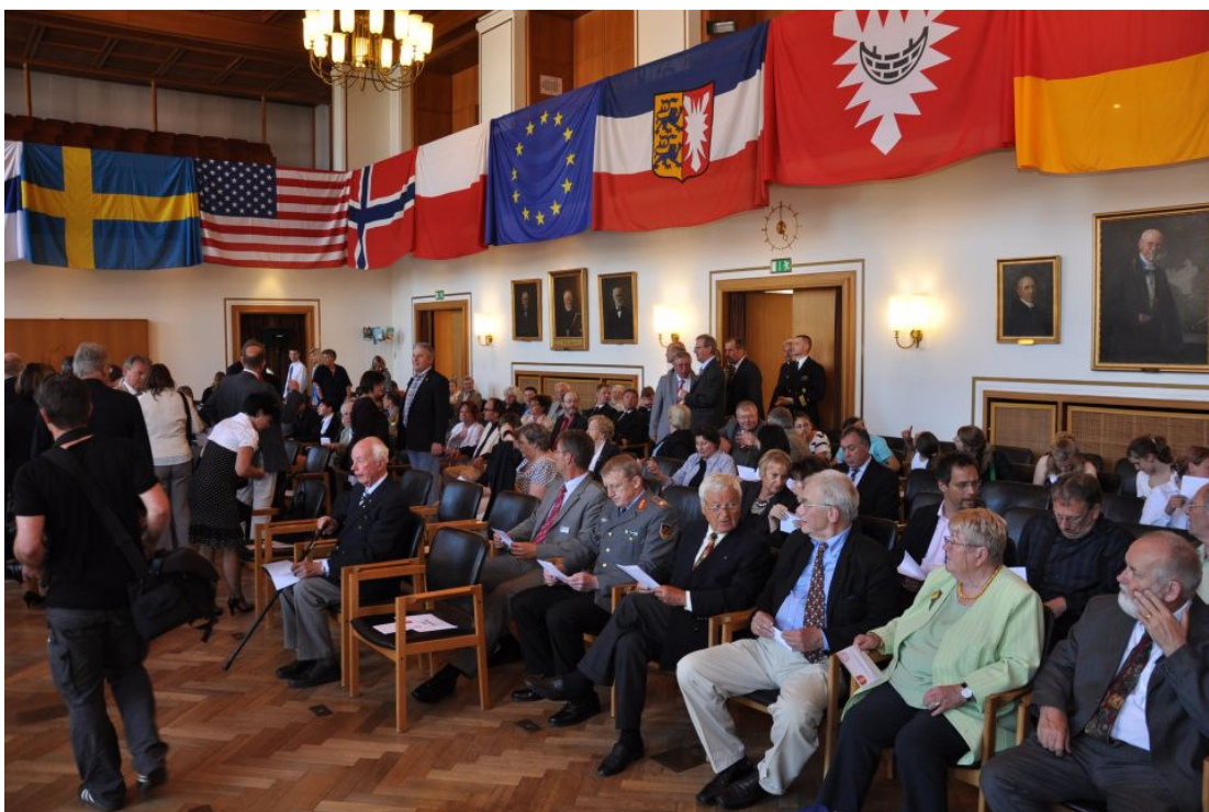
Uroczyste spotkanie w Ratuszu Kilońskim z okazji jubileuszu 25-lecia współpracy Gdyni i Kilonii, 17.06.2010