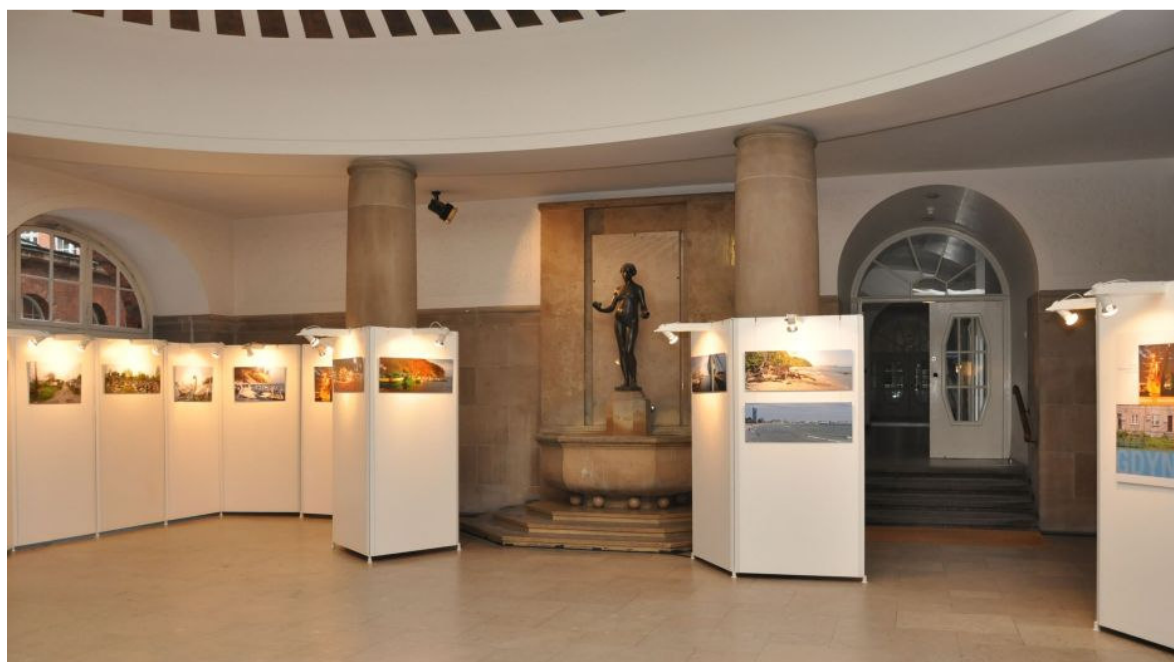
Wystawa fotograficzna pt. „Gdynia – Ansichten einer Stadt”, Ratusz Kiloński, 17.06.2010