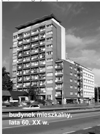
budynek mieszkalny, lata 60. XX w.