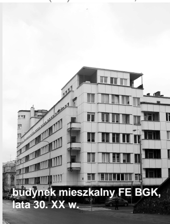
budynek mieszkalny FE BGK, lata 30. XX w.

Urząd Miasta Gdyni, Biuro Miejskiego Konserwatora Zabytków w Gdyni, ul. 10 Lutego 24, 81-364 Gdynia; tel. (58) 66 88 343, fax.: (58) 66 88 210; e-mail: zabytki@gdynia.pl , www.gdynia.pl/modernizm