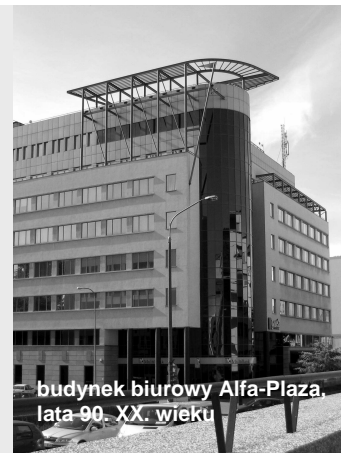
budynek biurowy Alfa-Plaza, lata 90. XX wieku