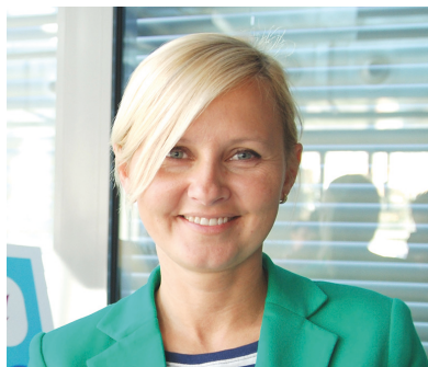
Fot. Sylwia Szumielewicz-Tobiasz