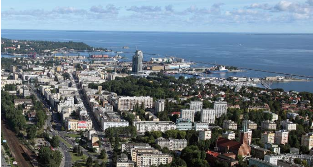
2. Zabytkowe śródmieście na zdjęciu lotniczym

3. Podniesienie świadomości i jej utrwalenie na temat znaczenia śródmieścia dla dziedzictwa kulturowego Polski czyli znaczenie edukacyjne czy nawet propagandowe wpisu do rejestru