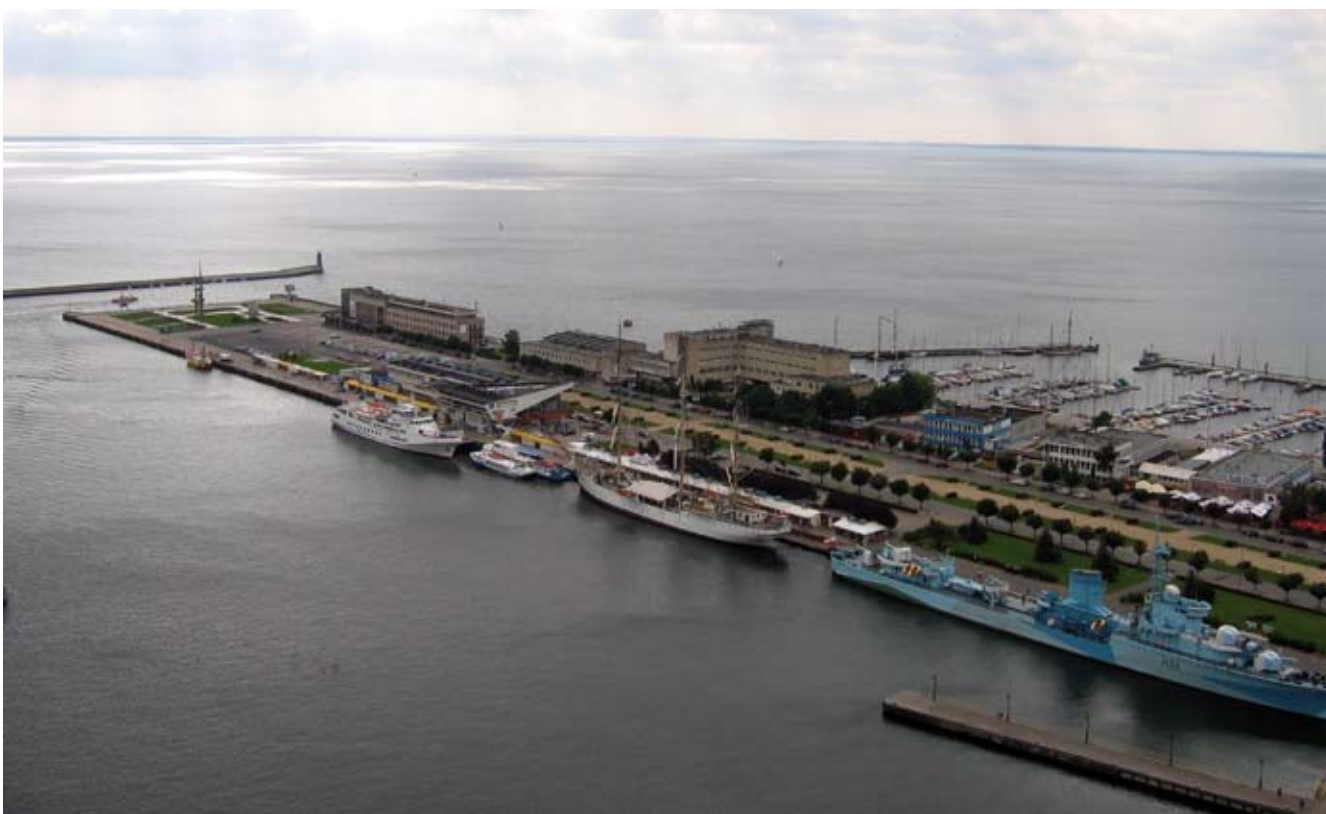
3. Molo Południowe z lat 30. XX w. – jeden z ważniejszych elementów zabytkowego układu urbanistycznego śródmieścia