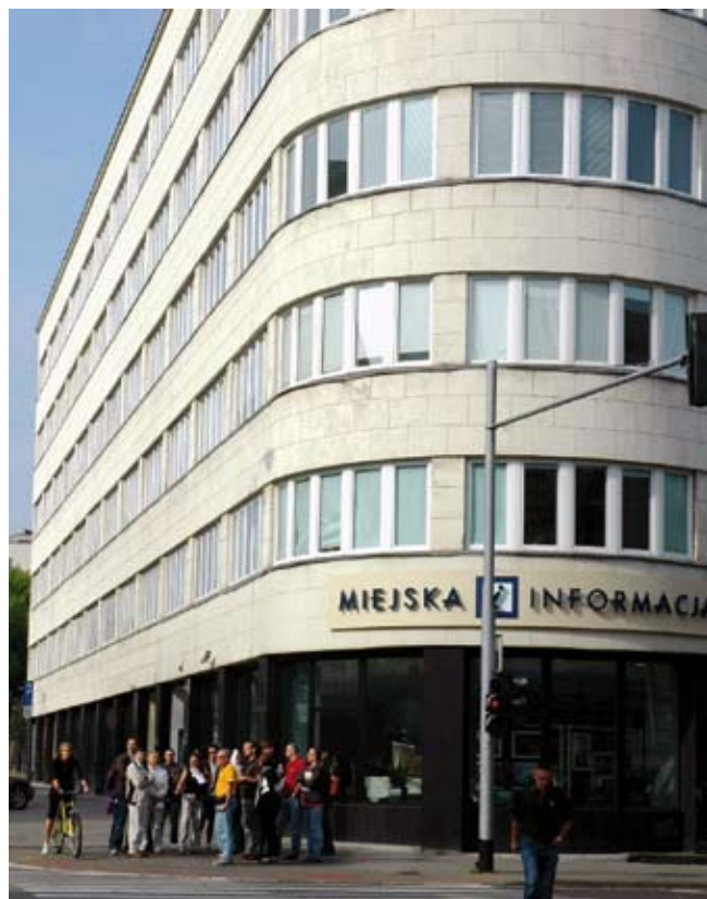
10. Jedna z siedemnastu grup turystów zwiedzających śródmieście Gdyni w czasie Dnia Modernizmu 26 września 2010 r., fot. A. Orchowska-Smolińska

Dwie opisane wyżej regulacje - finansowanie remontów budynków i ochrona lokalna budynków są wzajemnie ze sobą powiązane. Są próbą zrealizowa-