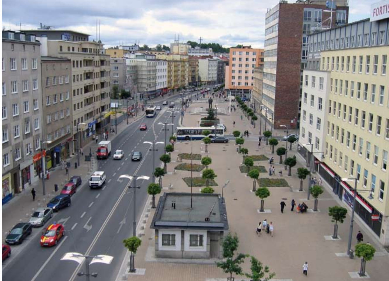
4. Plac Kaszubski na terenie zabytkowego układu urbanistycznego Gdyni po rewaloryzacji