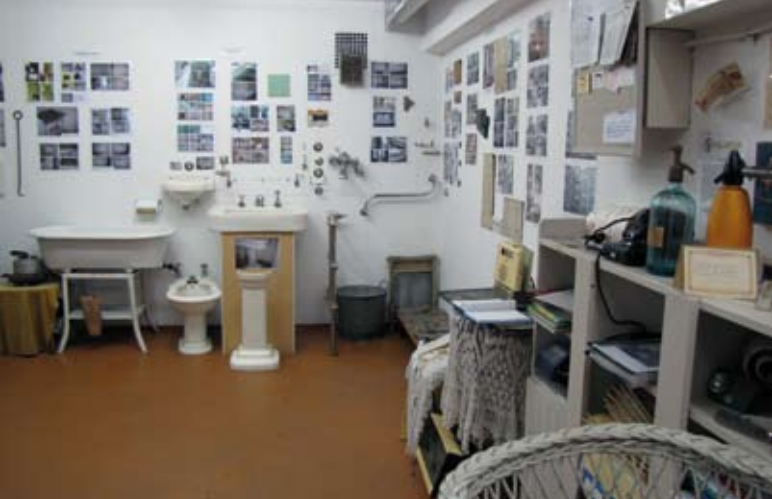
9. Społeczne muzeum utworzone przez mieszkańców w zabytkowym budynku przy ul. 3 Maja 27-31, fot. autor