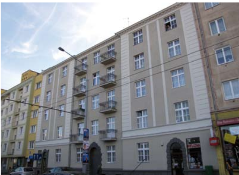
7. Kamienica przy ul. Wójta Radtkego 43 po zakończeniu prac konserwatorskich przy elewacji

na wprowadzenie systemu dofinansowania remontów zabudowy śródmiejskiej, równocześnie podjęto kroki w celu szybkiego objęcia terenu układu zabytkowego miejscowymi planami zagospodarowania przestrzennego. Trzecim elementem działań jest popularyzacja i promocja architektury, zwłaszcza modernizmu.