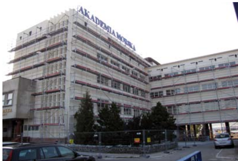
6. Prace konserwatorskie przy elewacjach zabytkowego Domu Żeglarza Polskiego, obecnie Wydziału Navigacyjnego Akademii Morskiej, 2010 r.

Udzielnie przez samorządy lokalne dotacji na prace przy zabytkach wpisanych do rejestru przewiduje obowiązująca od 2003 r. ustawa o ochronie zabytków i opiece nad zabytkami. Od początku obowiązywania tej ustawy, gmina Gdynia udzielała dotacji na prace przy budynkach zabytkowych. W latach 2003-2008 udzielono dotacji na działania przy 17 budynkach, czyli dotowano prace przy około 25% wszystkich wpisanych do rejestru zabytków na terenie Gdyni.