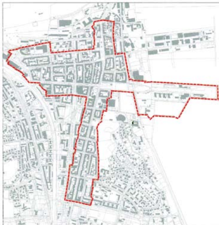
1. Układ urbanistyczny śródmieścia Gdyni wpisany w 2007 r. do rejestru zabytków - plan