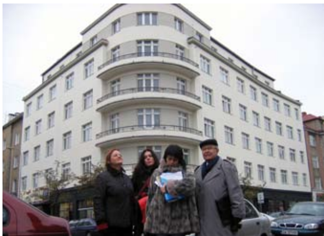
5. Kamienica Hundsdorffa przy ul. Starowiejskiej 7, po odrestaurowaniu elewacji