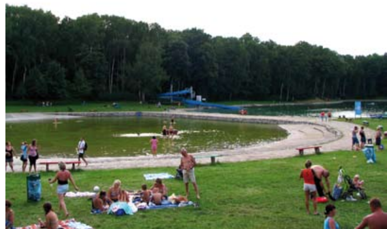
2. Zabrze-Maciejów, Kąpielisko Leśne, 1933-1936