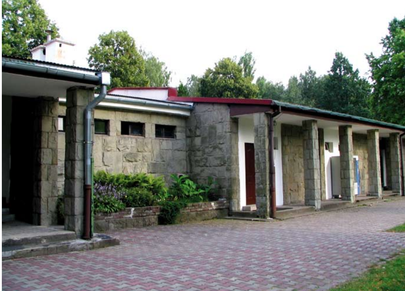
3. Zabrze-Maciejów, Kąpielisko Leśne, budynek przebieralni, 1933-1936

gi boksów przebieralni przesłonięte odcinkami ścian. Ściany te oraz filary zostały wzniesione z bloków grubo ciosanego piaskowca. Niecka ma kształt nieregularny, betonowo-ziemna grobla oddziela część dla pływających od części dla niepływających.