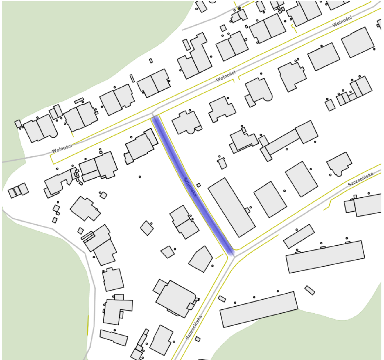
■ ul. Sztumska - przebieg