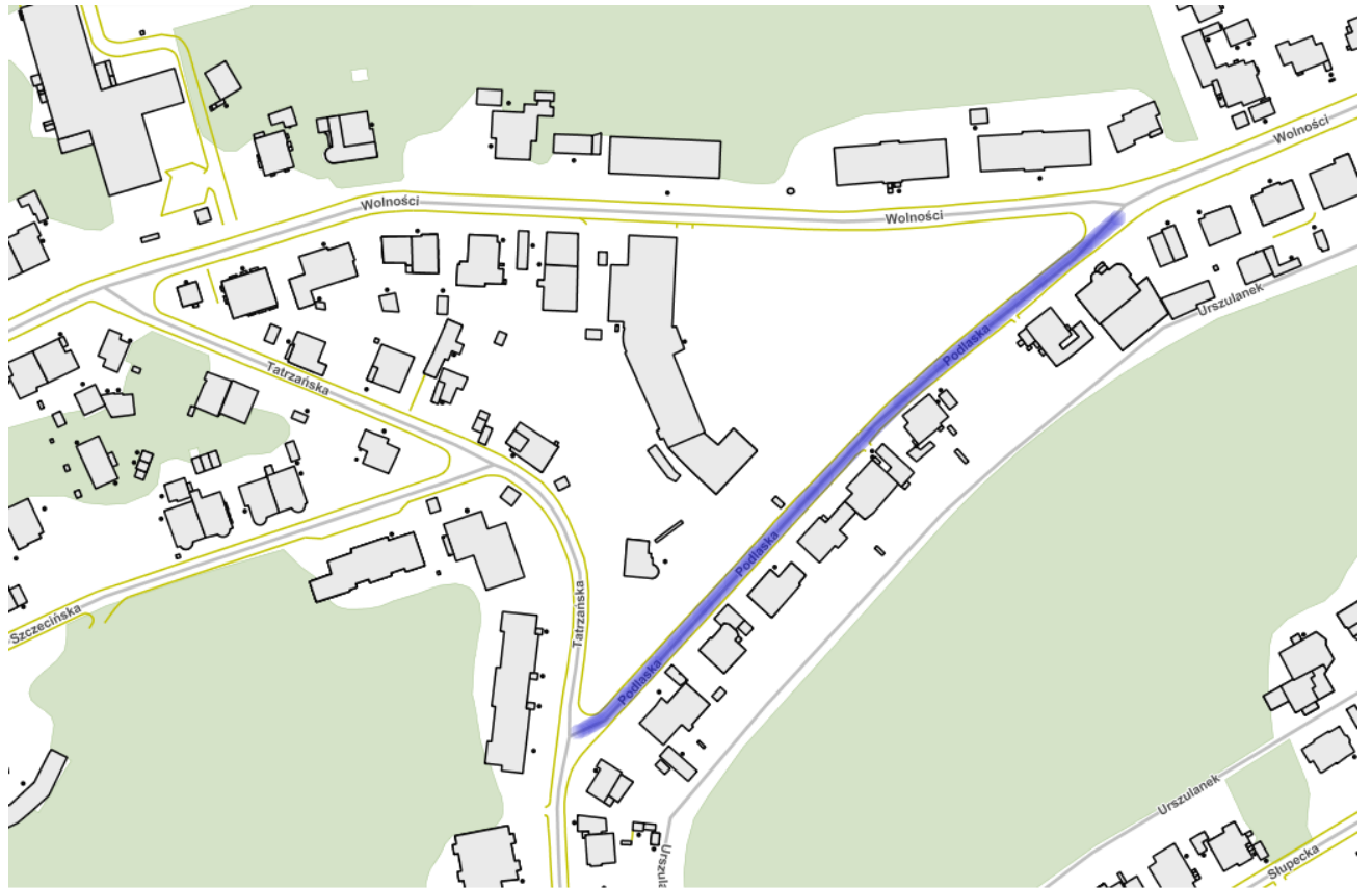
■ ul. Podlaska - przebieg