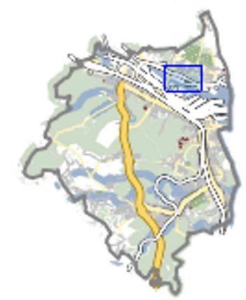
MAPA PRZEGLĄDOWA LOKALIZACJI TERENU OPRACOWANIA