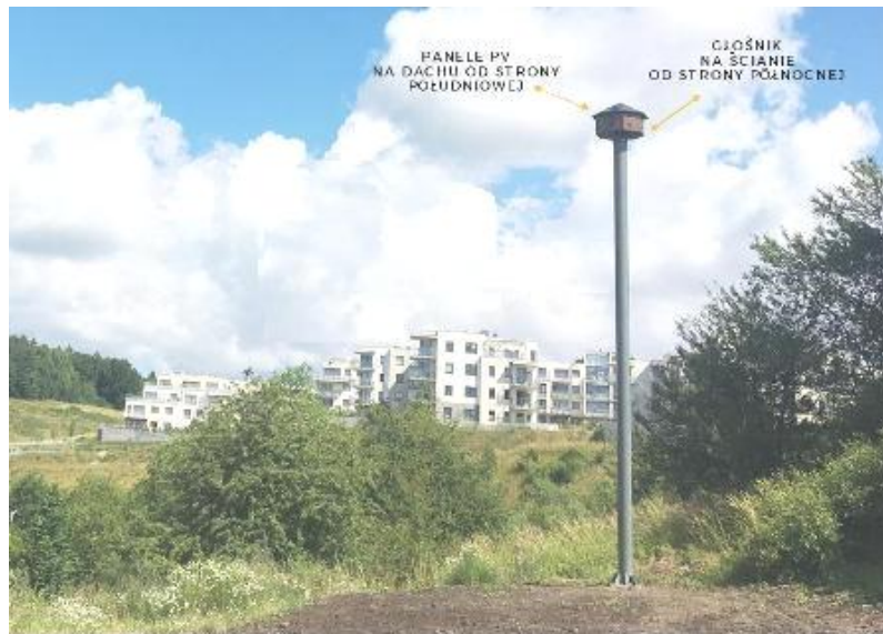
Fot. 14. Lokalizacja elementów systemu wabienia.

Autonomiczne zasilanie ze źródeł energii odnawialnej (promienie słoneczne) umożliwia odtwarzanie dźwięków przez 8 godzin dziennie. System odtwarza dostarczone sekwencje dźwiękowe z nagraniami jerzyków w wybranych godzinach, których układem można zdalnie sterować.