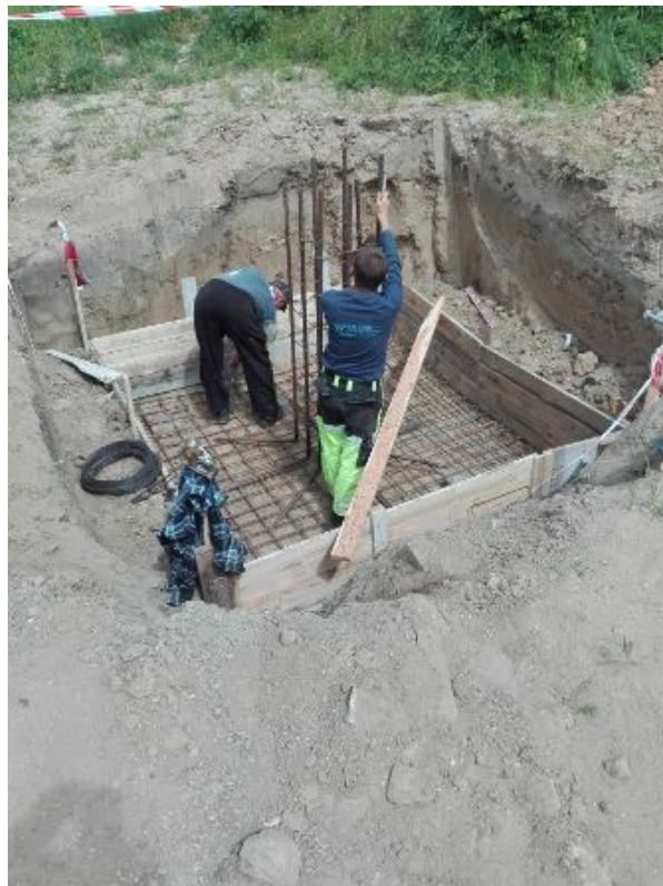
Fot. 3. Zbrojenie fundamentu.