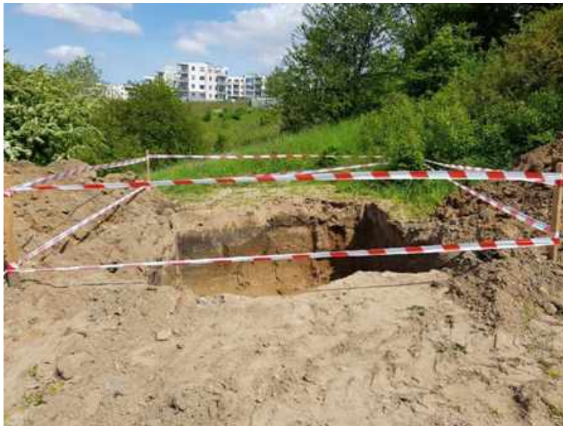
Fot. 2. Wykop pod fundament.