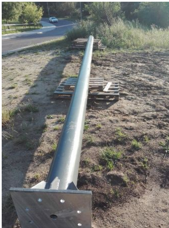
Fot. 6. Słup przed montażem.