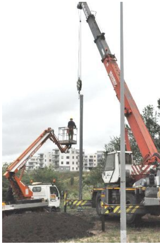
Fot. 8. Montaż słupa na fundamencie.