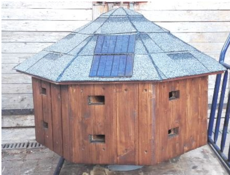
Fot. 9. Zestaw budek dla jerzyków przed montażem.

Zainstalowany zestaw składa się z kompleksu niewielkich budek lęgowych specjalnie przystosowanych do zasiedlenia przez jerzyki, odpowiednio zaizolowanych termicznie oraz zabezpieczonych przed wilgocią. Dodatkowo wszystkie nisze gniazdowe zostały wypełnione żwirem o różnej granulacji, co uniemożliwi przemieszczanie się jajom złożonym w gniazdach przez jerzyki.