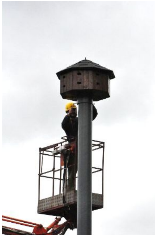
Fot. 13. Montaż zestawu budek dla jerzyków.