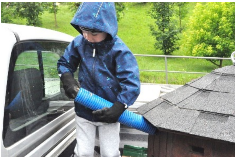
Fot. 10. Wolontariusz wypełniający nisze gniazdowe żwirem.