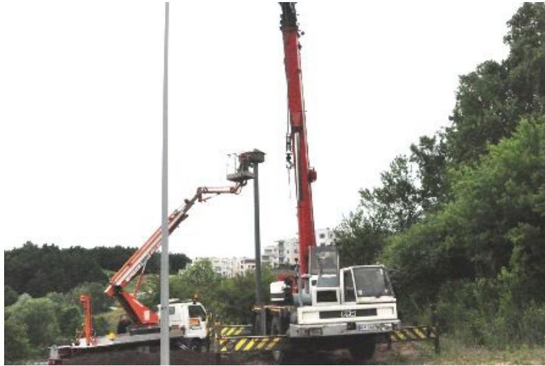
Fot. 12. Montaż zestawu budek dla jerzyków.