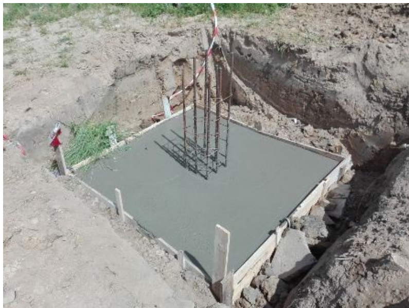
Fot. 4. Betonowanie fundamentu.