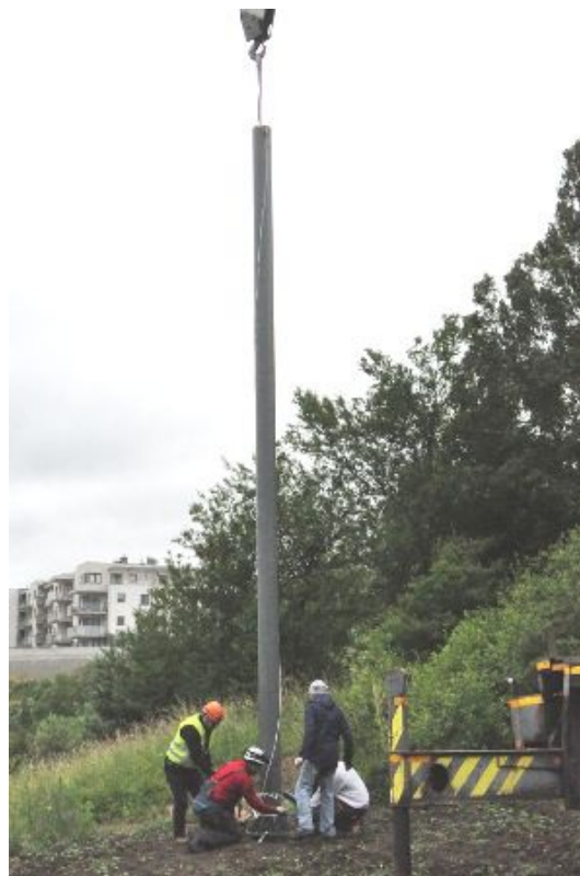
Fot. 7. Montaż słupa na fundamencie.