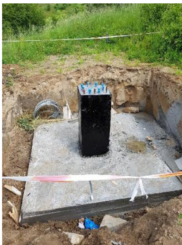
Fot. 5. Gotowa stopa fundamentowa przed zasypaniem.