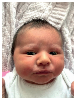
Antonina , 50 cm, 2790 g, 27.11