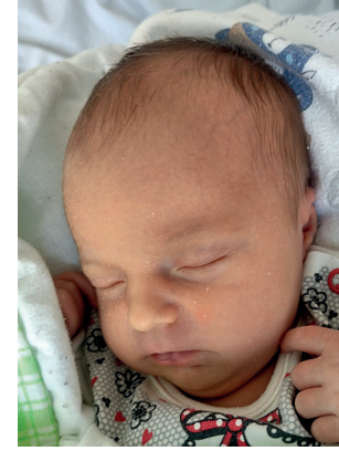
Róża , 50 cm, 2700 g, 30.09