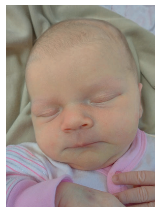
Zuzia , 54 cm, 3780 g, 25.09