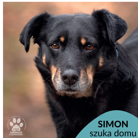
SIMON szuka domu

Czaruś posiada aktualne szczepienia, jest po zabiegu kastracji, posiada chip.