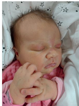
Mia , 58cm, 4280 g, 21.11