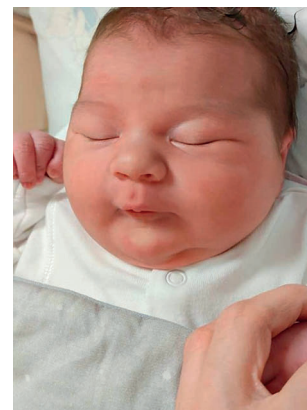
Jadwiga Ewa , 58 cm, 4160 g, 15.11