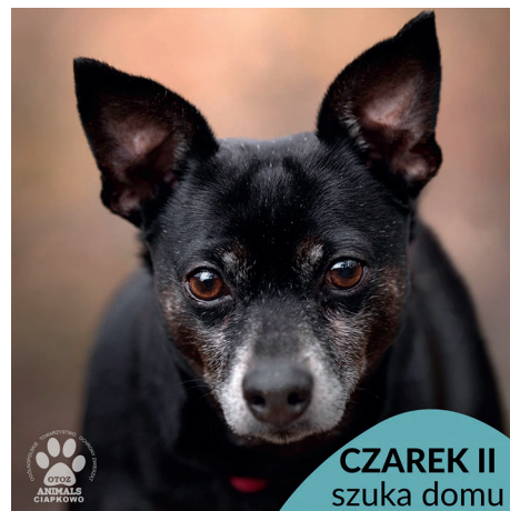
CZAREK II szuka domu

Kontynuujemy rubrykę, dzięki której, mamy nadzieję, kolejne porzucone psy i koty ze schroniska w „Ciapkowie” znajdą ciepły dom. Miejskie schronisko „Ciapkowo” prowadzone jest przez Ogólnopolskie Towarzystwo Ochrony Zwierząt Animals.