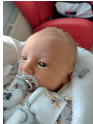
Leon , 54 cm, 3615 g, 20.11