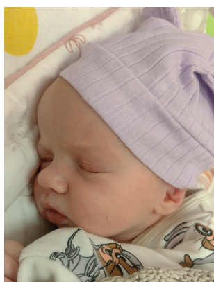
Sofia , 54 cm, 3350 g, 28.09