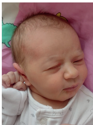
Aniela , 48 cm, 2830 g, 16.11

Podmiot Lecznicy Samorządu Województwa Pomorskiego