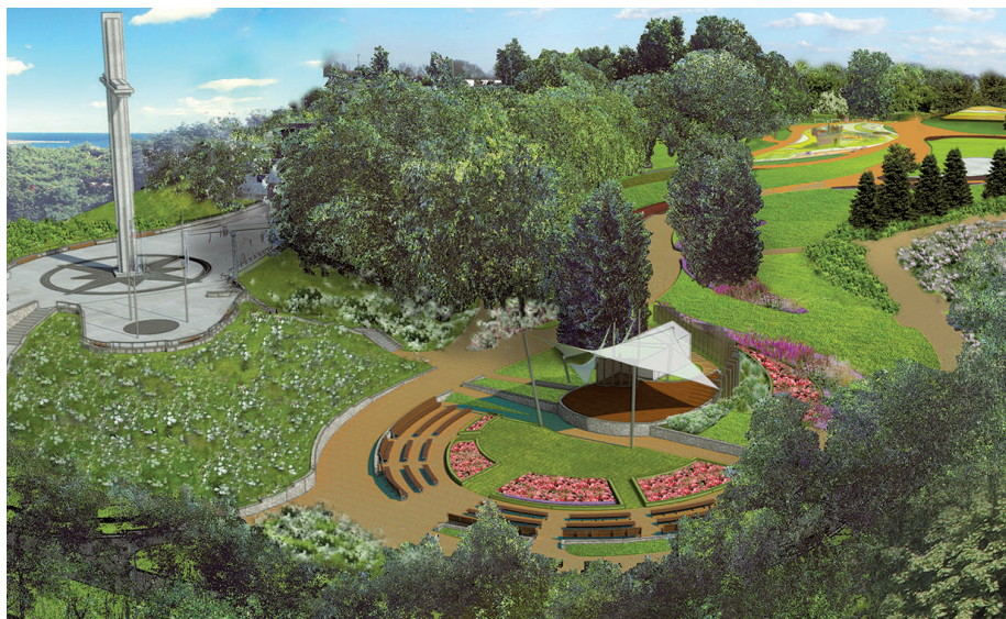
Park na Kamiennej Górze po przebudowie – wizualizacja, mat. ZDiZ

- Przebudowa Kamiennej Góry była planowana od kilku lat. Najpierw powstała kolejka linowa, a teraz – po uporządkowaniu formalności i konsultacjach z Radą Dzielnicy – rozpoczęły się prace na szczycie. Miejsce to będzie mogło cieszyć oczy i dawać wytchnienie od zgiełku miasta również osobom,