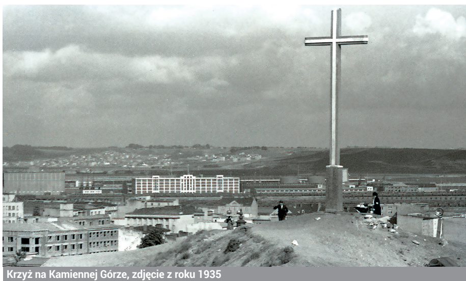
fot. Henryk Fodepolski, 1935. [ze zbiorów Muzeum Miasta Gdyni]