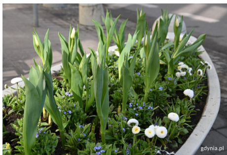
Gdyńskie kwietniki w kształcie łódek wypełniły się wiosennymi kwiatami