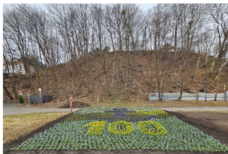
Zwycięski projekt w konkursie „Gdynia Malowana Kwiatami” autorstwa Jakuba Paczula

Wiosenne działania nie ograniczają się do centrum. W 2026 roku w Gdyni zaplanowano szeroko zakrojone nasadzenia drzew – aż 294 nowe egzemplarze pojawią się w 19 dzielnicach miasta. Wśród gatunków przewidzianych do posadzenia znajdują się m.in.: lipy drobnolistne „Greenspire”, klony pospolite, wiśnie ozdobne, dęby szypułkowe, głogi, kasztanowce czerwone, jesiony „Altena”. Wśród tegorocznych nasadzeń pojawi się także polska odmiana lipy srebrzystej „Varsaviensis”, która dobrze radzi sobie w środowisku miejskim i jest odporna na zanieczyszczenia powietrza oraz okresowe susze.