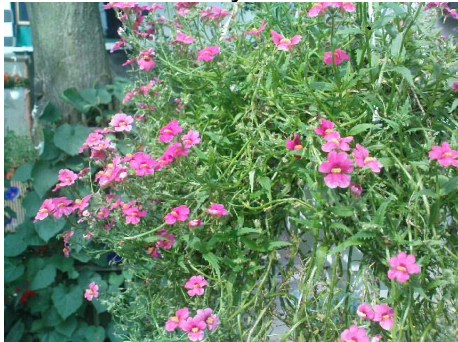
Diaskia o różowych kwiatach