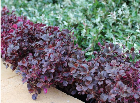
Irezyna odm. Purple Lady