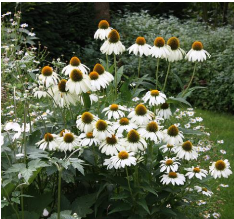
Jeżówka purpurowa odm. Alba