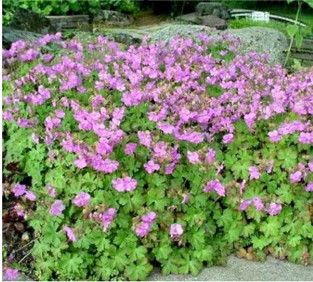
Bodziszek kantabryjski odm. Cambridge