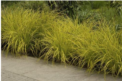
Turzyca sztywna odm. Aurea