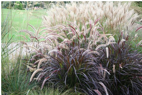
Rozplenica szczecinkowata odm. Rubrum