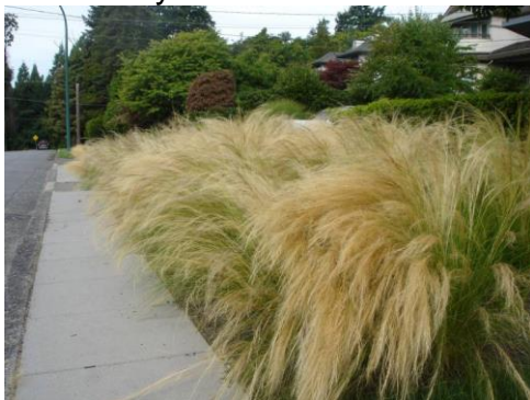
Ostnica mocna odm. Pony Tails