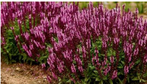
Szałwia odm. różowa