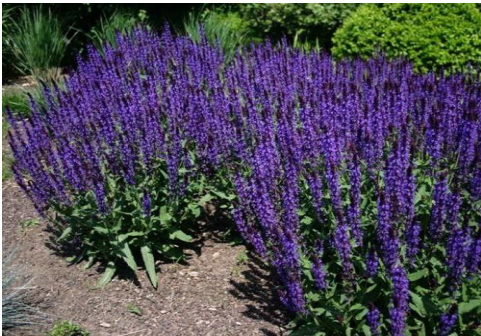
Szałwia odm. Merlau Blue