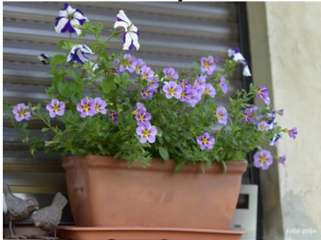
Diaskia o fioletowych kwiatach