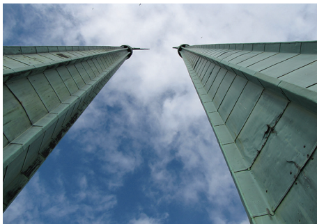
Iglice na wieży kościoła – najwyższe punkty w tej części Gdyni.