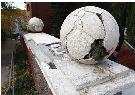
Dekoracyjne kule na murze w trakcie konserwacji.