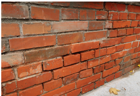
Mur w trakcie konserwacji.