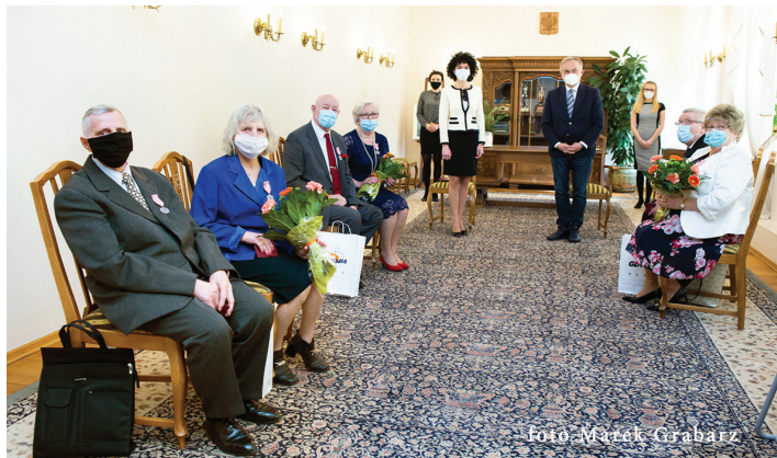
Uroczystość 10 marca, godz. 13.30