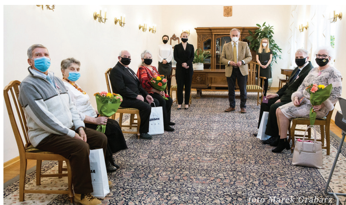
Uroczystość 11 marca, godz. 14.30, fot. Marek Grabarz