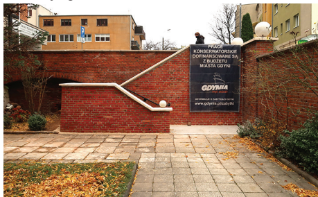
Schody na dziedzińcu w trakcie prac w 2020 r.