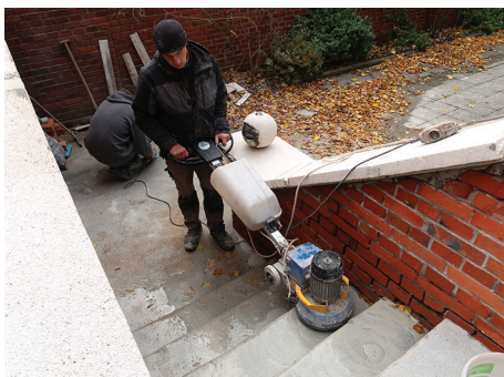
Szlifowanie powierzchni schodów z lastryka.