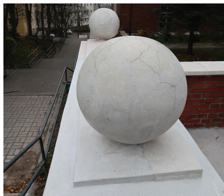
Kule i zwiewczenie muru po odrestaurowaniu.