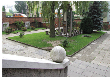
Dziedziniec przed wejściem do klasztoru.