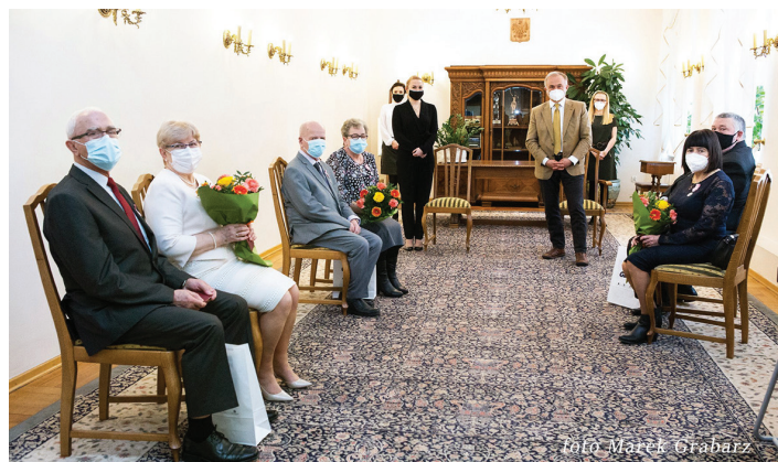
Uroczystość 11 marca, godz. 13.30