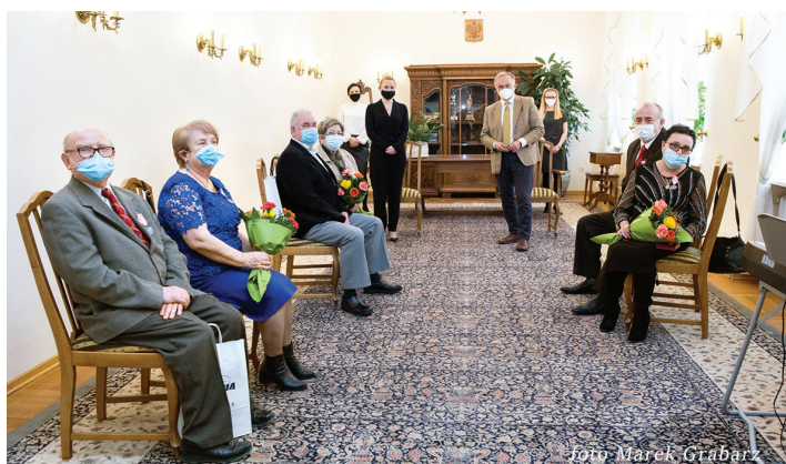
Uroczystość 11 marca, godz. 14.00, fot. Marek Grabarz