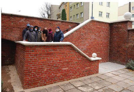
Odbiór prac przy schodach.

Opracowanie tekstu i zdjęcia: Biuro MKZ.