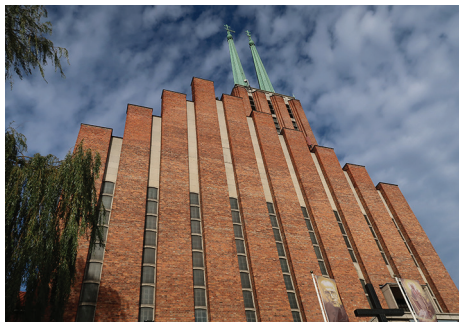
Elevacja główna kościoła.

Warto wspiąć się na wzgórze, aby zobaczyć kościół oraz wejść na niepowtarzalny dziedziniec przed klasztorem.