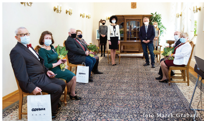
Uroczystość 10 marca, godz. 14.00