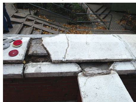
Zwiewczenie muru w trakcie konserwacji