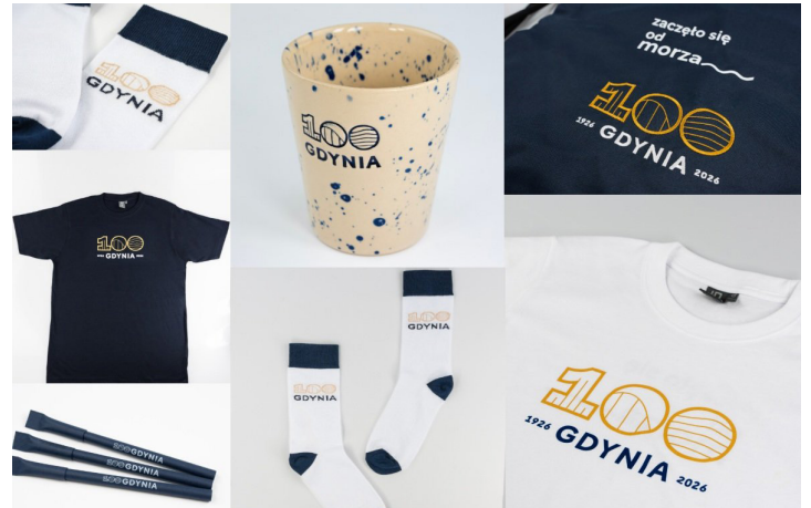
Gadżety z logo 100-lecia Gdyni

W ofercie sklepu internetowego i w siedzibie Miejskiej Informacji Turystycznej (ul. 10 Lutego 24) można znaleźć między innymi: kalendarz 2026 – 35 zł, kubek ceramiczny – 80 zł, T-shirty – 60 zł, czapki z daszkiem – 45 zł, worki – 30/60 zł, breloki – 15/30 zł, piórniki – 30 zł, długopisy w pudełku – 25 zł, krówki – 25 zł, herbatę – 25 zł, skarpetki – 25 zł, pin – 25 zł, otówki i długopisy – 5 zł, plakaty Jana Rutki – 120 zł.