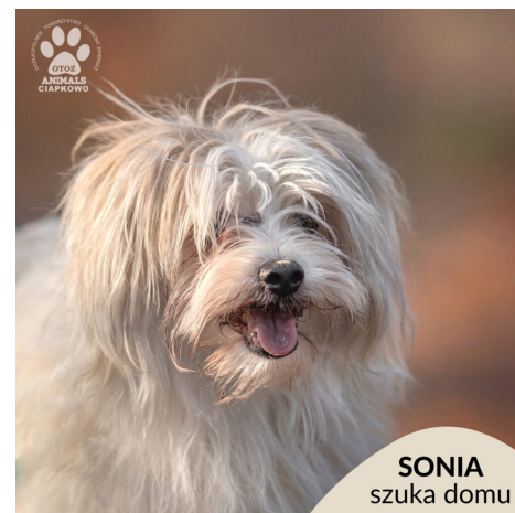
SONIA szuka domu

Kontynuujemy rubrykę, dzięki której, mamy nadzieję, kolejne porzucone psy i koty ze schroniska w „Ciapkowie” znajdą ciepły dom.