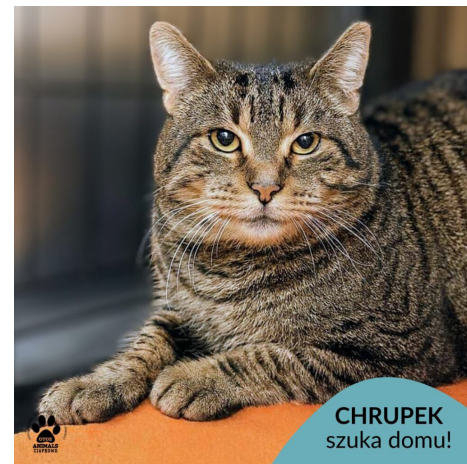
CHRUPEK szuka domu!

Sonia jest spokojną, nieśmiałą i nieufną suczką. W kontakcie z nowymi osobami potrzebuje czasu i cierpliwości żeby zaufać. Bez problemu dogaduje się z innymi psami.