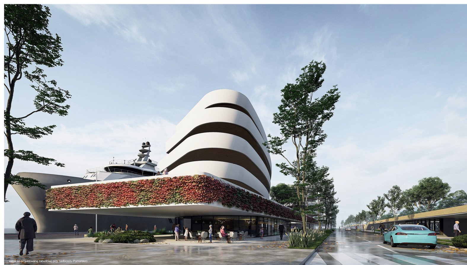
Widok na projektowaną zabudowę przy nadbrzeżu Pomorskim