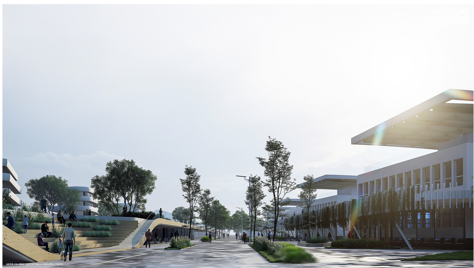
Widok na aleję spacerową w kierunku morza