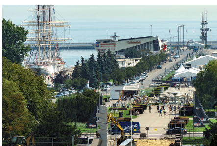
Skwer Kościuszki i Molo Południowe