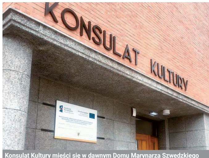
Konsulat Kultury mieści się w dawnym Domu Marynarza Szwedzkiego

Nowy obiekt na kulturalnej mapie miasta ulokował się w dawnym Domu Marynarza Szwedzkiego. Stąd też w ofercie znajdzie się wiele wydarzeń tematycznie nawiązujących do kultury skandynawskiej. Zanim jednak Konsulat rozpocznie regularną działalność, gdynianie będą mieli okazję wziąć udział trzydniowej inauguracji.