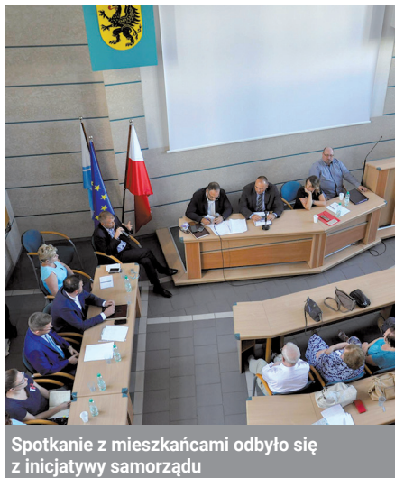
Spotkanie z mieszkańcami odbyło się z inicjatywy samorządu

Mniej więcej od wiosny mieszkańcy centrum borykają się z problemem unoszącego się w powietrzu pyłu węglowego, który powstaje wskutek przeładunku węgla na terenie Morskiego Terminala Masowego. Uciążliwości zamiast maleć rosły, stąd po interwencji prezydenta – na początku lipca pisemnie zażądał od Zarządu Morskiego Portu w Gdynia SA oraz Morskiego Terminalu Masowego Gdynia Sp. z o.o. przestrzegania obowiązującego prawa i zaprzestania negatywnego oddziaływania na zdrowie i majątek mieszkańców Gdyni – oraz kontrolach Wydziału Środowiska Urzędu Miasta Gdyni i Wojewódzkiego Inspektoratu Ochrony Środowiska, z inicjatyw samorządu w gdyńskim magistracie odbyło się specjalne spotkanie. Uczestniczyli m.in. przedstawiciele portu oraz Morskiego Terminala Masowego. Wysłuchali skarg