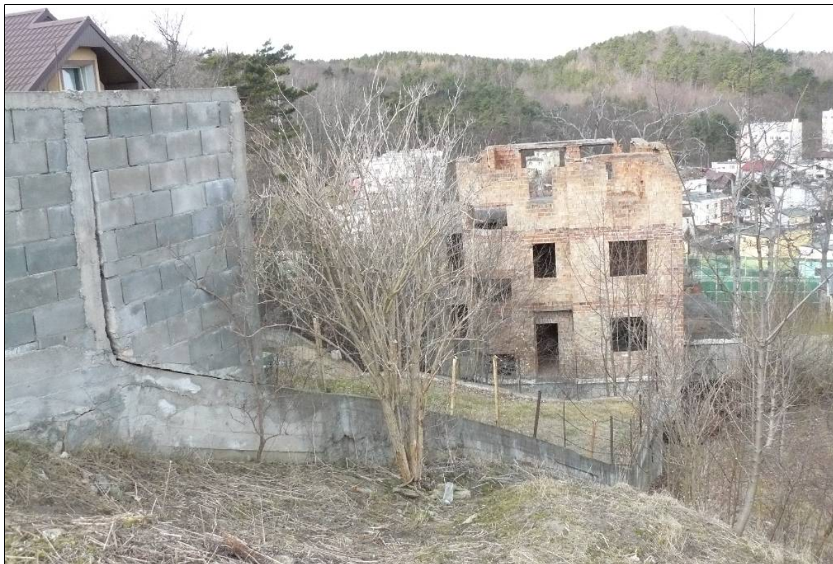
Uszkodzone ogrodzenie po zachodniej stronie osuwiska