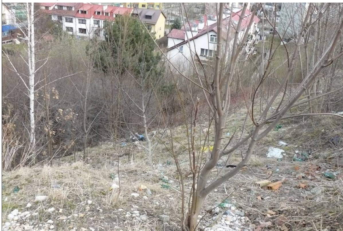
Skarpa główna osuwiska