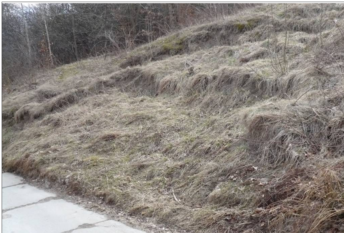
Dolna część osuwiska