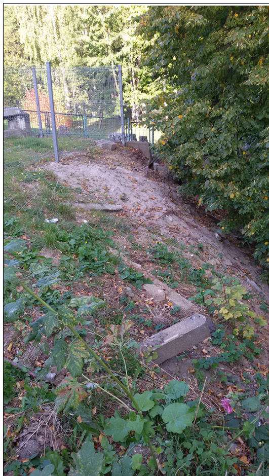
Aktywna część osuwiska