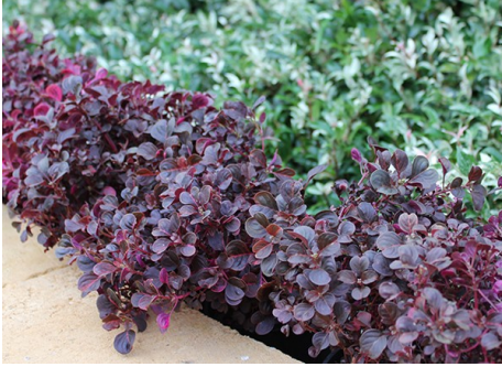
Irezyzna odm. Purple Lady