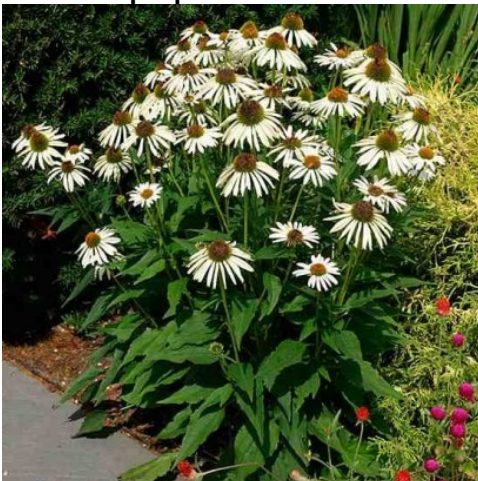
Jeżówka purpurowa 'Alba'