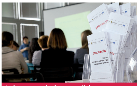
Jedno ze spotkań uczestników

Dzięki wsparciu ekspertów, ustaleniu strategii działania, rozmowom z psychologiem i doradcą