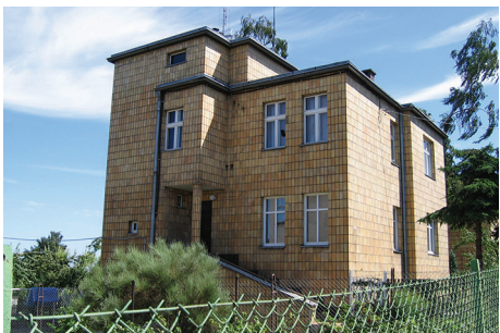
Willa w Orłowie z elewacjami oblicowanymi żółtymi płytkami.

Opracowanie tekstu: Biuro Miejskiego Konserwatora Zabytków.