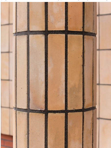
Detal elewacji willi w Orłowie, węższymi płytkami oblicowano okrągłe słupy strefy wejściowej, widoczne czarne spoiny z drobnym białym kruszywem.