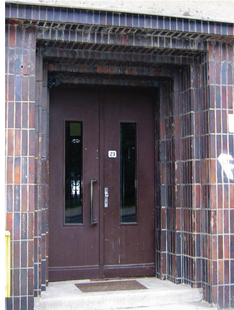
Portal części mieszkalnej budynku przy ul. Legionów, brązowymi płytkami oblicowano również elewację pawilonu sklepowego.