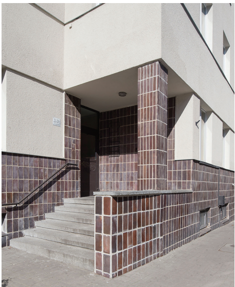
Strefa wejścia do budynku mieszkalnego ZUS przy ul. 3 Maja 22-24, brązowymi płytkami oblicowano ściany w podcieniu i cokół.