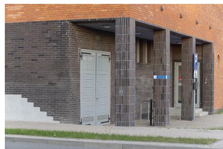
Elewacja budynku firmy „Bananas” przy ul. Polskiej 21, brązowe płytki ceramiczne zastosowano w strefach wejściowych, zestawiając je z czerwonymi ceglami licowymi.