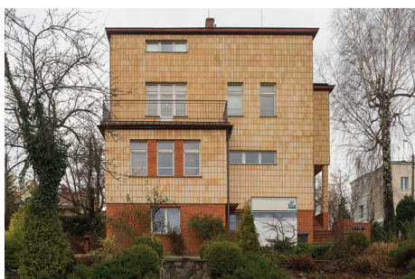
Elewacja willi w Orłowie oblicowanej żółtymi płytkami ceramicznymi kontrastowanymi z ciemnymi spoinami, elewację w latach 2007-2008 poddano pracom konserwatorskim.

Na prace konserwatorskie przy elewacjach budynków historycznych w tym oblicowanych płytkami ceramicznymi można uzyskać dotacje z budżetu miasta. Więcej informacji na ten temat: www.gdynia.pl/zabytki/dotacje .