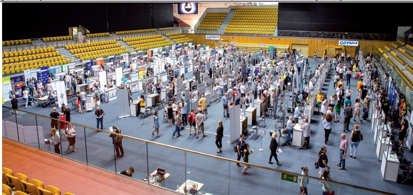
Okazją do spotkań z pracodawcami z całego Trójmiasta były targi pracy: dzielnicowe na Oksywiu i Cisowej oraz ogólnomiastowskie, w Gdynia Arena (na zdjęciu)