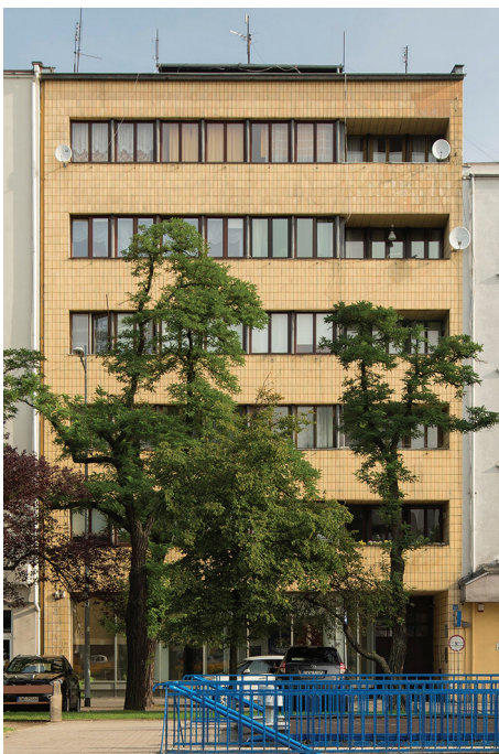
Kamienica przy skwerze Kościuszki 16, żółtymi płytkami oblicowano całą płaszczyznę elewacji.