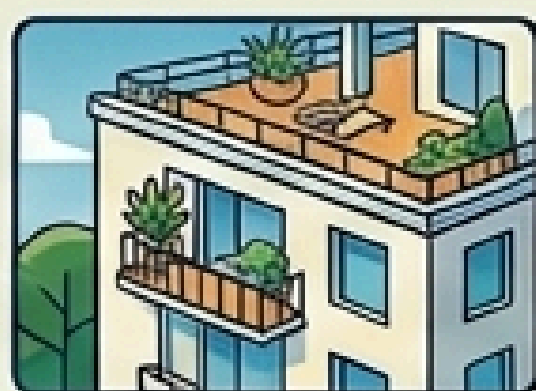
3. NABZIEMNE CZĘŚCI BUDYNKÓW WIELORODZINNYCH