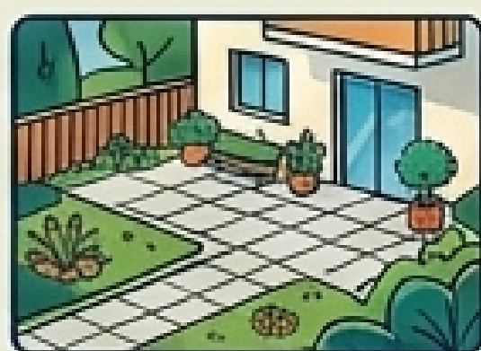
2. PRZYZIEMNE CZĘŚCI BUDYNKÓW WIELORODZINNYCH