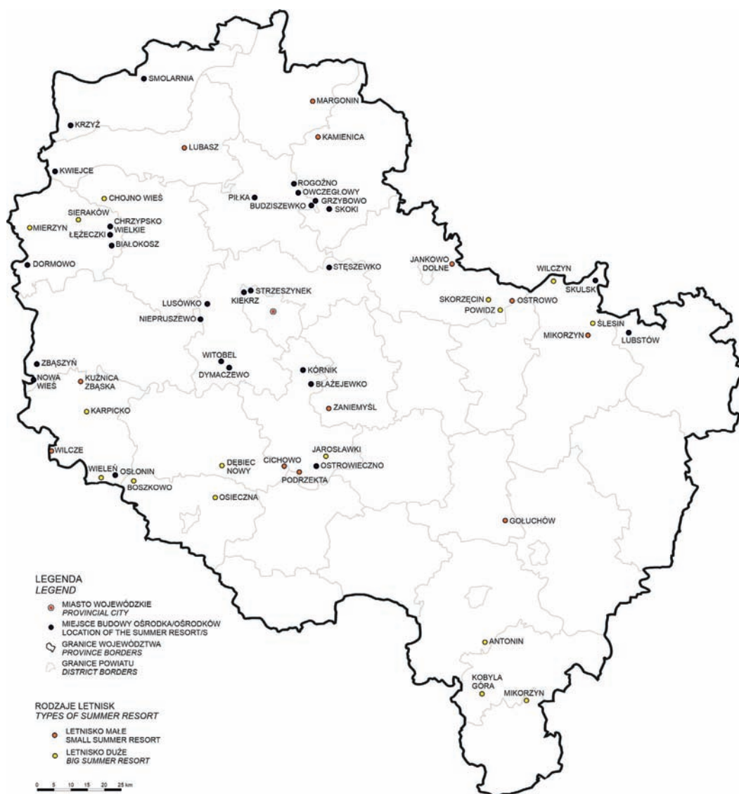
2. Map of the former Poznań Voivodship with marked locations of airports (distinguishing between large, marked in yellow, and small, marked in orange) and places where individual resorts were located (by the author)