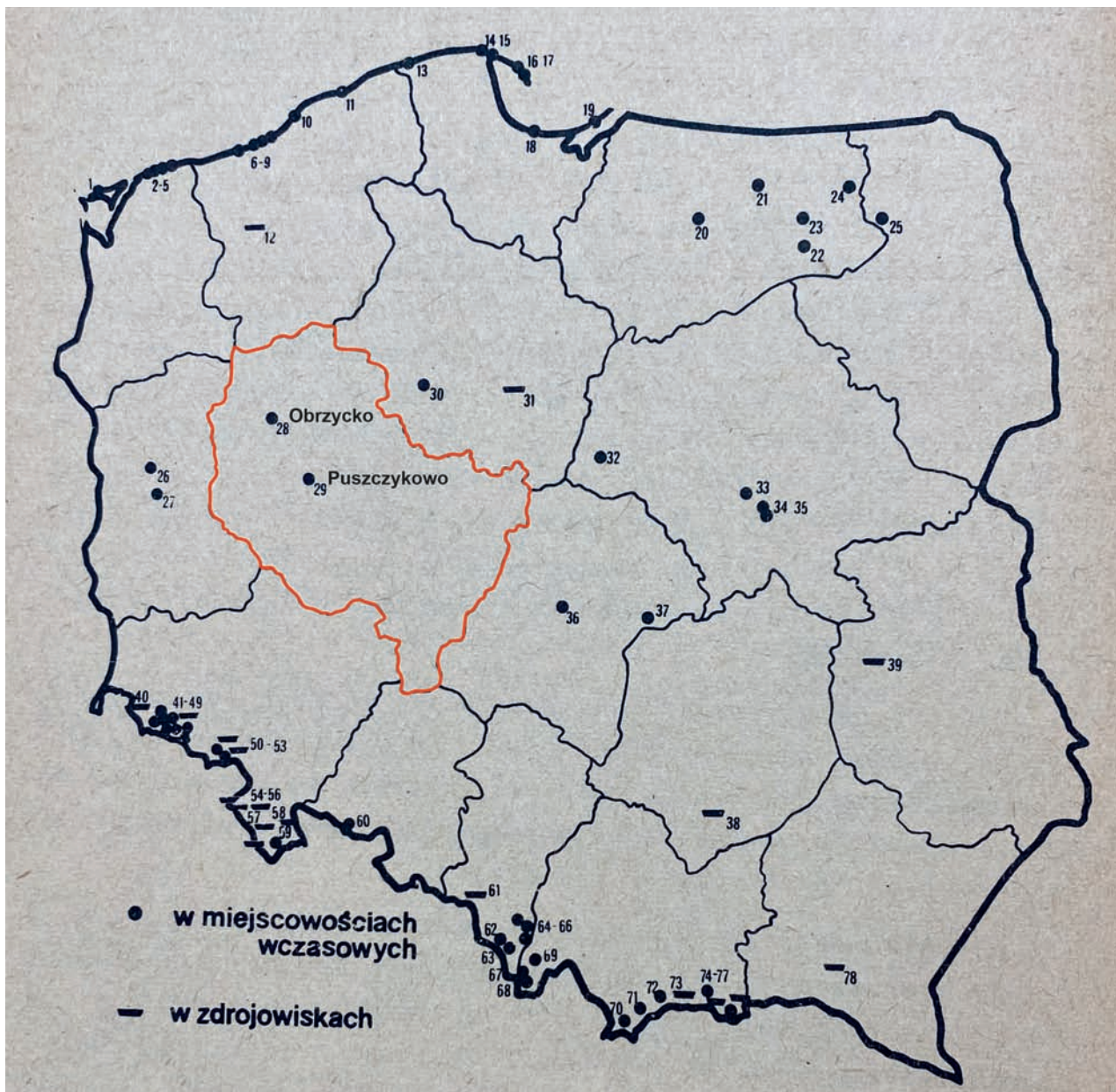
1. Mapa rozmieszczenia obiektów FWP w roku 1966 z zaznaczonymi dwoma lokalizacjami w województwie poznańskim (opr. autorki na podst. mapy J. Szuszkiewicza, w: J. Szuszkiewicz, „Urządzenia wczasowe, turystyczne i uzdrowiskowe w Polsce. Stan istniejący i lokalizacja”, Warszawa 1966, s. 78)

1. Map of distribution of FWP facilities in 1966, showing two locations in the Poznań voivodship (author's copy based on the map by J. Szuszkiewicz, in J. Szuszkiewicz, "Urządzenia wczasowe, turystyczne i uzdrowiskowe w Polsce. Stan istniejący i lokalizacja", Warszawa 1966, p. 78)