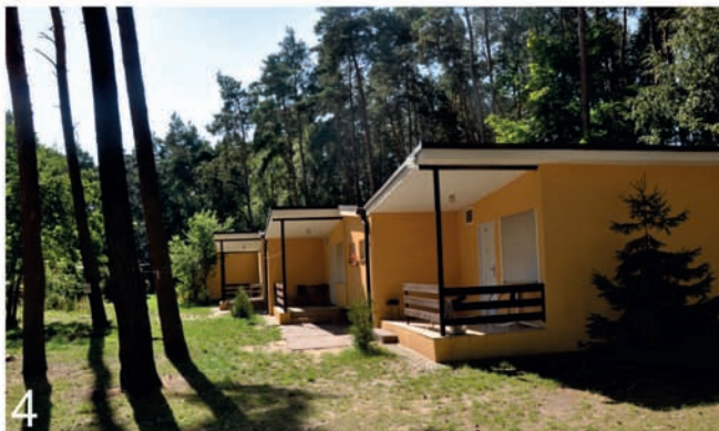
4. Przykłady architektury różnego typu ośrodków wypoczynkowych w Wielkopolsce: 1) ośrodek w Łęcznej (typ 1); 2) ośrodek w Boszkowie (typ 2); 3) ośrodek w Kiekrzu przed modernizacją (typ 3); 4) ośrodek w Ślesinie po modernizacji (typ 4) 4. Examples of architecture of various types of resort centres in Wielkopolska: 1) centre in Łęczna (type 1); 2) centre in Boszków (type 2); 3) centre in Kiekrz before modernisation (type 3); 4) centre in Ślesin after modernisation - type 4

wiecie leszczyńskim, które pełniło tę funkcję jeszcze przed II Wojną Światową. W latach 60. i 70. XX wieku powstało tam wiele okazałych budynków (il. 4.2), większość jednak została przebudowana po zmianie właściciela pod koniec XX i na początku XXI wieku. Swą pierwotną formę z lat 80. XX wieku zachował natomiast ośrodek w Łęcznej, składający się z dwóch dwukondygnacyjnych budynków hotelowych usytuowanych przy jeziorze Chrzypskim. Głównym akcentem tych skromnych, wzniesionych na prostokątnym planie obiektów były pasy loggii oraz tarasy z drewnianymi balustradami od strony jeziora (il. 4.1). Charakterystycznym elementem architektonicznym ośrodków wypoczynkowych z okresu PRL-u były parterowe, murowane domki letniskowe połączone w układzie szeregowym, z tarasami od frontu (il. 4.3 i 4.4). Przykłady takich realizacji znajdujemy w wielu ośrodkach Wielkopolski, w tym także w ośrodkach dużych, typu 3. Ośrodki te zajmowały największe powierzchnie terenu, biorąc pod uwagę stosunek zabudowy do wielkości działki i tam szczególnie dbano o odpowiednie zagospodarowanie terenu (architektura, mała architektura, obiekty rekreacyjne, zieleń). Przykładem mogły być między innymi: ośrodek w Rogoźnie Fabryki Maszyn Rolniczych Agromet-Rofama, nieistniejący już dziś ośrodek w Owczychłowach Zakładów H. Cegielskiego, czy sprywatyzowany i przebudowywany obecnie ośrodek w Kiekrzu Akademii Rolniczej w Poznaniu (il. 4.3).