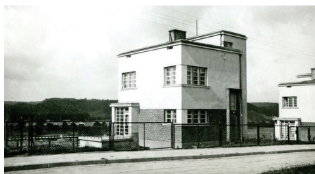
↑→Dom jednorodzinny TBO (Redłowo) przed wojną i obecnie). Nieudane zastąpienie modernistycznej stolarki okiennej współczesnymi oknami.

Szczegóły dot. zasad przyznawania dotacji na stronie www.gdynia.pl/zabytki/dotacje .