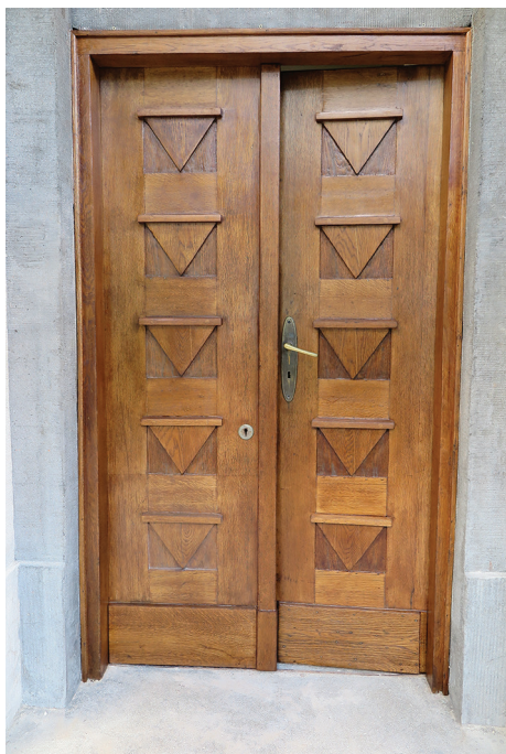
Wczesnomodernistyczne drzwi do budynku administracyjnego Uniwersytetu Morskiego przy ul. Morskiej 81-87 z dekoracją art deco.