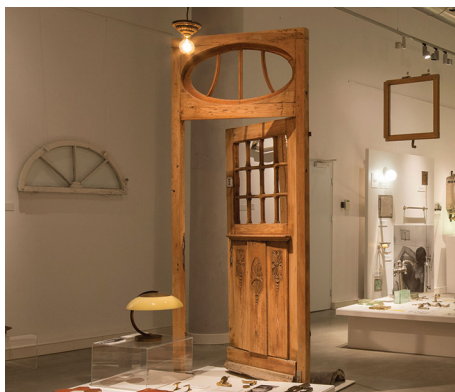
Drzwi z pierwszej kamienicy przy ul. Abrahama 5, zdemontowane z uwagi na zmianę poziomu ulicy i przekazane przez właścicieli na wystawę „Szkło-metal-detal” w Muzeum Miasta Gdyni.