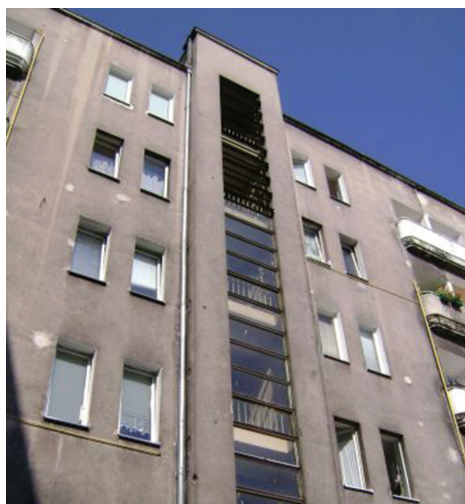
↑→Uchylnie okna klatek schodowych w budynku przy ul. 3 Maja 27-31 (Śródmieście).