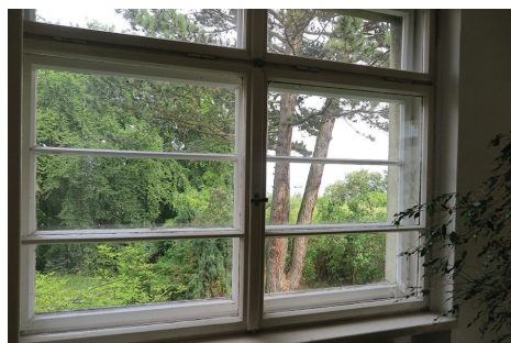
↑→Willa (Kamienna Góra). Modernistyczna stolarka okienna z drobnymi poziomymi podziałami.