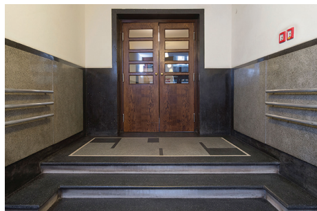
Modernistyczne drzwi wewnętrzne w kamienicy Reicha i Birnbauma przy ul. Abrahama 28, lata 30. XX w.