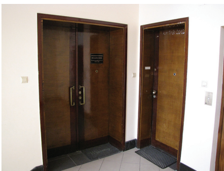
Drzwi do mieszkań w głównej klatce schodowej budynku przy ul. 3 Maja 27-31, lata 30. XX w.