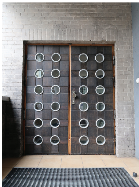
Drzwi głównego wejścia do siedziby Stowarzyszenia YMCA Gdynia przy ul. Żeromskiego 28, z okładziną z czarnego dębu i aluminiowymi oprawami okrągłych przeszkleń.