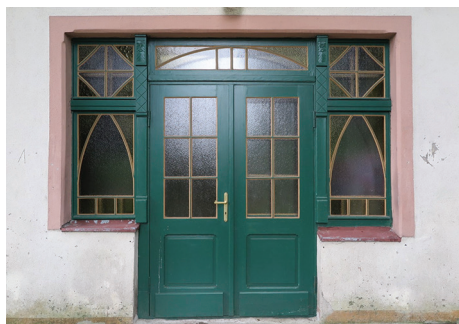
Drzwi do dworu Nowe Obluże przy ul. Rybaków z początku XX w. ze zrekonstruowanym układem podziałów i odtworzeniem oryginalnego zielonego koloru.

Na renowację historycznych drzwi w budynkach zabytkowych Gdyni można ubiegać się o dofinansowanie z budżetu gminy, z czego niektórzy właściciele domów już skorzystali. Więcej informacji na temat zasad przyznawania dotacji: www.gdynia.pl/zabytki/dotacje .