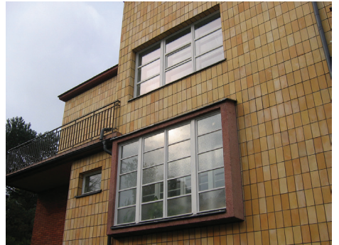
↑3. Willa przy ul. Inżynierskiej 111, lata 30. XX w. Okna modernistyczne o obrysie poziomych prostokątów, poddane w 2007 r. pracom konserwatorskim. Okno dolne jest charakterystyczne dla awangardowych budynków modernistycznych, bo dzięki konstrukcji z żelbetowej ramy wysuniętej przed lico elewacji, uzyskano znaczny dystans pomiędzy zewnętrzną, a wewnętrzną płaszczyzną przeszklenia, tworząc szeroki parapet, który mógł być małą oranżerią.