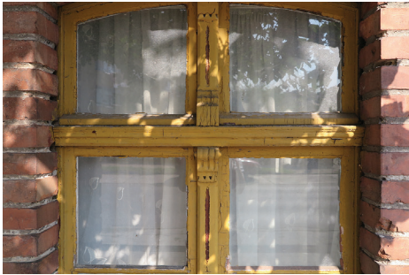
↑ 1. Dom Bieszków przy ul. św. Mikołaja 9 z początku XX w., okno przed renowacją. Najlepiej zachowany budynek wiejski w Gdyni (obok domku Abrahama), relikw wsi Chylonia. Ponad stuletnie okna poddano pracom konserwatorskim w 2016 r.

Więcej informacji na ten temat stolarki okiennej oraz zasad przyznawania dotacji: www.gdynia.pl/zabytki w aktualnościach oraz www.gdynia.pl/zabytki/dotacje