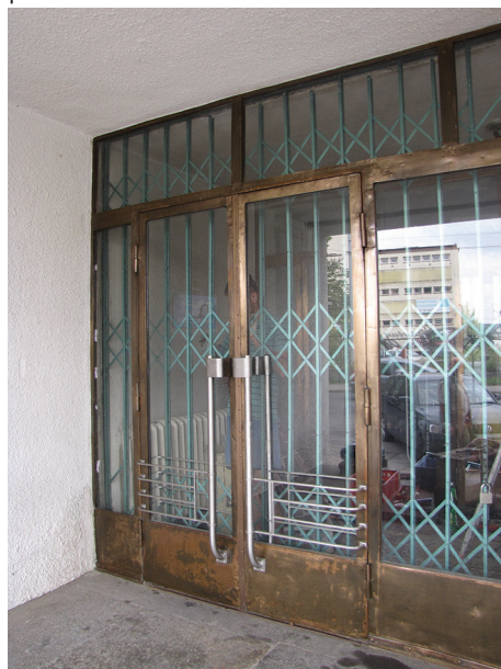
Drzwi bocznego wejścia do Sądu Rejonowego przy placu Konstytucji 5. Jedyne w Gdyni przykłady metalowych drzwi z lat 30. XX w., w których konstrukcja w kolorze mosiądzu została zestawiona z pochwytami z kolorze srebrnym.