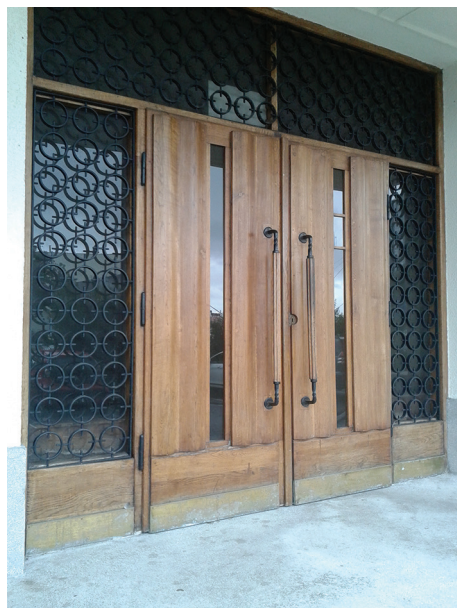
Wejście główne do budynku Wydziału Nawigacyjnego Uniwersytetu Morskiego przy al. Jana Pawła II 3, z drzwiami z motywem dekoracyjnej fali na powierzchni.