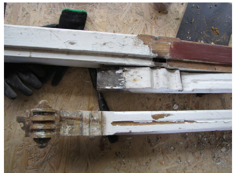
4, 5, 6. Dekoracyjny detal okien d. Zajazdu Adlera przy ul. Orłowskiej 8 w trakcie prac konserwatorskich. Prace konserwatorskie polegały m.in. na usunięciu powłok malarskich poprzez podgrzewanie i zdejmowanie szpachelką grubych warstw farby, następnie uzupełniane były ubytki w drewnie, elementy były szlifowane, malowane i ponownie szklone. Część zniszczonych elementów trzeba było zrekonstruować, ale okna pochodzą z XIX w. Prace wykonano w ramach kompleksowej rewaloryzacji budynku trwającej w latach 2011-2013.