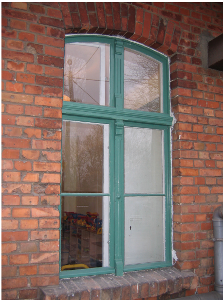
2. d. szkoła, ob. Przedszkole nr 14 przy ul. ks. Zawackiego 5 z przełomu XIX i XX w., okno po renowacji. Okna poddano odrestaurowaniu w latach 2007-2008, odkrywając w trakcie oryginalny zielony kolor, który przywrócono. →