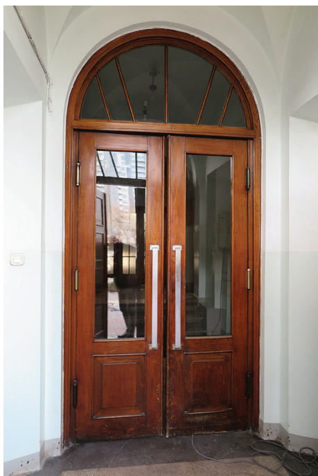
Historyzujące drzwi wewnętrzne w gmachu Biura Budowy Portu przy ul. Waszyngtona 38, koniec lat 20. XX w.

Obecnie ze względu na łatwość demontażu, dostępność zamienników lub zużycie, oryginalna stolarka drzwiowa oraz jej drobne elementy uzupełniające są zagrożone wymianą, pomimo tego, że nadają się do renowacji. Usuwanie historycznych drzwi i detali powoduje jednak zawsze dużą stratę dla dziedzictwa kulturowego.