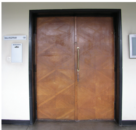
Płytowe drzwi z dekoracją rombów ułożonych ze słoży drewna, sala rozpraw w budynku Sądu Rejonowego przy pl. Konstytucji 5.