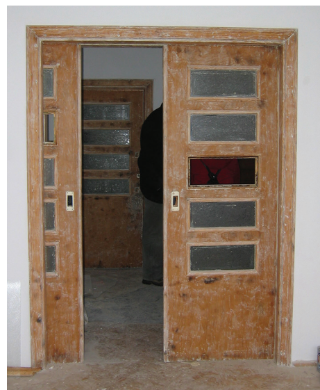
Przesuwne drzwi pomiędzy pokojami w willi w Orłowie, w trakcie prac restauratorskich.