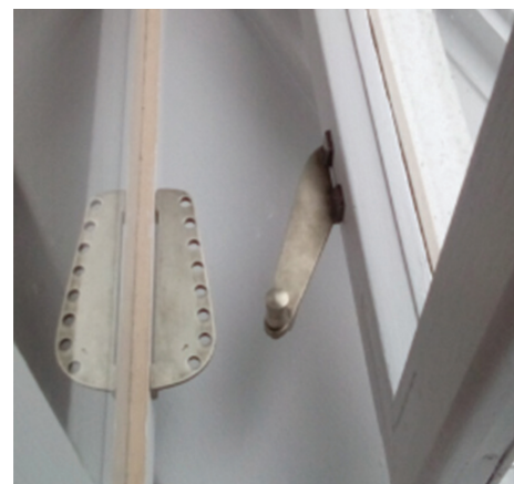
↑↑Willa dwurodzinna (Kamienna Góra). W 2017 r. stolarkę okienną poddano renowacji. U dołu historyczny ogranicznik otwarcia okien po renowacji.