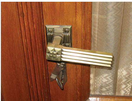
Klamka w stylu art deco, drzwi wewnętrzne w gmachu d. Banku Polskiego przy ul. 10 Lutego 20-22.