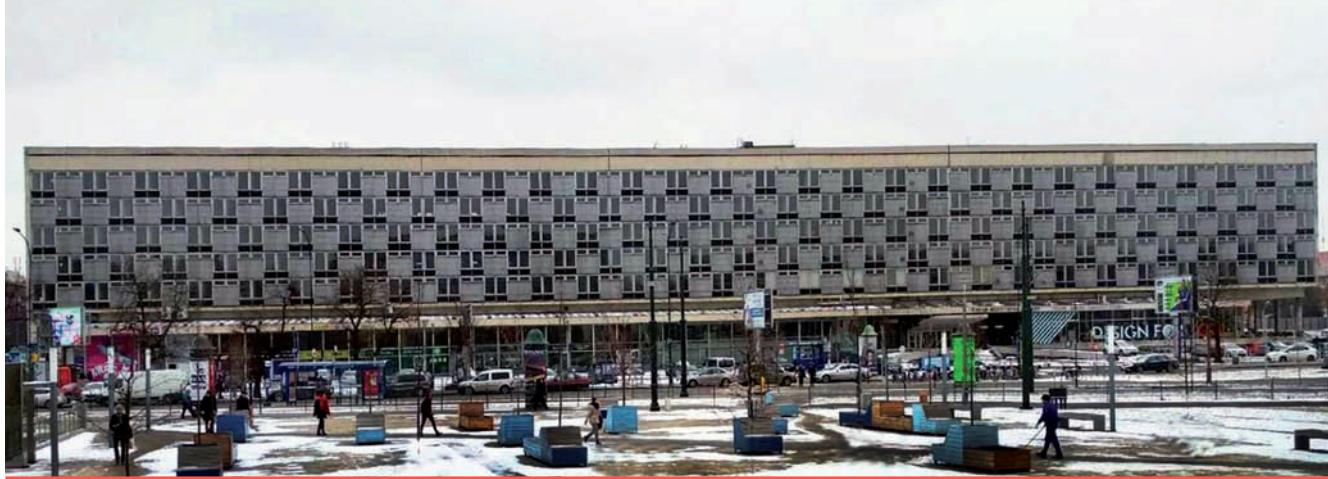
6. Hotel Cracovia w Krakowie (fot. Jan Jagielski, marzec 2018)