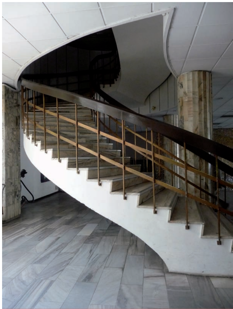
8. Hotel Cracovia w Krakowie, klatka schodowa w hallu