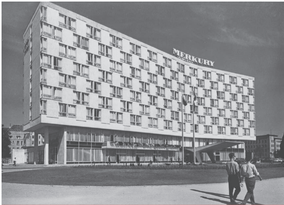
4. Hotel Merkur w Poznaniu ok. 1964

Do rozpoznania wartości obiektu autorzy opinii posłużyli się ogólnie przyjętą i stosowaną przez historyków sztuki metodologią badań, narzucającą określoną kolejność działań. Tak więc ocenę wartości architektury dawnego hotelu poprzedziło szerokie rozpoznanie przedmiotu obejmujące takie zagadnienia jak :