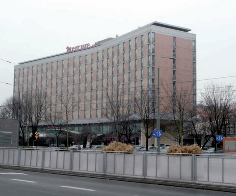
5. Hotel Merkur w Poznaniu (fot. Tomasz Łuczak, 2018)

prasowych i internetowych. Autorzy opinii wykazali, że hotel Cracovia posiada dość pokaźną literaturę. Obiekt stał się przedmiotem zainteresowań badaczy architektury już w kilka lat po wybudowaniu. W 1968 r. autor projektu Witold Cęckiewicz na łamach Architektury opisał nowatorskie elementy, które zastosował w konstrukcji budynku, użytych materiałach, wyposażeniu i dekoracji 11 . W latach 70-tych wybitny teoretyk i krytyk architektury Przemysław Szafer w książce o architekturze polskiej z drugiej połowy lat 60. XX wieku szczególną uwagę zwrócił na kontekst przestrzenny budynku hotelu i jego kompozycyjne oraz funkcjonalne powiązanie z kinem Kijów , a także znaczenie konstrukcji stalowej i efektywność ścian kurtynowych 12 . Opinię Szafera podzielali inni uznani profesjonalni badacze dziejów architektury najnowszej – Tadeusz Barucki, Andrzej Olszewski, Jacek Purchla, Marcin Fabiański, Małgorzata Włodarczyk 13 . Przy czym w całej bibliografii przedmiotu analizy krytyczne zawsze odnosiły się do dwóch budynków powiązanych ze sobą – hotelu Cracovia i kina Kijów , powstałych w tym samym czasie i według koncepcji jednego autora.