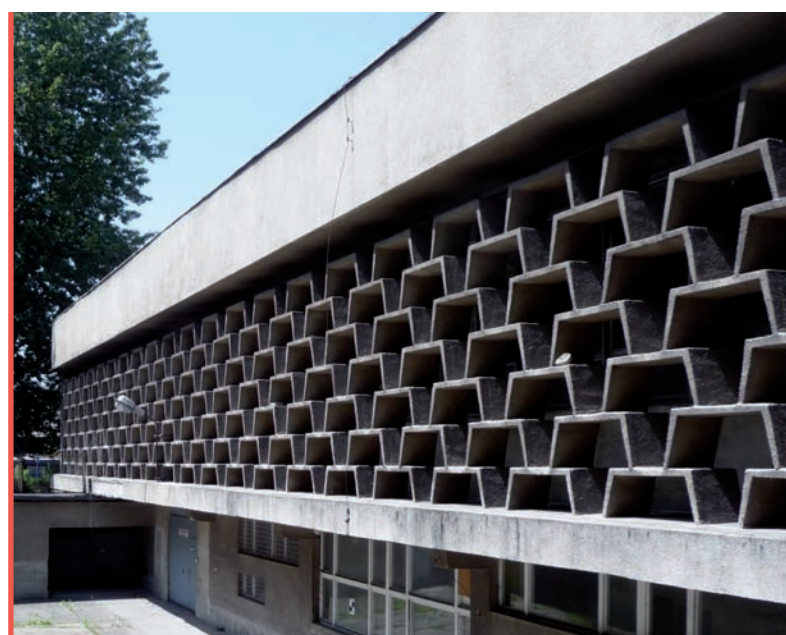
7. Hotel Cracovia w Krakowie, kompozycja elewacji południowej parteru, dawnego zaplecza części gastronomicznej

Opracowany w ten sposób materiał badawczy stał się dla autorów opinii podstawą do formułowania wniosków końcowych określających wartości, które kwalifikowałyby hotel Cracovia do ewentualnego wpisania do rejestru zabytków. Wartościowania dokonano w dwóch płaszczyznach – urbanistycznej i architektonicznej. Do najwartościowszych elementów w zakresie urbanistycznym zaliczono lokalizację