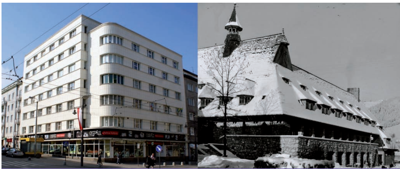
3. Architect Zbigniew Kupiec: tenement house with Bon Marche department store, Gdynia 1936; Tourist House, Zakopane 1951