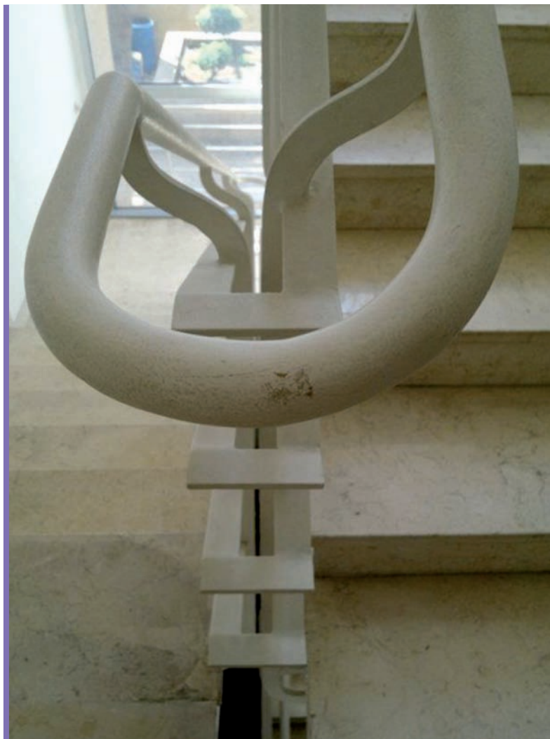
10. Detal balustrady w budynku Dar Al Sayad Bejrut Hazmieh (1954), architekt Karol Schayer

Kolejny obiekt to pochodzący z roku 1954 budynek Dar As Sayad. To biurowiec zaprojektowany dla potrzeb gazety Assayad co w języku arabskim oznacza myśliwego. Tematyka pisma nie ma jednak nic wspólnego z myślistwem a jest poświęcona szeroko rozumianej kulturze i polityce opisywanej z pozycji panarabistycznych. Budynek zlokalizowany jest w mieście Hazmieh stanowiącym podobnie jak Babda część