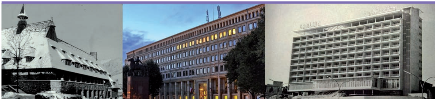
14. Budynki powstałe w latach 50-tych XX wieku w Polsce i Libanie. Od lewej: Dom turysty w Zakopanem, Biurowiec CRZZ w Katowicach, Hotel Carlton w Bejrucie