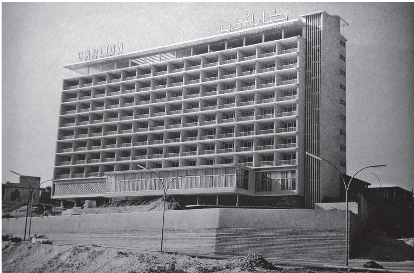
13. Carlton Hotel, architekt Karol Schayer, Bejrut 1957