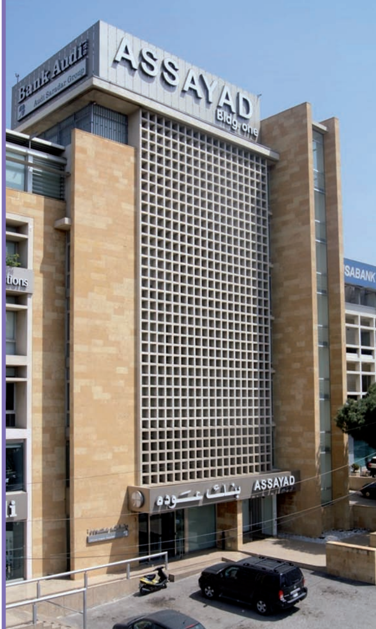
9. Biurowiec Dar Al Sayad w Bejrucie (Bejrut-Hazmieh), architekt Karol Schayer (1954): po lewej - stan budynku w latach pięćdziesiątych XX wieku; po prawej - stan współczesny (fot. autor 2012)