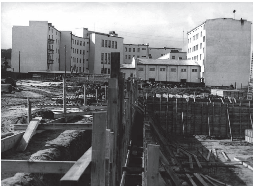
7. Budynek Kolejowego Przynsposobienia Wojskowego im. Marszałka Józefa Piłsudskiego przy ul. Jana z Kolna w Gdyni z dobudowaną salą teatralną, w tle gmach Sądu Rejonowego i Prokuratury, II poł. lat 30 XX w.

7. Marshal Piłsudski Rail Military Training Building in Gdynia's Jana z Kolna Street with added theater hall, District Court building in the background and the Prosecutor's Office