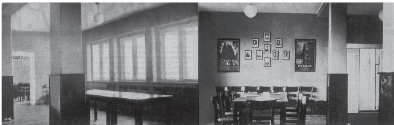
5. Room on the first floor of Marshal Piłsudski Rail Military Training Holiday Home in Gdynia's Jana z Kolna Street, 1935