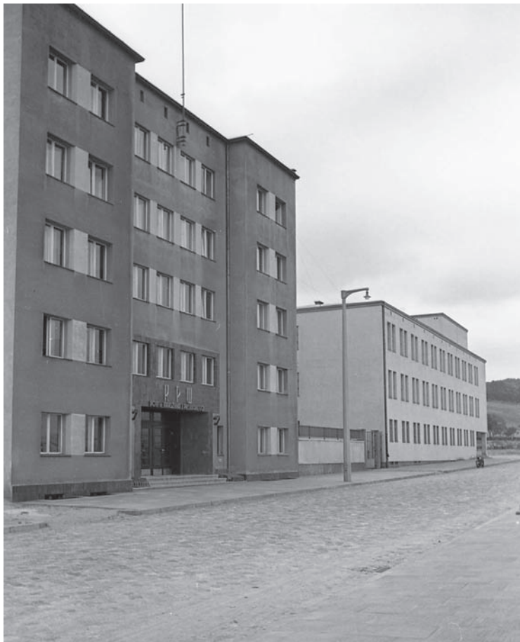
1. Budynek Kolejowego Przynsposobienia Wojskowego im. Marszałka Józefa Piłsudskiego przy ul. Jana z Kolna w Gdyni, 1935 rok, arch. Tadeusz Wyszomirski (źródło: zbiory Muzeum Miasta Gdyni, fot. Henryk Poddębski, sygn. MMG/HM/II/1281/414)

1. Marshal Piłsudski Rail Military Training Building in Gdynia's Jana z Kolna Street, 1935, architect Tadeusz Wyszomirski (source: collection of the Gdynia City Museum, photo: Henryk Poddębski, sign. MMG/HM/II/1281/414)