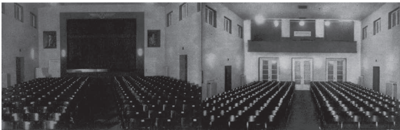
4. Sala teatralna budynku Kolejowego Przystosobienia Wojskowego im. Marszałka Józefa Piłsudskiego przy ul. Jana z Kolna w Gdyni, 1935 rok