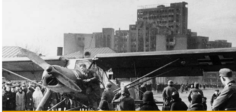
3. Dom Projektów, zniszczenie budynku po II wojnie światowej (fot. 1944, z archiwum A. Buryaka)

Hotel „Internacjonal” 5 , zbudowany w latach 1932–1936 według projektu architekta Grigorija Janowickiego (il. 6) również został spalony podczas woj-