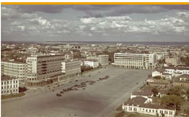
6. Charków, Plac Dzierżyńskiego, Hotel „International”, arch. Janowicki G., 1932-36, po lewej budynek Komitetu Centralnego, arch. Shteinberg J., 1929-32, na końcu placu

6. Kharkiv, Dzerzhynsky Square, Hotel "International", arch. Yanovitsky G., 1932-36, on the left, the Central Committee Building, arch. Shteinberg J., 1929-32, at the end of the square