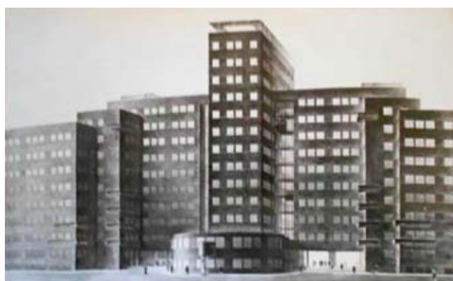
7. Charków, Dom Spółdzielczości, Plac Wolności, arch. Dmitriev A., Munts O., 1929-54, perspektywa

- utrzymanie i restauracja obiektu w formie, którą nabył w wyniku powojennej przebudowy lub ukończenia w powojennym stylu (por.: Dom Spółdzielczości i Hotel „Internacjonal”). W tym wypadku, równolegle z działaniami restauracyjnymi i modernizacyjnymi konieczne byłoby zebranie i usystematyzowanie informacji historycznych na temat etapów powstania tych budynków, a także stworzenie ich graficznych modeli (rekonstrukcji graficznych), odtwarzających oryginal-