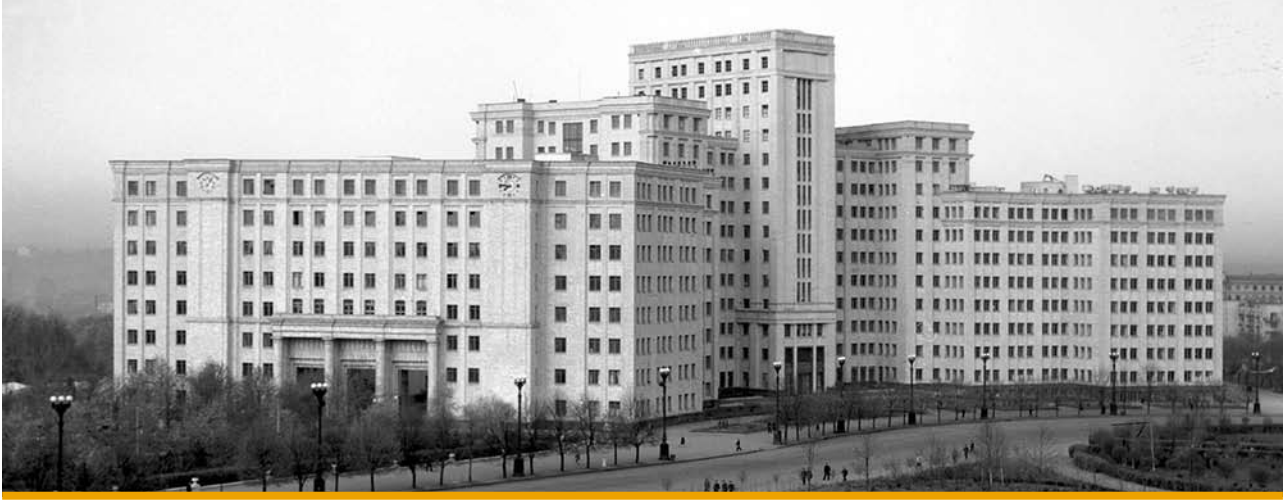
5. Dom Projektów, widok budynku po odbudowie (fot. 1963, z archiwum A. Buryaka)