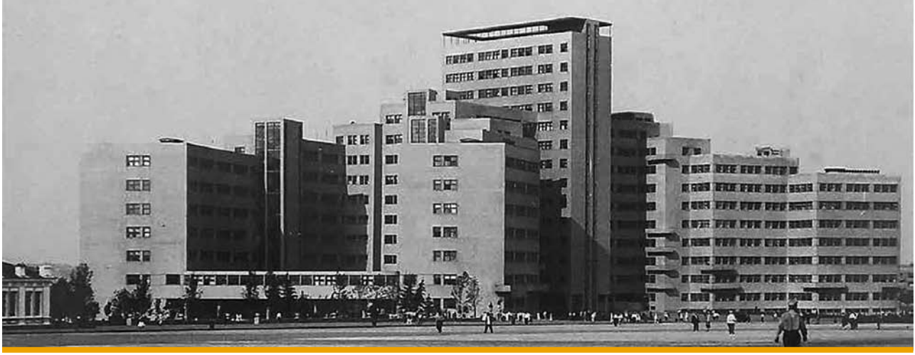
2. Charków, Dom Projektów, Plac Wolności 4, arch. Serafimov S., Zandberg-Serafimova M., 1931-32 (zdjęcie z lat 30.XX wieku)