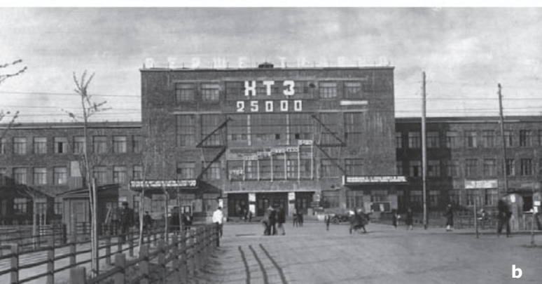
2. Miasto liniowe „Nowy Charków”: a. kompleks mieszkaniowy; b. główna brama charkowskiej fabryki traktorów

2. Linear city “New Kharkiv”: a. residential complex; b. main gate of the Kharkiv tractor plant