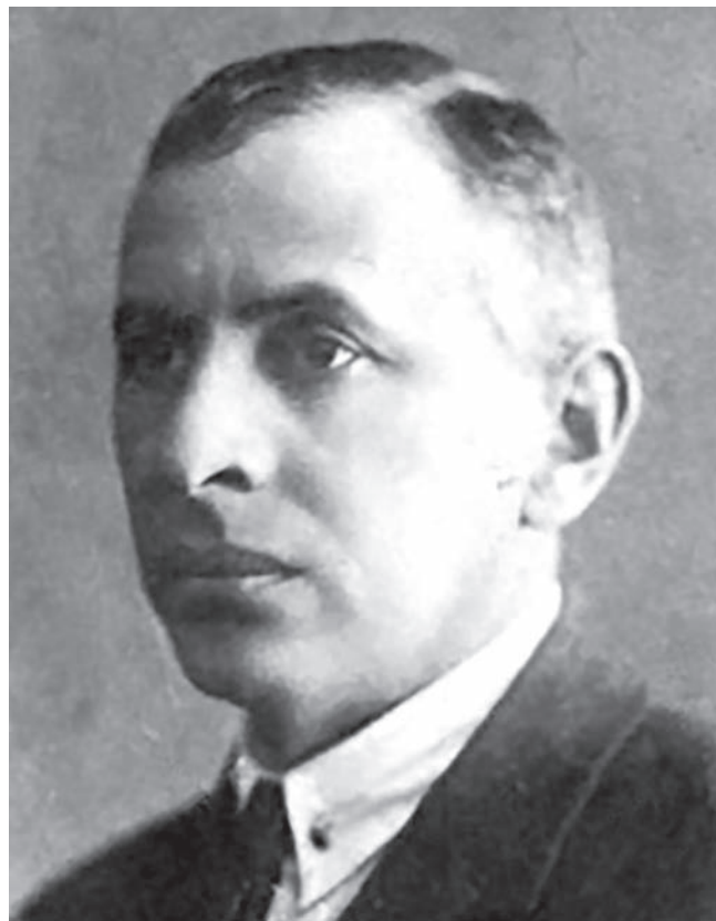
5. Architekt A. Linetskiy (1884–1953), fotografia z lat 20. XX w.

Kompozycja elewacji ulicznej garażu opiera się na kontraście między wydłużoną poziomą linią hali parkingowej i skromnym pionem przeszklonej bryły klatki schodowej budynku administracyjnego. Fasetywane witraż klatki schodowej i poziome okna budynku produkcyjnego miały drobne przeszklenia we wdzięcznych stalowych oprawkach, co jest typowe dla większości konstruktywistycznych budynków w Charkowie. Obecnie z oryginalnych detali budynku nie pozostało nic. Niemniej jednak dawny garaż, zniekształcony nie