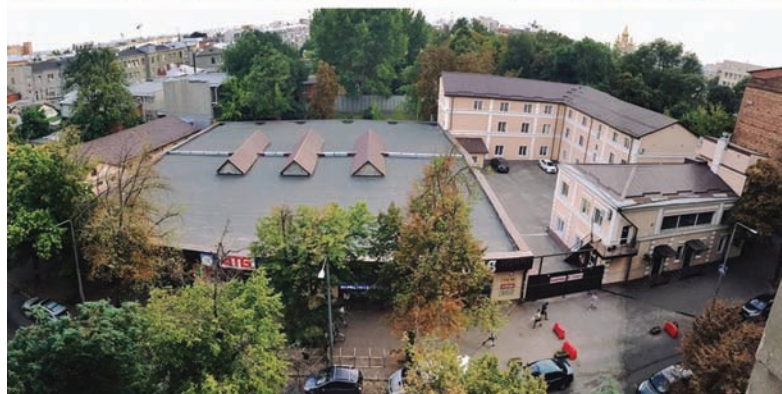
7. Charków, garaż Rady Komisarzy Ludowych, stan obecny, ul. Girshmana 16 (foto A. Bouryak, 2021)