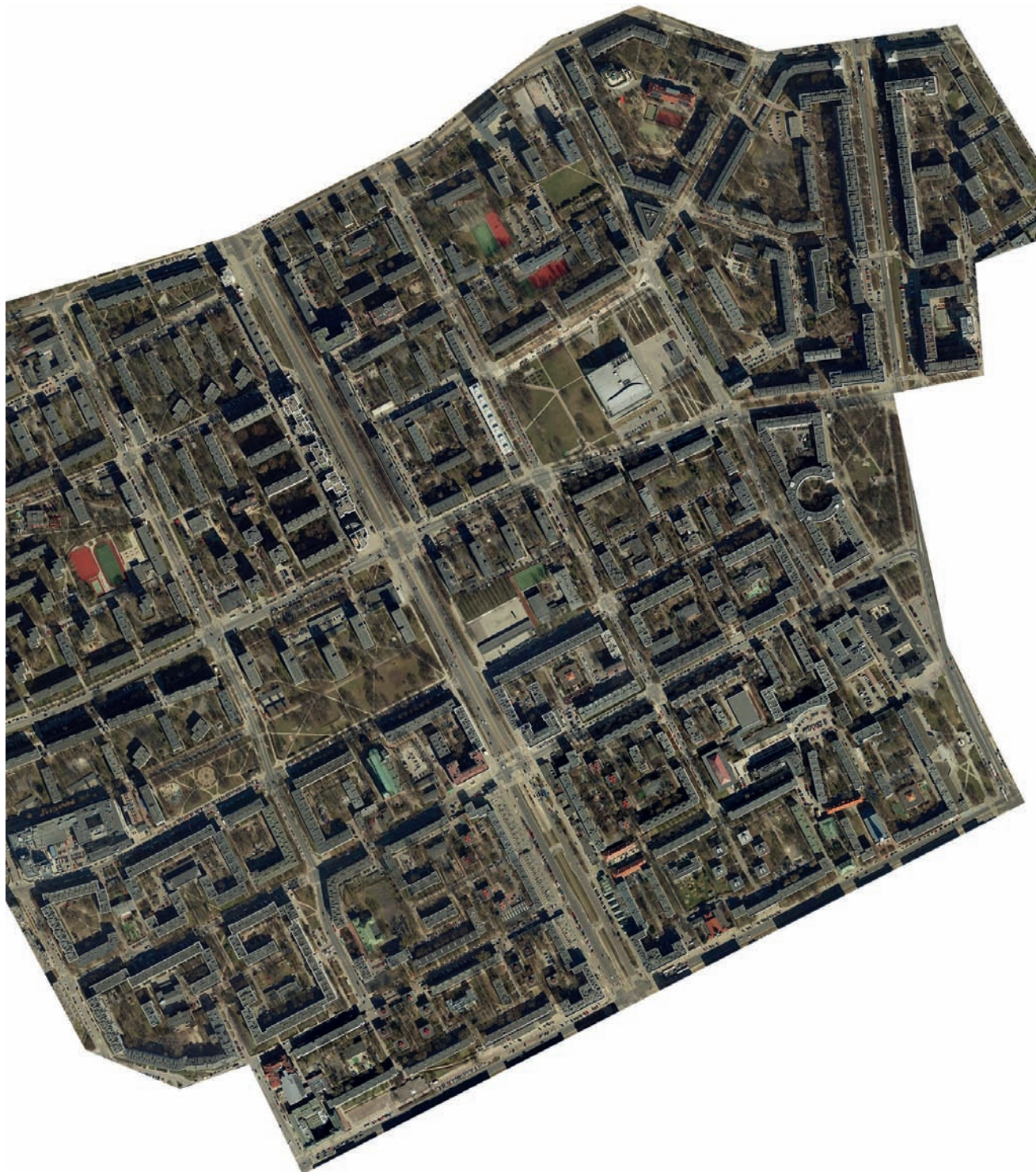
4. Współczesne zdjęcie lotnicze z serwisu mapowego miasta

4. The contemporary aerial photo of Muranów from the city's map service