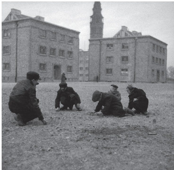
5. Warszawa, osiedle Muranów Południowy w rejonie punktowców o adresach ul. Nowolipie 18a i Nowolipki 19b w końcu lat 40.

Takie podejście możliwe było w Polsce tuż po wojnie, gdy „budował się” nowy socjalistyczny ustrój, skoncentrowany na kształtowaniu „form zbiorowych”. „Współczesne układy mieszkaniowe nie są sumą poszczególnych mieszkań, lecz strukturami spójnymi funkcjonowaniem wyspecjalizowanych urządzeń obsługi zbiorowej” 38 , pisał Edmund Goldzamt. Nowopowstające osiedla, przynajmniej w zamierzeniu, zakładały ściśle określony i z góry zbilansowany program mieszkaniowo-usługowy, który miał służyć nie tylko jakości życia, ale też ponadklasowej integracji społecznej 39 . Skala terytorialna pojedynczych „jed-