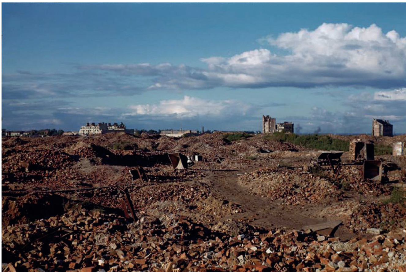
2. Warszawa, ruiny Getta Warszawskiego w 1947 roku – teren, na którym powstała Dzielnica Społeczna Muranów