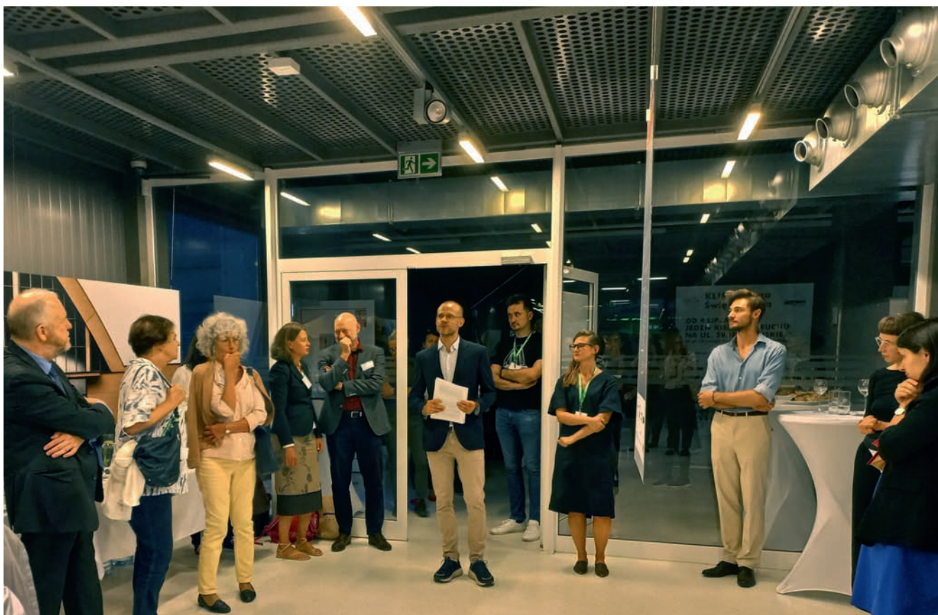
Finisaż wystawy „Miejskie sieci modernizmu i rola architektów i architektek pochodzenia żydowskiego. Przykład Gdyni” Finissage of exhibition „Urban Networks of Modernism and the Role of Jewish Architects – the Case of Gdynia (Poland)”