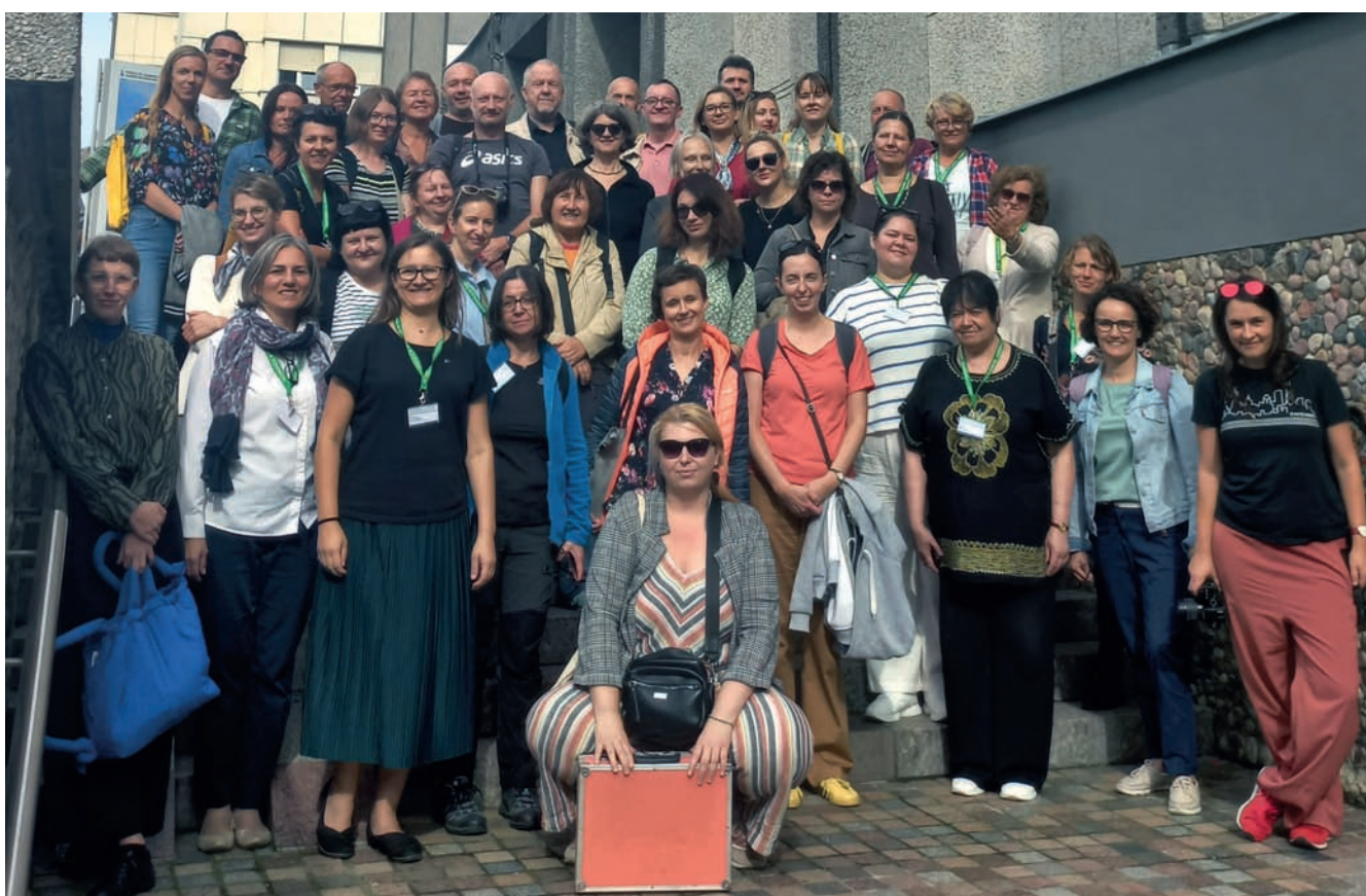
Uczestnicy konferencji na schodach kościoła Najświętszego Serca Pana Jezusa Conference participants on the steps of the Church of the Sacred Heart of Jesus