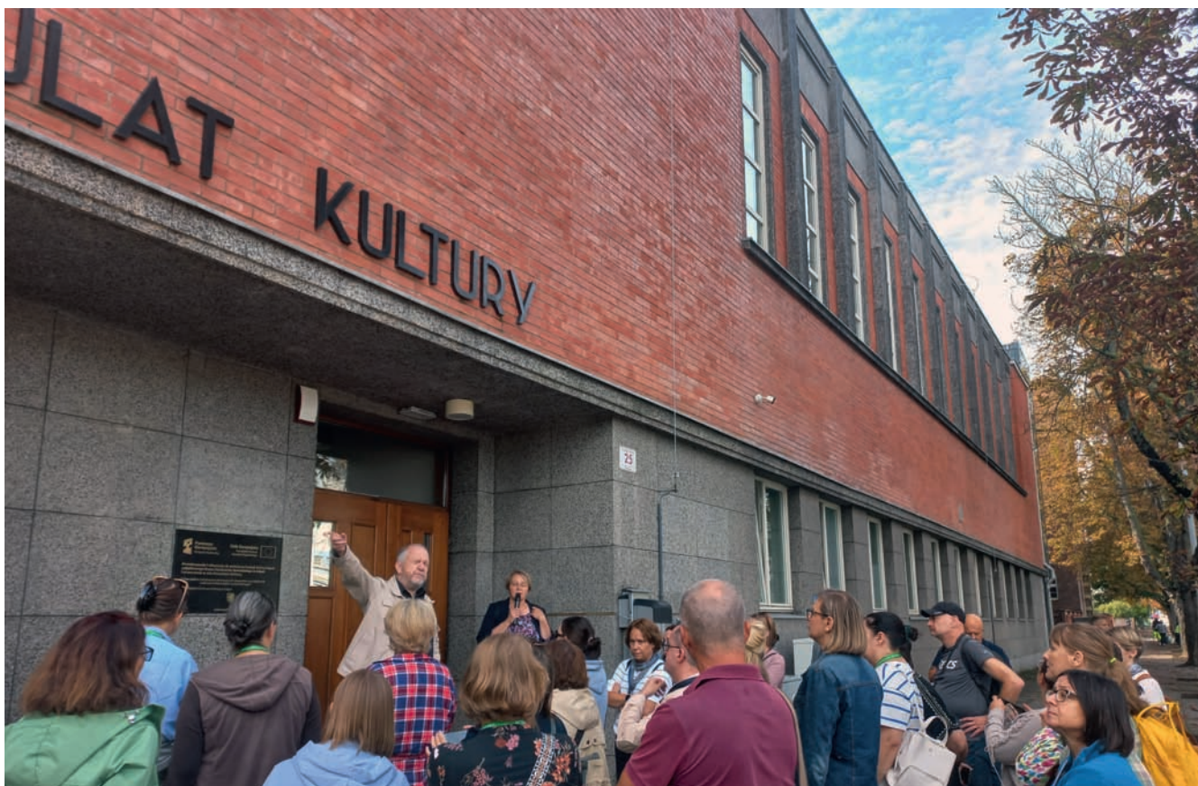
Konsulat Kultury, dawny Dom Marynarza Szwedzkiego Consulate of Culture, former Swedish Sailor's House