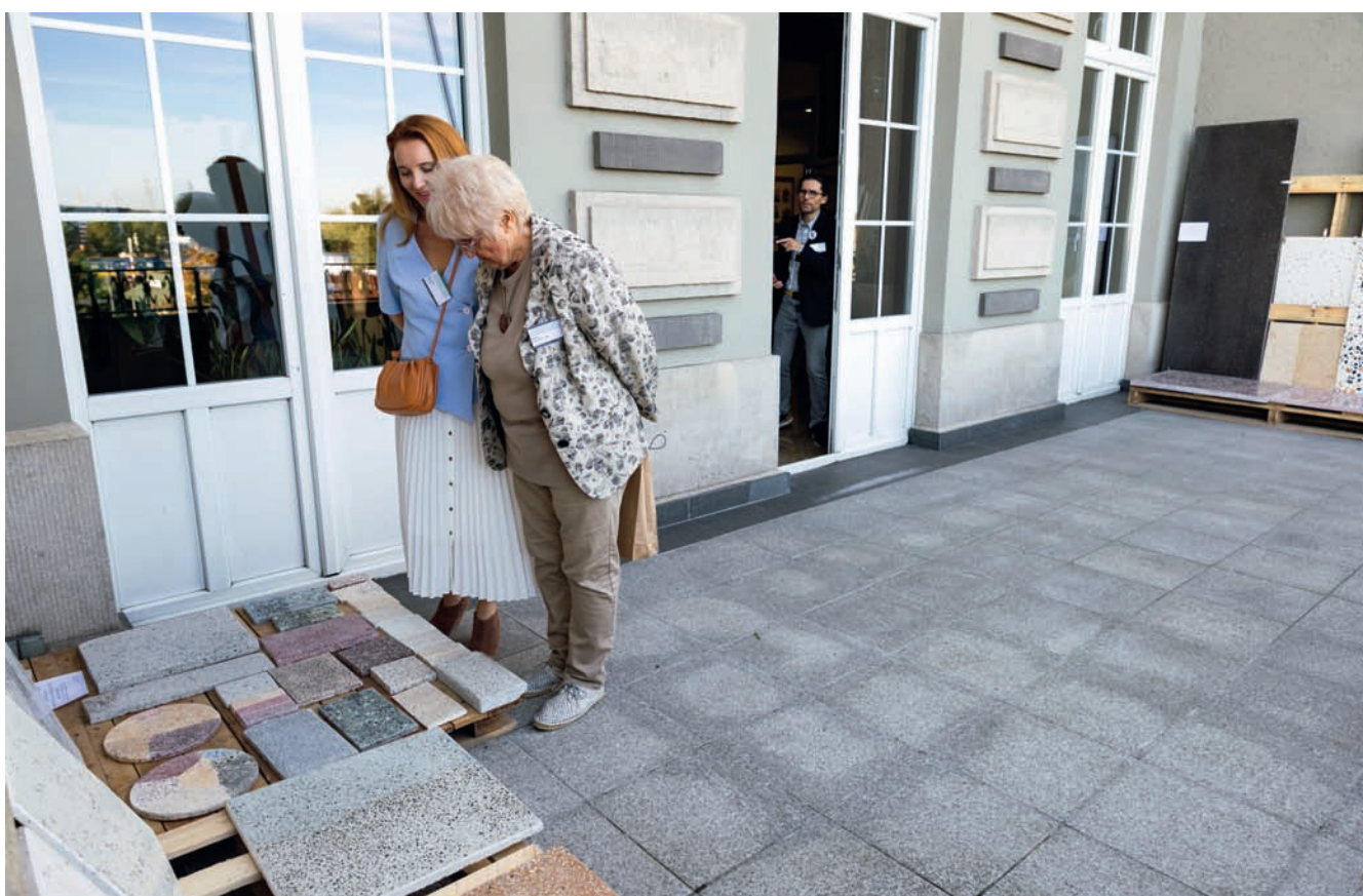
Towarzysząca obradom wystawa próbek dekoracyjnego lastryko stosowanego w Gdyni w latach 30. XX w. Exhibition accompanying the proceedings: decorative terrazzo samples used in Gdynia in the 1930s