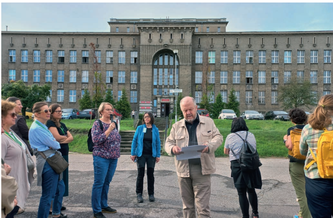
Uczestnicy wycieczki przed budynkiem projektu Wacława Tomaszewskiego Tour participants in front of the building designed by Wacław Tomaszewski