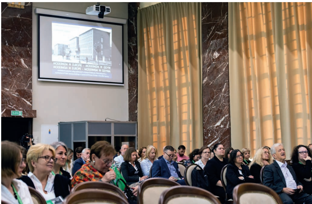
Uczestnicy Konferencji na sali Uniwersytetu Morskiego Conference participants in the Maritime University hall