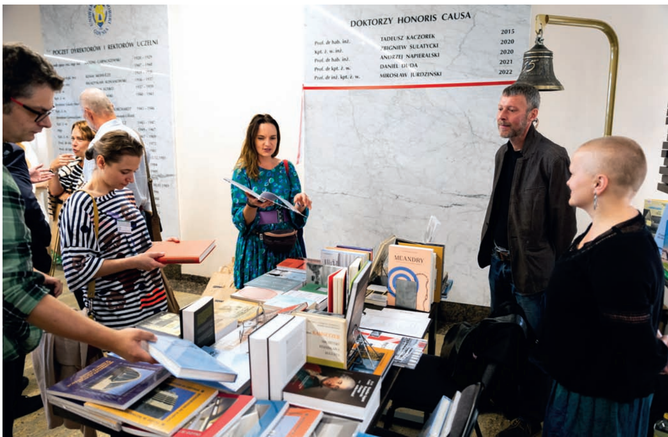
Przygotowane na Konferencję stoisko księgarni Vademecum z wydawnictwami dotyczącymi modernizmu Publications on modernism at the Vademecum bookstore stand prepared for the Conference