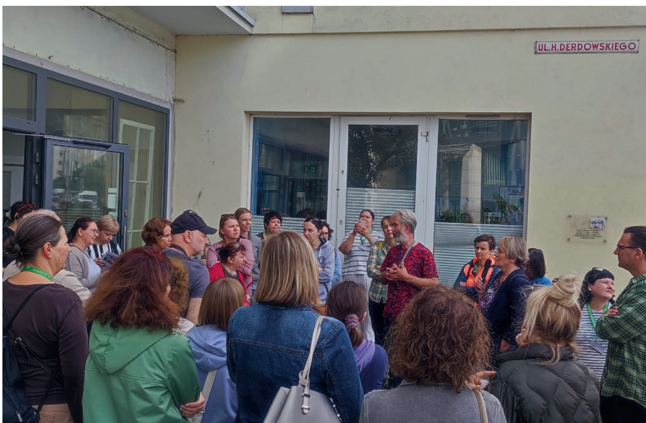
Przed wejściem na ekspozycję zabytkowej stolarki In front of the exhibition of historic woodwork