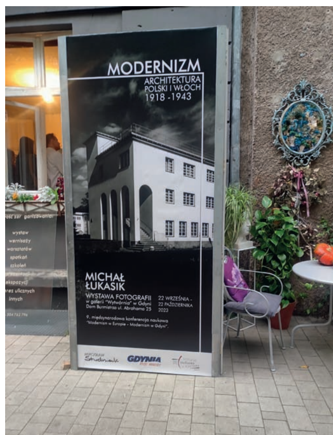
Przed wejściem do domu Burmistrza In front of the entrance to the mayor's house