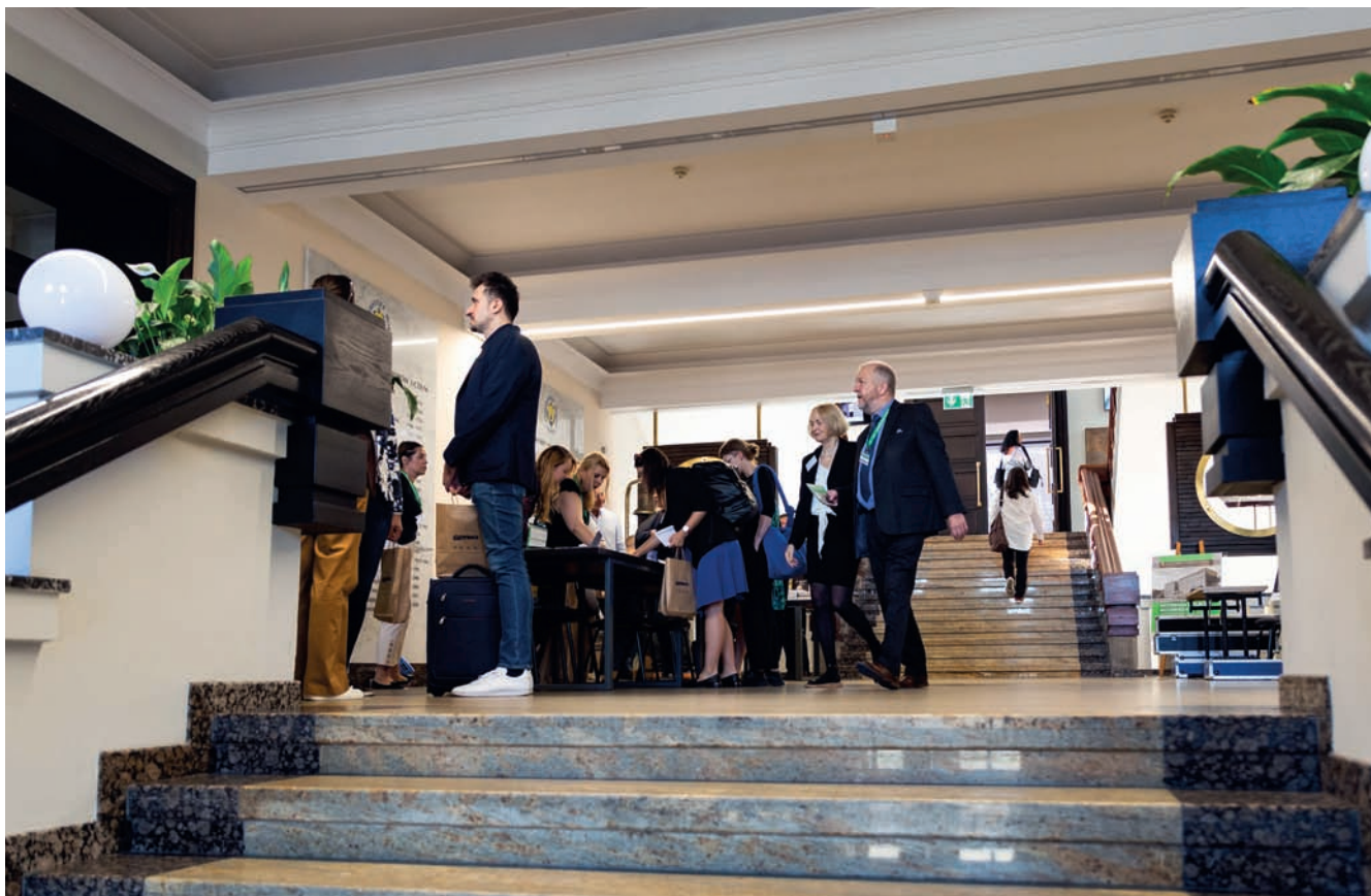
Rejestracja uczestników w hallu Uniwersytetu Morskiego Registration of participants in the hall of the Maritime University