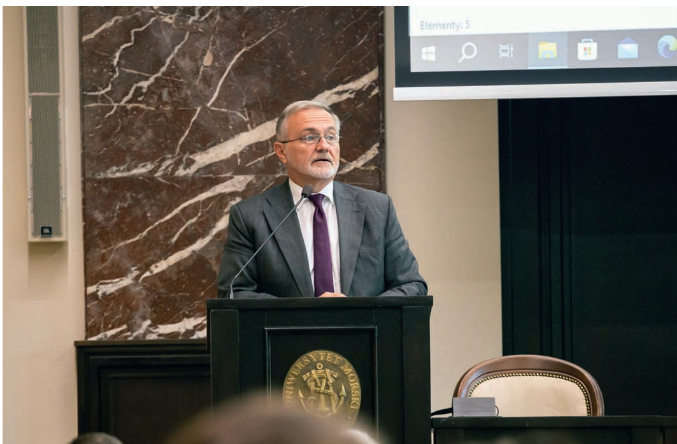
Wystąpienie Prezydenta Gdyni, Wojciecha Szczurka, otwierające konferencję Conference opening speech by the President of Gdynia, Wojciech Szczurek