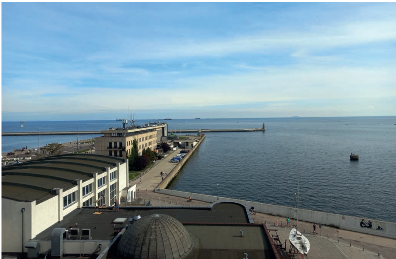
Widok z tarasu Wydziału Nawigacji Uniwersytetu Morskiego View from the terrace of the Navigation Department of the Maritime University