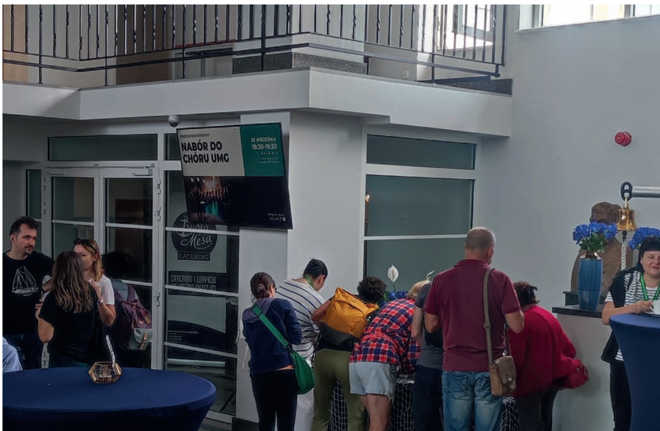
Zwiedzanie Wydziału Navigacyjnego Uniwersytetu Morskiego Visit to the Navigation Department of the Maritime University