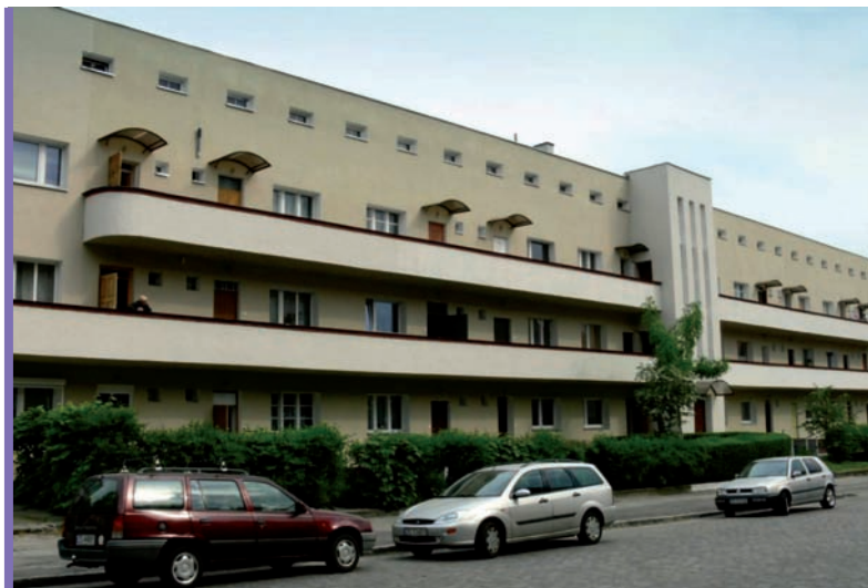
3. Szczecin, fragment zabudowy wielorodzinnej przy ul. Janickiego z lat 1930-1931