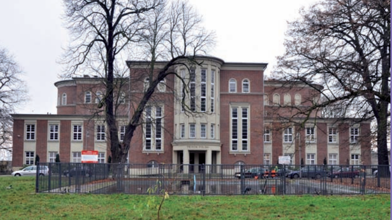
8. Szczecin, d. Loża masońska, ob. Teatr Polski, ul. Swaróżyca 5, 1920, architekt A. Thesmacher, . Fot. M. Gwiazdowska, 2018 r.