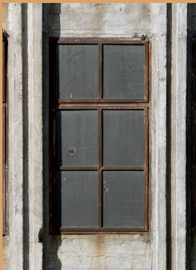
Ślusarka okienna dawnej elektrociepłowni, ul. Kadłubowców Window joinery of the former heat and power plant, Kadłubowców St.