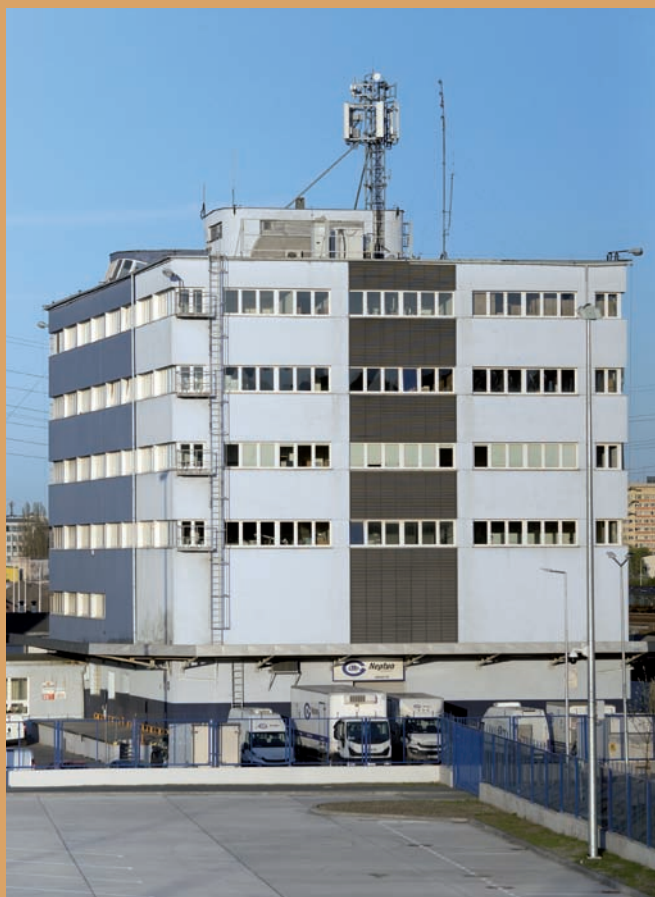
Dawny magazyn Baltony , ul. Polska 43 Former Baltona warehouse, 43 Polska St.