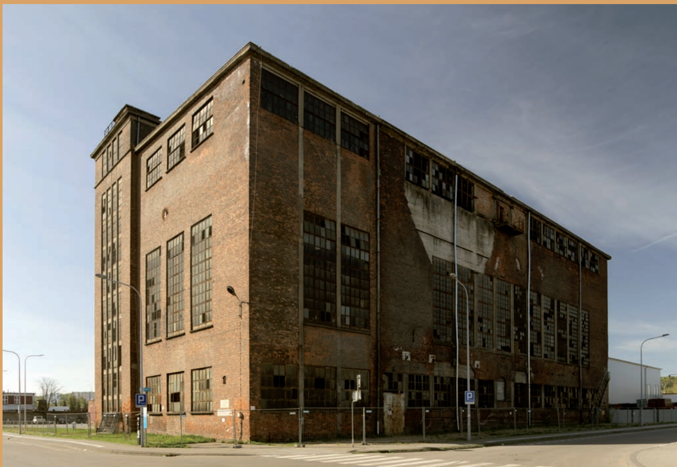
Dawna elektrociepłownia, ul. Kadłubowców Former heat and power plant, Kadłubowców St.