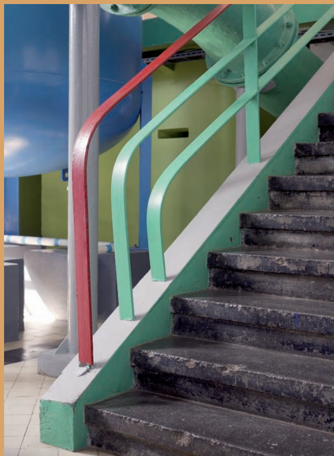
Schody wewnętrzne w budynku ujęcia wody, ul. Pomorska, Rumia Internal stairs in the water intake building, Pomorska St., Rumia