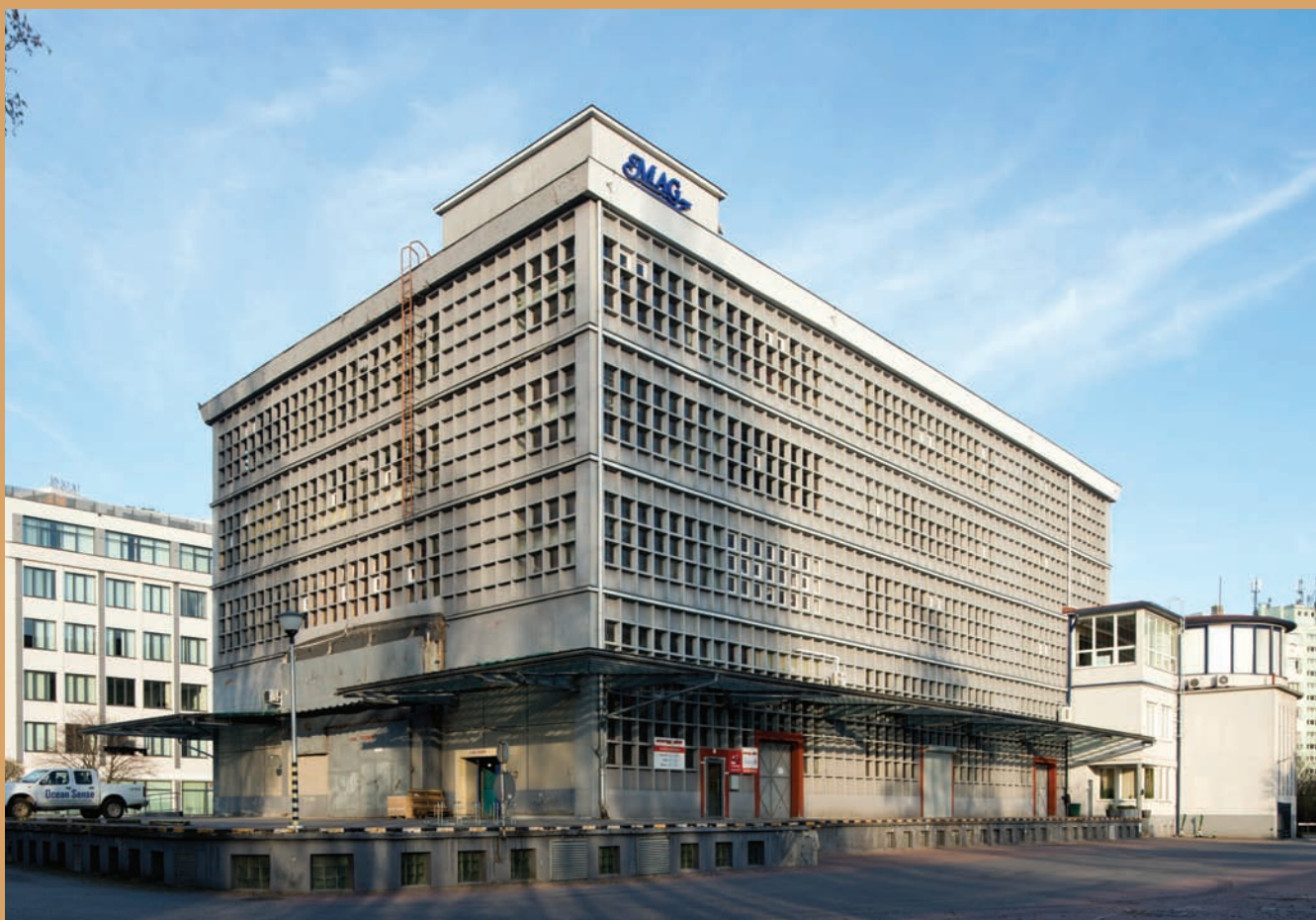
Skrzydło magazynowe budynku MAG, ul. Wendy 15 Warehouse wing of the MAG building, 15 Wendy St.