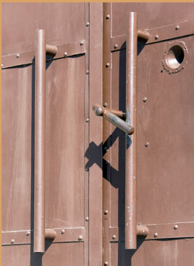
Detal drzwi do budynku ujęcia wody, ul. Pomorska, Rumia Detail of the door to the water intake building, Pomorska St., Rumia