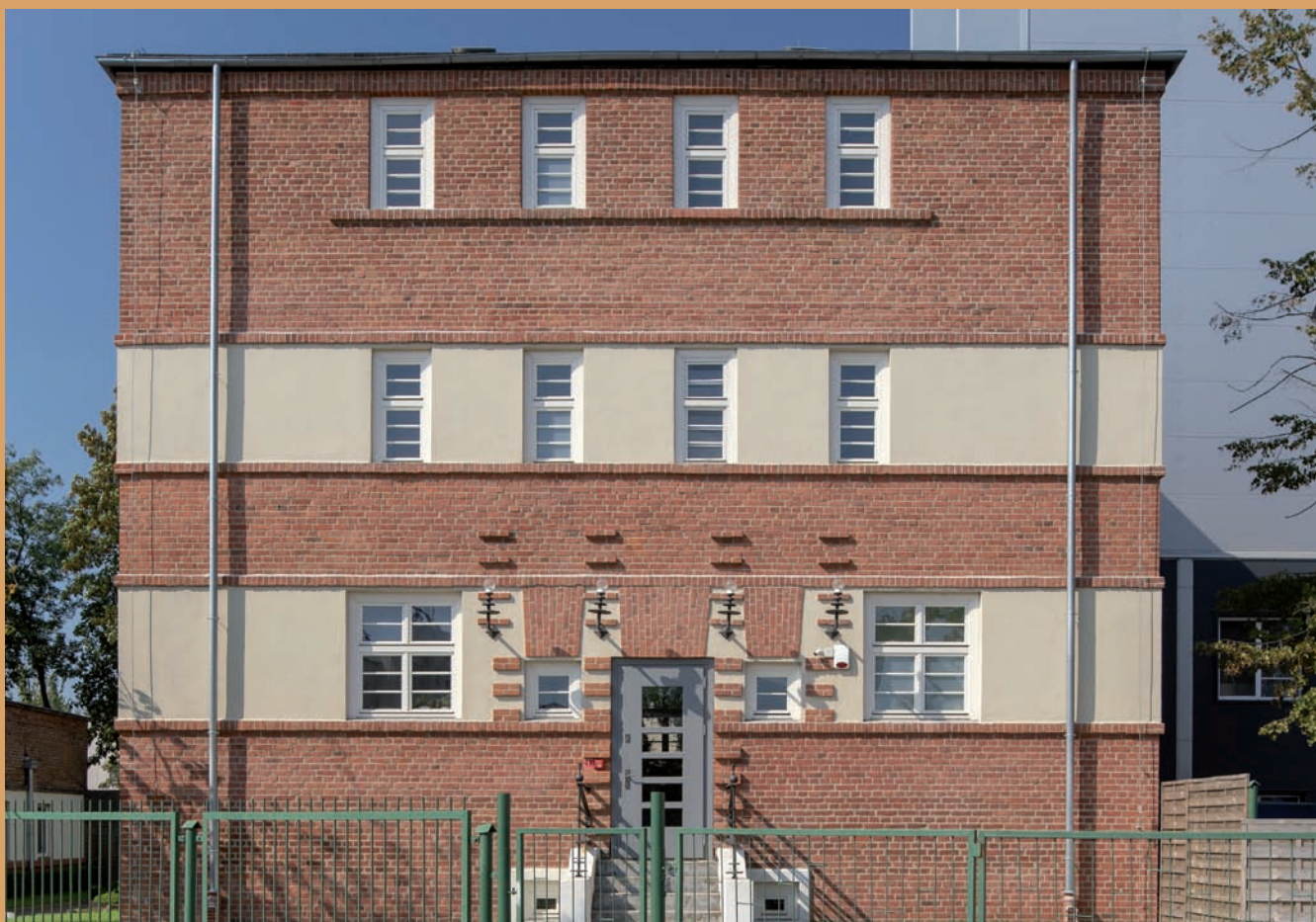
Budynek administracyjny Łuszczarni Ryżu, ul. Celna 2 Administrative building of the Rice Mill, 2 Celna St.