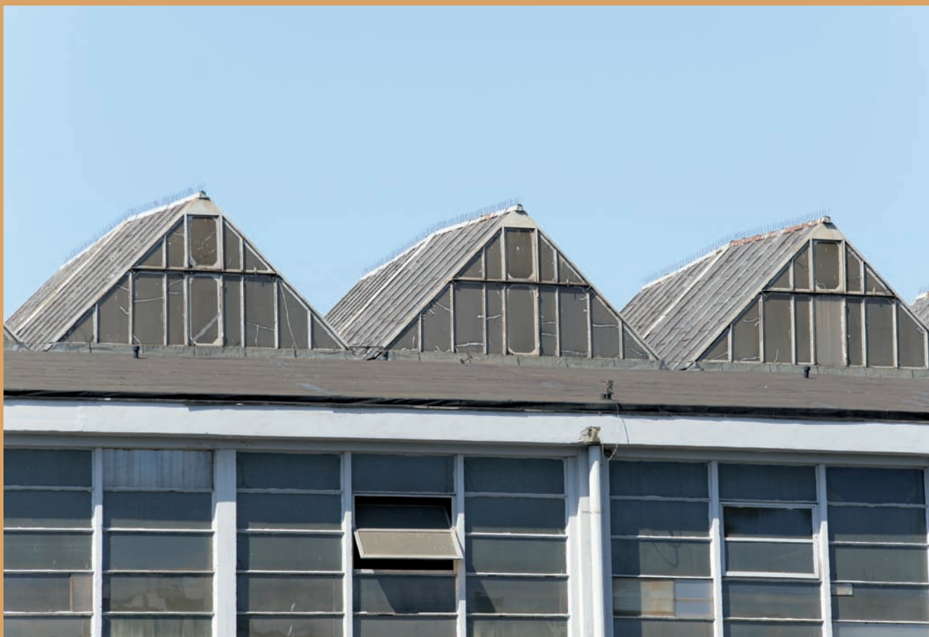
Kadłubownia, ul. Czechosłowacka Shed roof of the Hullhouse, Czechosłowacka St.