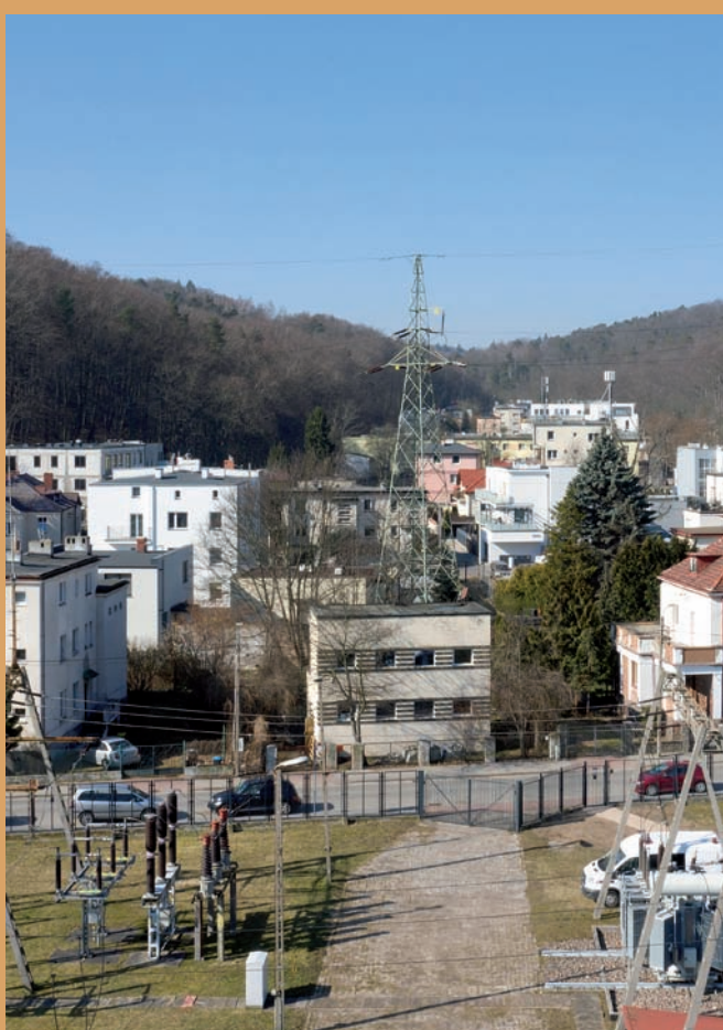
Budynek dawnej trafostacji, ul. Poznańska 10 The building of the former transformer station, 10 Poznańska St.