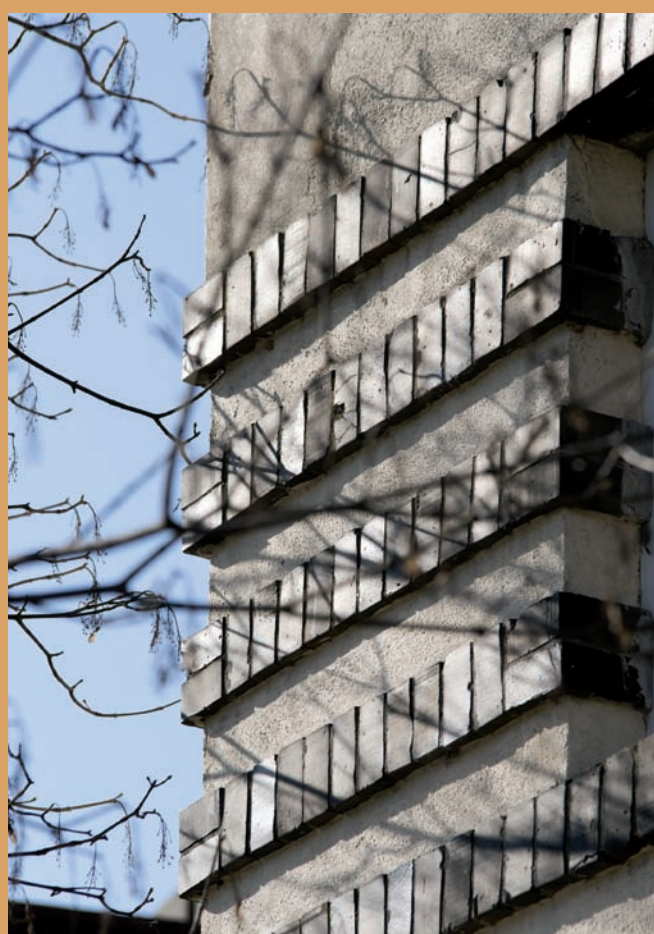
Detal elewacji budynku dawnej trafostacji, ul. Poznańska 10 Detail of the facade of the building of the former transformer station, 10 Poznańska St.