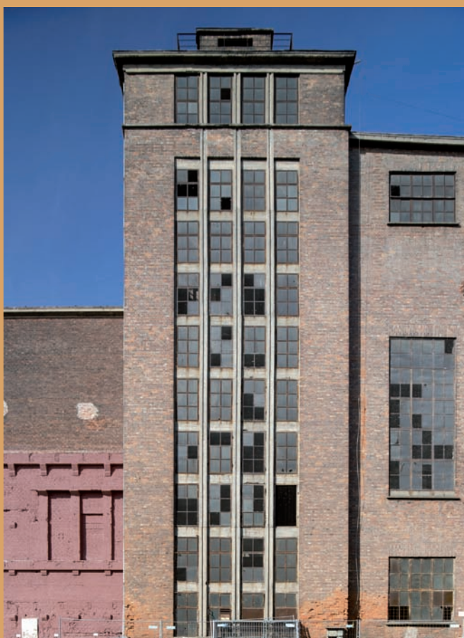
Przeszklenie klatki schodowej dawnej elektrociepłowni, ul. Kadłubowców Glazing of the staircase of the former heat and power plant, Kadłubowców St.