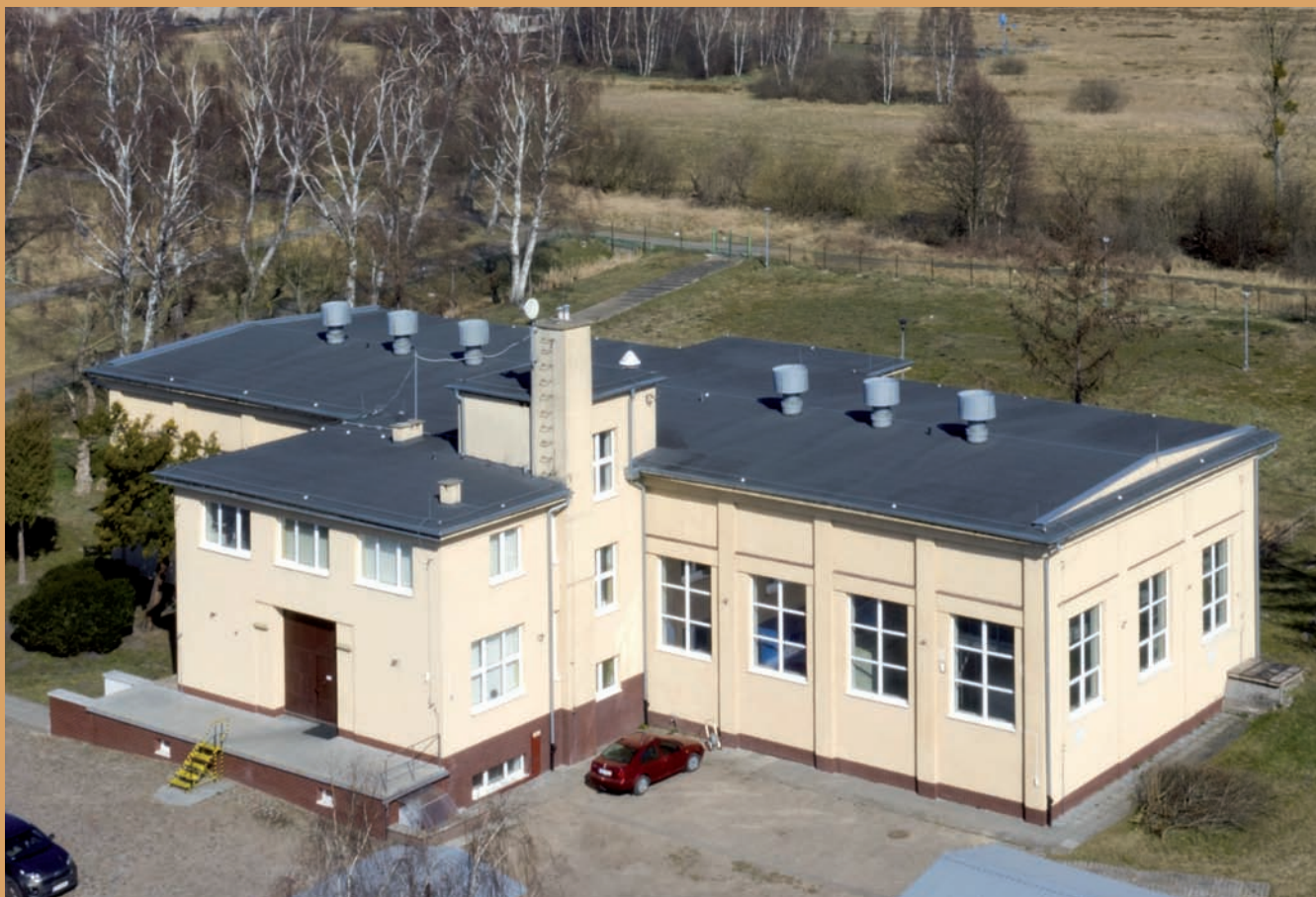
Budynek ujęcia wody, ul. Pomorska, Rumia Water intake building, Pomorska St., Rumia