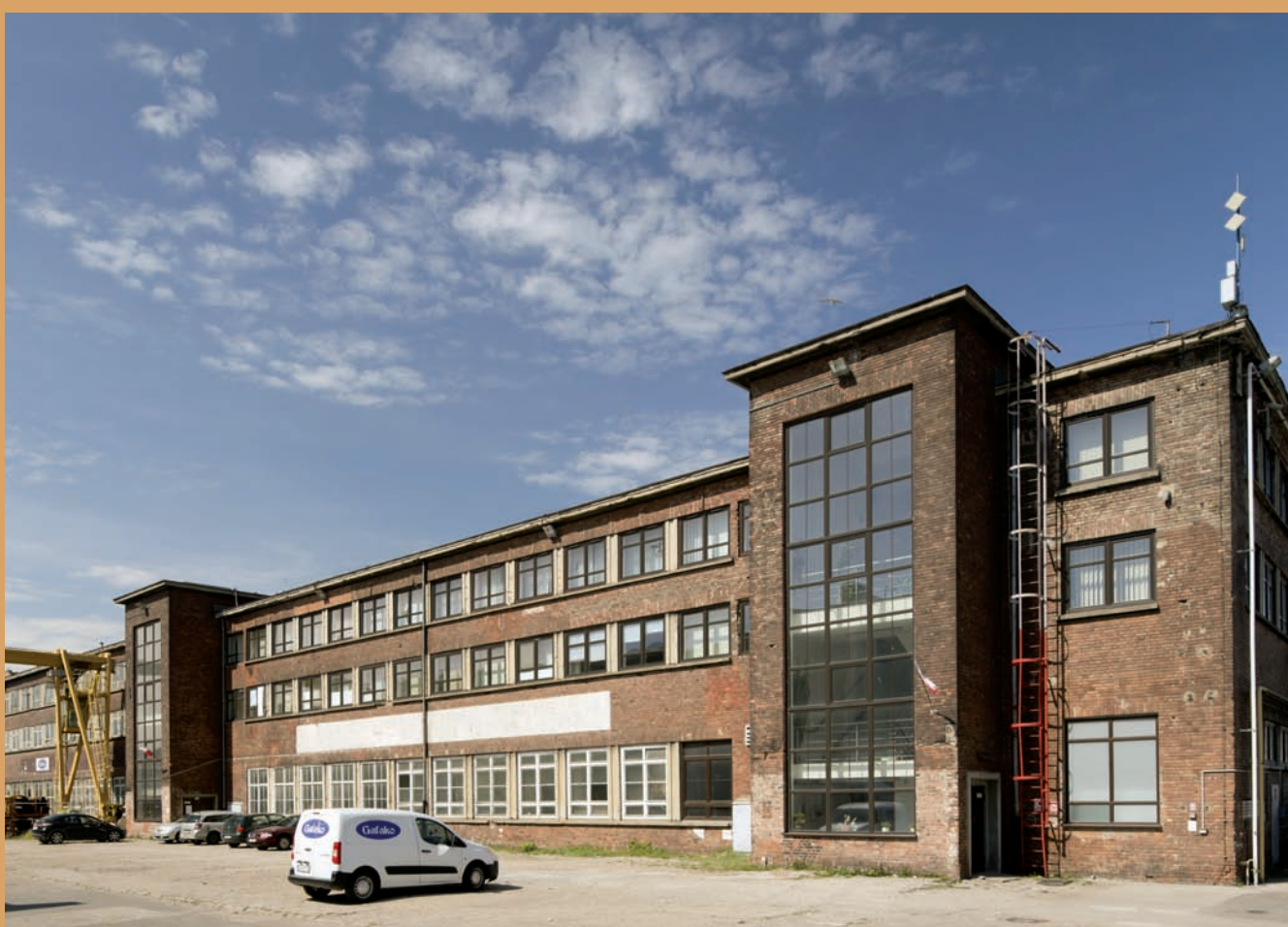
Kadłubownia, ul. Kadłubowców Hullhouse, Kadłubowców St.