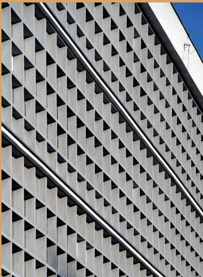
Detal elewacji skrzydła magazynowego budynku MAG, ul. Wendy 15 Detail of the facade of the warehouse wing of the MAG building, 15 Wendy St.