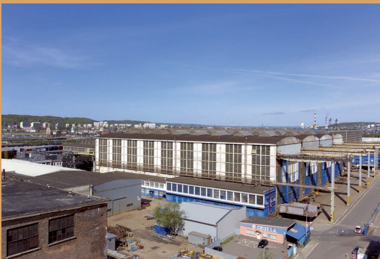
Kadłubownia, ul. Czechosłowacka Hullhouse, Czechosłowacka St.