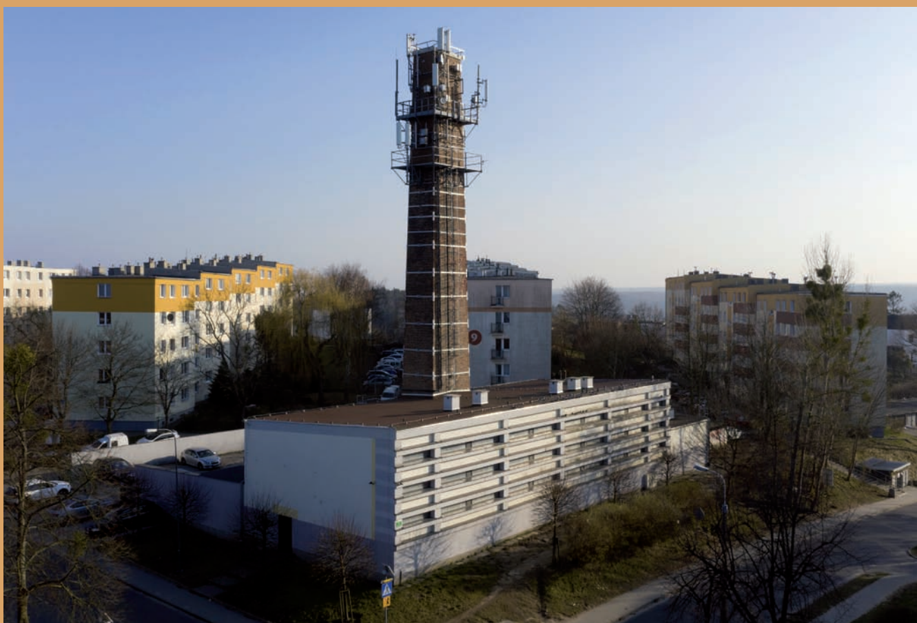
Dawna kotłownia, ul. Cykowskiego 7 Former boiler house, 7 Cykowskiego St.