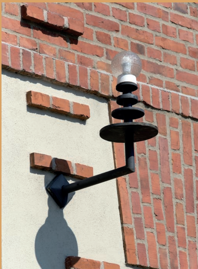
Detal oświetlenia zewnętrznego budynku administracyjnego Łuszczarni Ryżu, ul. Celna 2 Detail of external lighting of the administrative building of the Rice Mill, 2 Celna St.