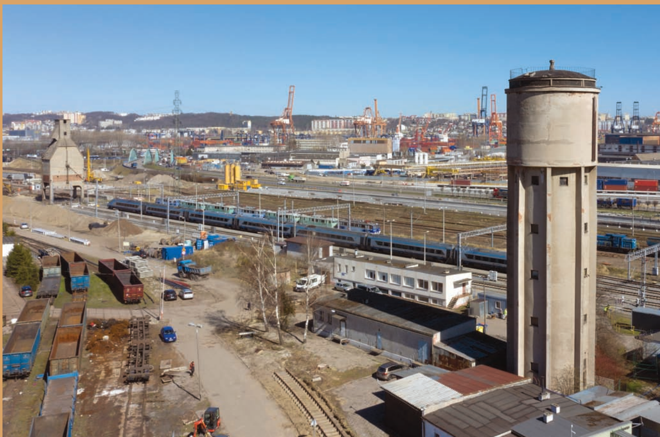
Kolejowa wieża ciśnien i wieża do nawęglania parowozów, ul. Janka Wiśniewskiego A railway water tower and a steam locomotive coaling tower, Janka Wśniewskiego St.