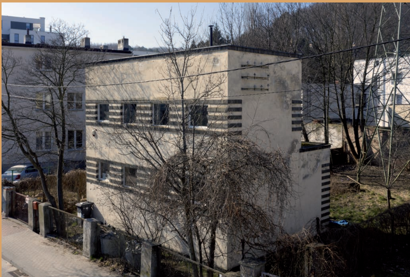
Budynek dawnej trafostacji, ul. Poznańska 10 The building of the former transformer station, 10 Poznańska St.