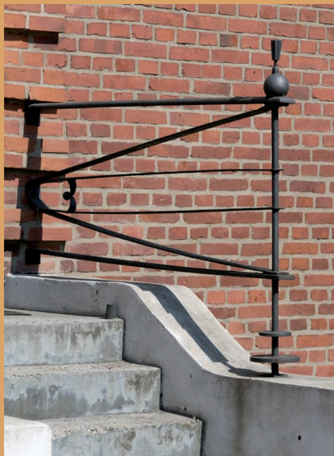
Detal budynku administracyjnego Łuszczarni Ryżu, ul. Celna 2 Detail of the administrative building of the Rice Mill, 2 Celna St.