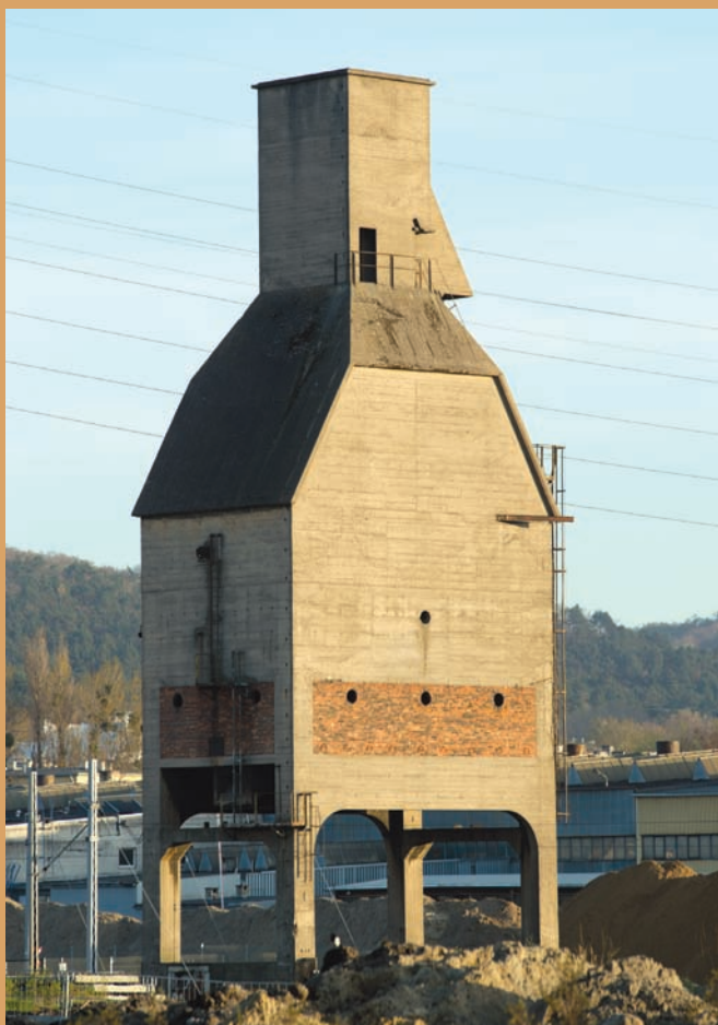
Wieża do nawęglania parowozów, ul. Janka Wiśniewskiego Steam locomotive coaling tower, Janka Wśniewskiego St.