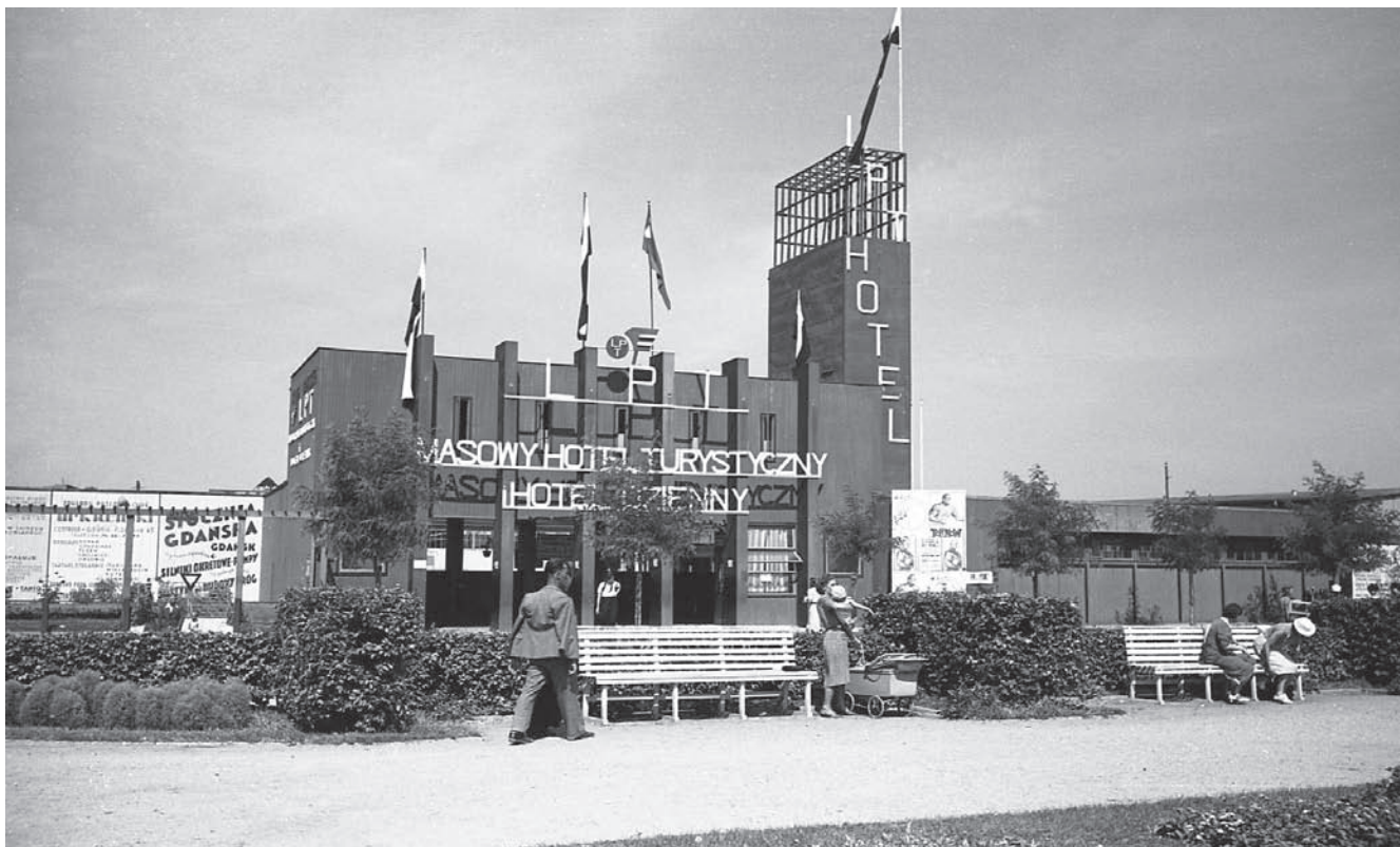
11. Pawilon Wejściowy „Masowego Hotelu Turystycznego i Hotelu Dziennego” Ligi Popierania Turystyki, ok. 1937 r.

11. Entrance pavilion of the "Mass Tourist Hotel as well as the Day Hotel" of the Tourist Support League, c. 1937