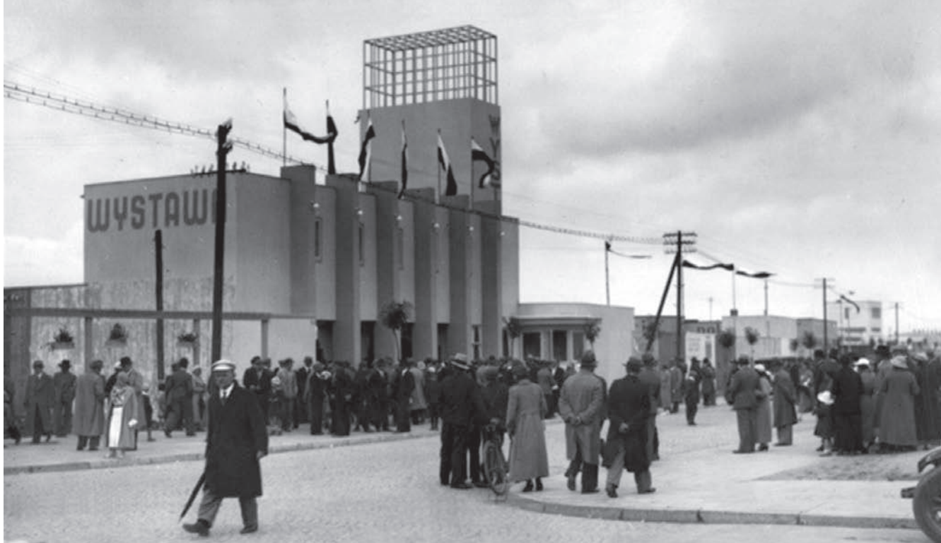
2. Pawilon Wejściowy (Dom Administracyjny) na Wystawie Przemysłowo-Rzemieślniczej w Gdyni, ul. Rybacka 1 (ob. ul. A. Hryniewickiego) 1, 1935 r., projekt (prawdopodobnie) Maksymiliana Zuske, widok od ul. Rybackiej. Z prawej strony pawilonu, w niewielkim, parterowym kiosku o półokrągłym zakończeniu odbywała się obsługa zwiedzających

2. The Entrance Pavilion (Administrative House) at the Industry and Craft Exhibition in Gdynia, 1935, 1 Rybacka Street, probably designed by Maksymilian Zuske, view from Rybacka Street (currently Anoniego Hryniewickiego Street). In the right part of the pavilion, visitors are being attended to in a small one-storey kiosk with a semicircular ending.