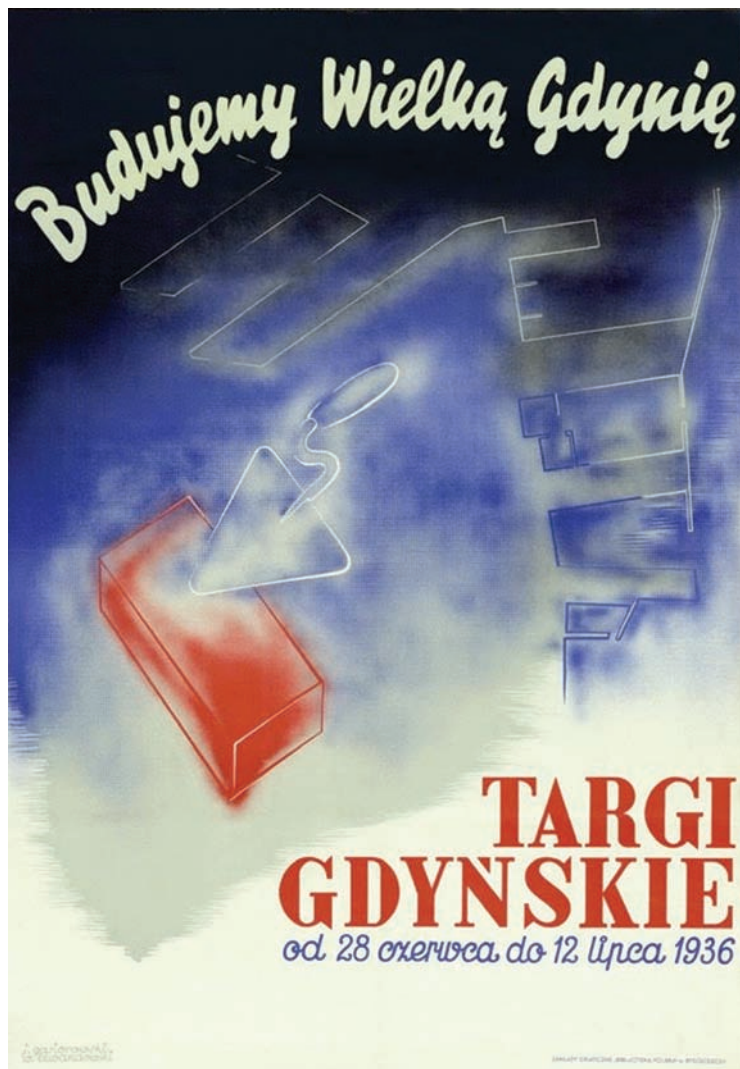
5. Plakat Budujemy wielką Gdynię. Targi Gdynskie od 28 czerwca do 12 lipca 1936, J. Gasiorowski, W. Lewandowski, offset barwny, 99,5 x 69,5 cm, sygnowany L.d.: j.gasiorowski, w.lewandowski, Zakłady Graficzne "Biblioteka Polska", Bydgoszcz.

Prasa donosiła o wysokim poziomie artystycznego wykończenia Wystawy Przemysłowo-Rzemieślniczej w Gdyni. Chwalono przede wszystkim jej przemysłowe rozplanowanie i zdobnictwo 29 . Wydarzenie, trwające do 1 września 1935 roku zgromadziło przeszło