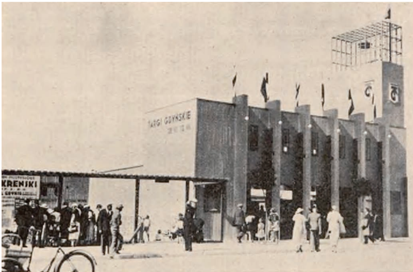
6. Pawilon Wejściowy na Targach Gdynskich w Gdyni w 1936 r., ul. Rybacka 1 (ob. A. Hryniewickiego), projekt (prawdopodobnie) Maksymiliana Zuske. Po lewej stronie widać drewnianą pergolę osłaniającą wejście do miejskich szaletów.

6. Entrance Pavilion at the Gdynia Fair in 1936, 1 Rybacka Street, probably designed by Maksymilian Zuske,. On the left, we can see a wooden pergola which shielded the entrance of the city public toilet.