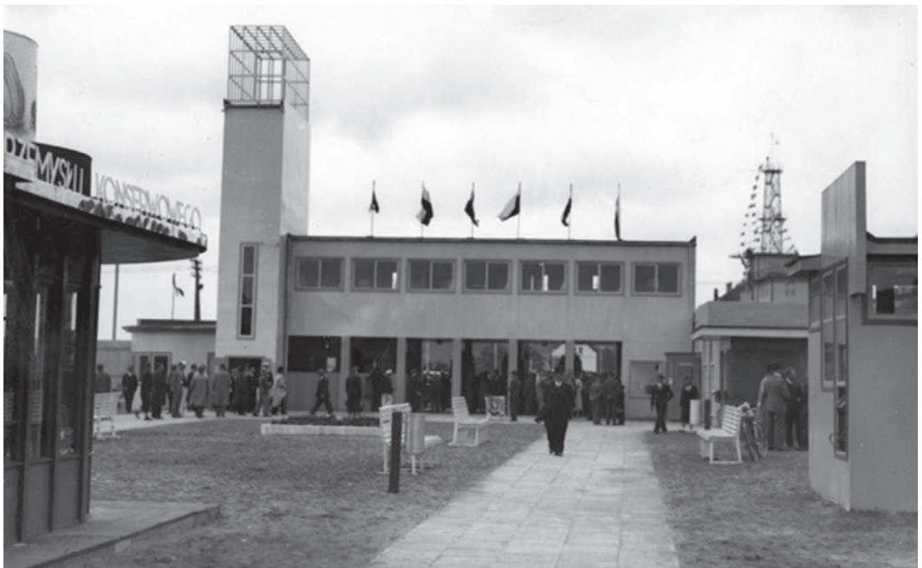
4. The Entrance Pavilion (Administrative House) at the Industry and Craft Exhibition in Gdynia, 1935, 1 Rybacka Street, probably designed by Maksymilian Zuske, seen from inside the Exhibition's site. On the right, we can see the kiosk of the Association for the Polish Preserve Sector.