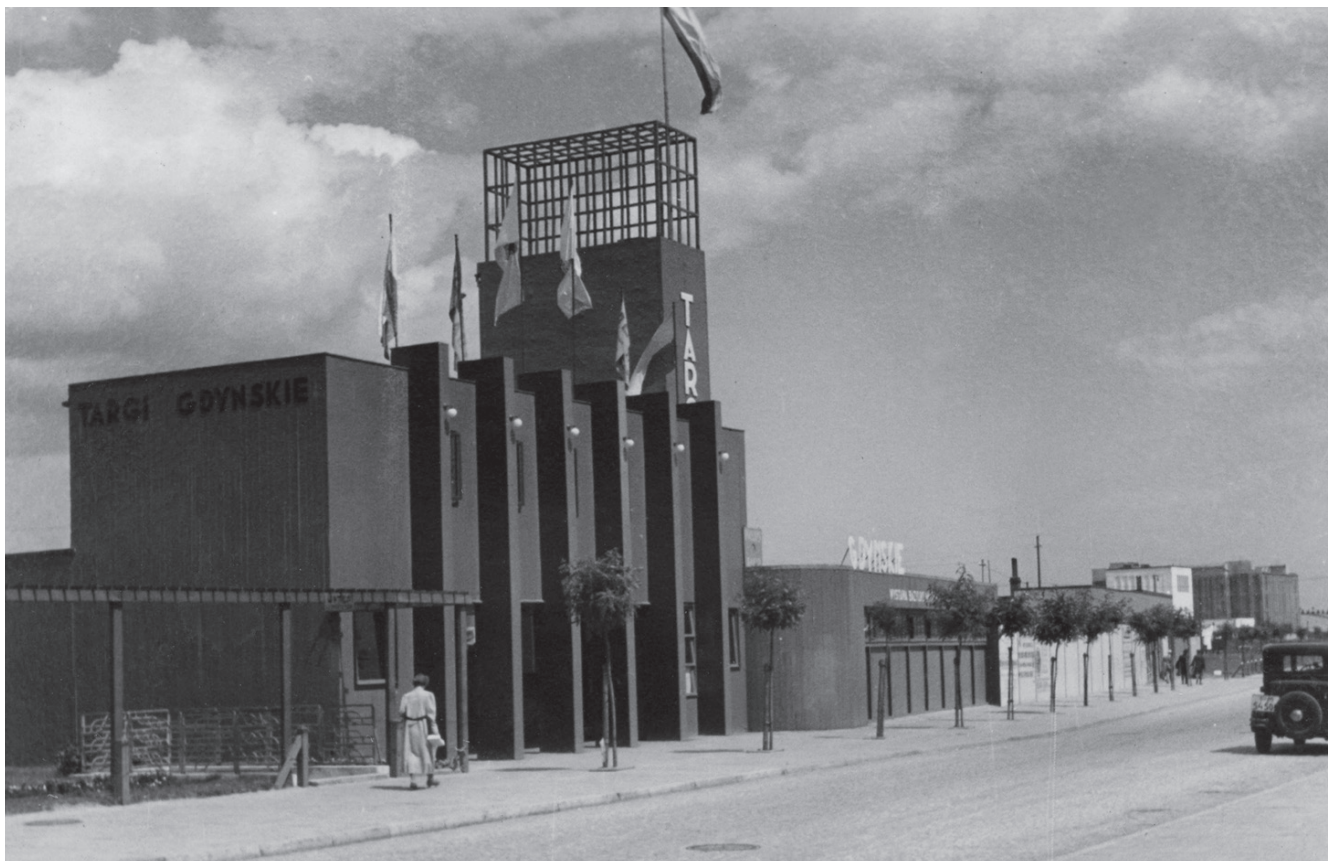
8. Pawilon Wejściowy na Targi Gdyńskie w Gdyni w 1937 roku, z prawej strony widoczny pawilon Bazyliki Morskiej, ul. Rybacka 1

8. Entrance Pavilion into the Gdynia Fair in 1937, on the right we can see the Maritime Basilica's pavilion, 1 Rybacka Street