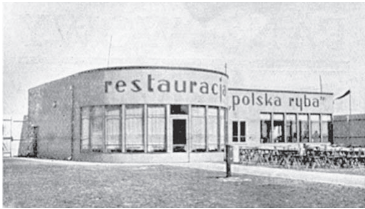
3. Pawilon restauracyjny "Polska Ryba" na Wystawie Przemysłowo-Rzemieślniczej w Gdyni, 1935 r., projektant nieznan.