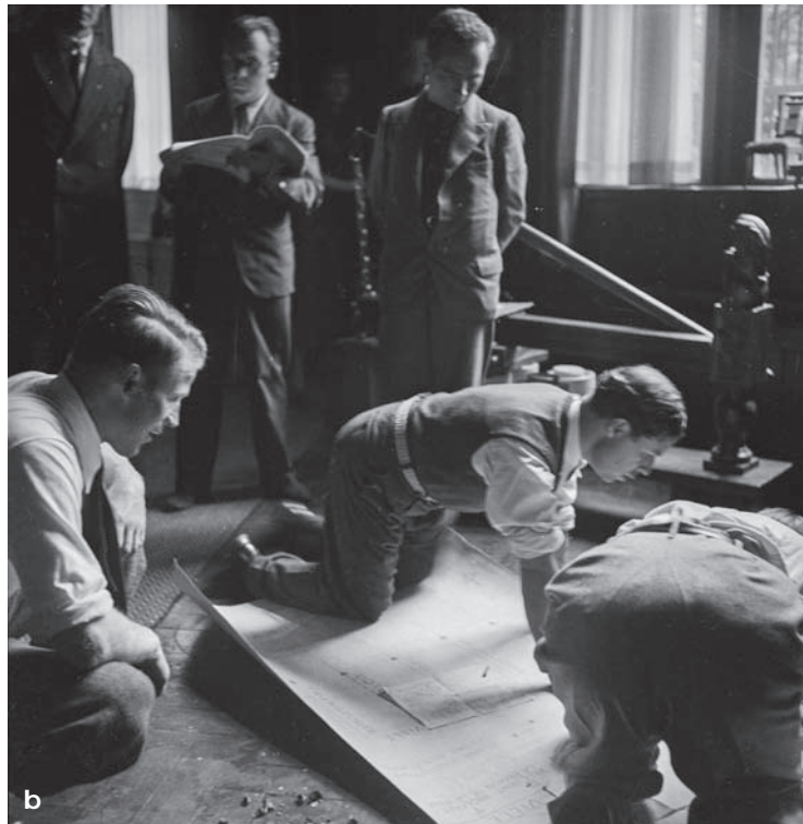
3a, b. Amsterdam (Holandia), spotkanie CIRPAC, czerwiec 1935. Delegaci grup krajowych CIAM podczas dyskusji kuluarowych