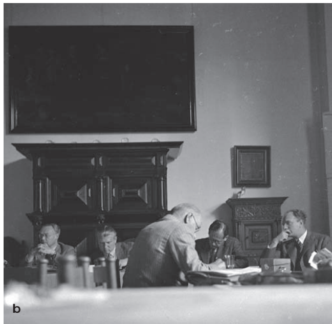
1. Amsterdam (Holandia), spotkanie CIRPAC, czerwiec 1935. Członkowie prezydium obrad plenarnych: a) od lewej - sekretarz generalny CIAM Sigfried Gidion oraz wiceprezisi CIAM Victor Bourgeois i Walter Gropius; b) od lewej - sekretarz generalny CIAM Sigfried Gidion, prezes CIAM Cornelis van Eesteren, osoba niezidentyfikowana oraz wiceprezisi CIAM, Walter Gropius i Victor Bourgeois