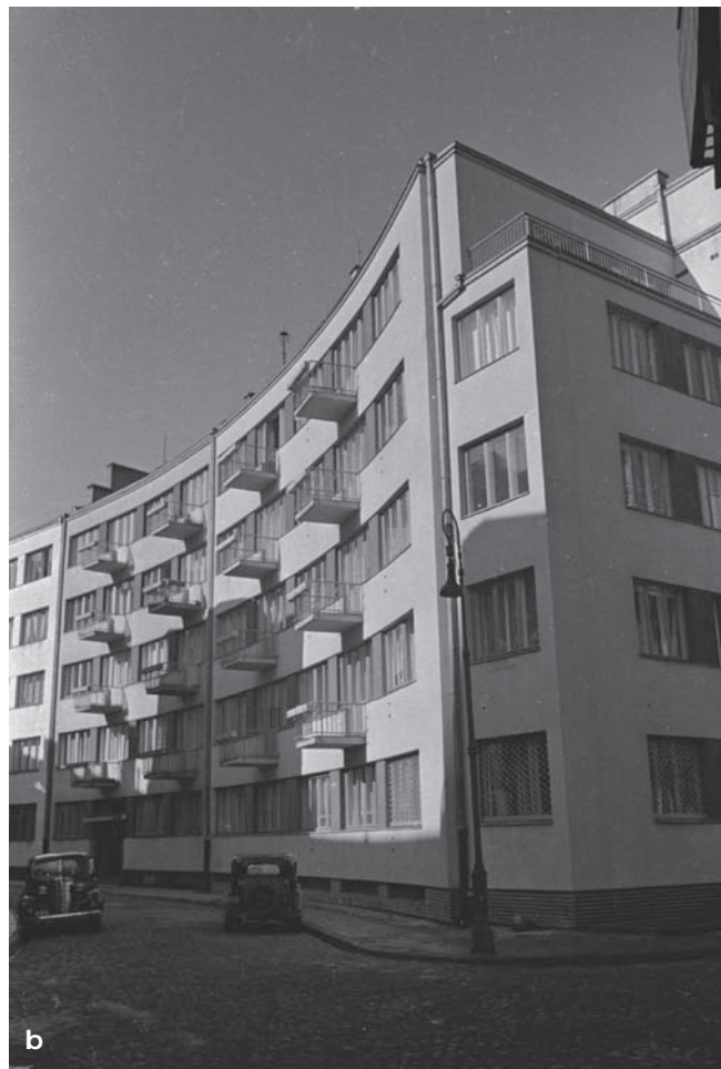
12a, b. Sztokholm (Szwecja), Kongres Międzynarodowej Federacji dla Spraw Mieszkaniowych i Urbanistycznych (IFHTP), lipiec 1939. Niezidentyfikowany budynek mieszkalny w Visby [?], (fot. S. Syrkus, źródło: Zb. ZAP WAPW)