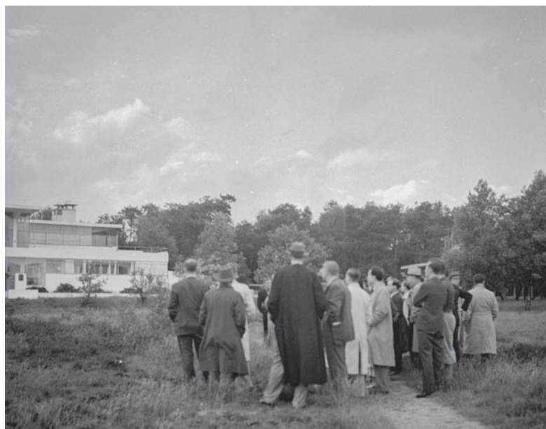
4. Amsterdam (Netherlands), CIRPAC meeting, June 1935. CIAM delegates on a tour of the Van Nelle factory in Rotterdam. Design. Brinkman and Van der Vlugt with the participation of Mart Stam (1925-1931)