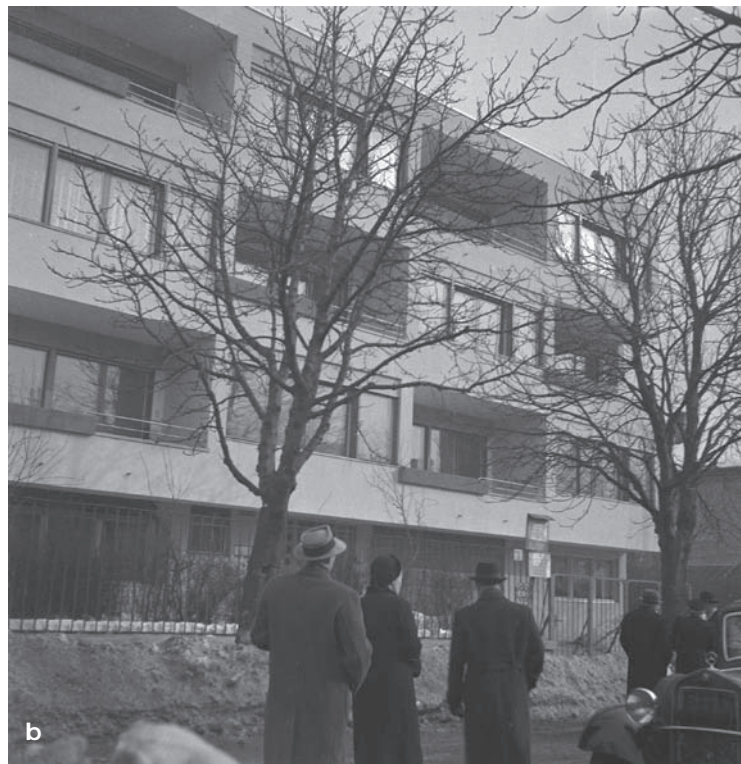
9. Budapeszt (Węgry), spotkanie Grupy Wschodniej CIAM (CIAM-Ost), styczeń-luty 1937. a) dzwonnica franciszkańskiego kościoła i klasztoru w dzielnicy Pasarét na wzgórzach Budy, proj. Gyula Rimanóczy (1937); b) delegaci CIAM-Ost zwiedzający niezidentyfikowany budynek mieszkalny (ok. 1937), (fot. S. Syrkus, źródło: Zb. ZAP WAPW)

9. Budapest (Hungary), meeting of the CIAM Eastern Group (CIAM-Ost), January-February 1937. a) the bell tower of a Franciscan church and monastery in the Pasarét district of Buda, design. Gyula Rimanóczy (1937); b) CIAM-Ost delegates visiting an unidentified residential building (ca. 1937). Photo S. Syrkus. (source: Coll. ZAP WAPW)