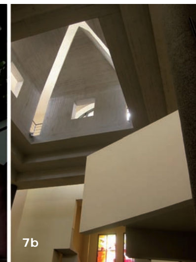
7ab. Wyższe Seminarium Duchowne Polskiej Prowincji Zgromadzenia Zmartwychwstańców „Droga Czterech Bram”, ul. ks. S. Pawlickiego 1 (bryła i wnętrze), architektki Dariusz Kozłowski, Waław Stefański i Maria Misiągiewicz, projekt 1983-89, realizacja 1989-93