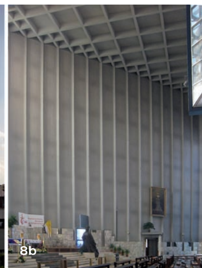
8ab. Kościół św. Jadwigi Królowej, ul. W. Łokietka 60 (bryła i wnętrze), architektki Romuald Loegler i Jacek Czekaj, współpraca Marek Piotrowski, projekt 1977-79, realizacja 1979-88 (fot. Marcin Włodarczyk, 2015)