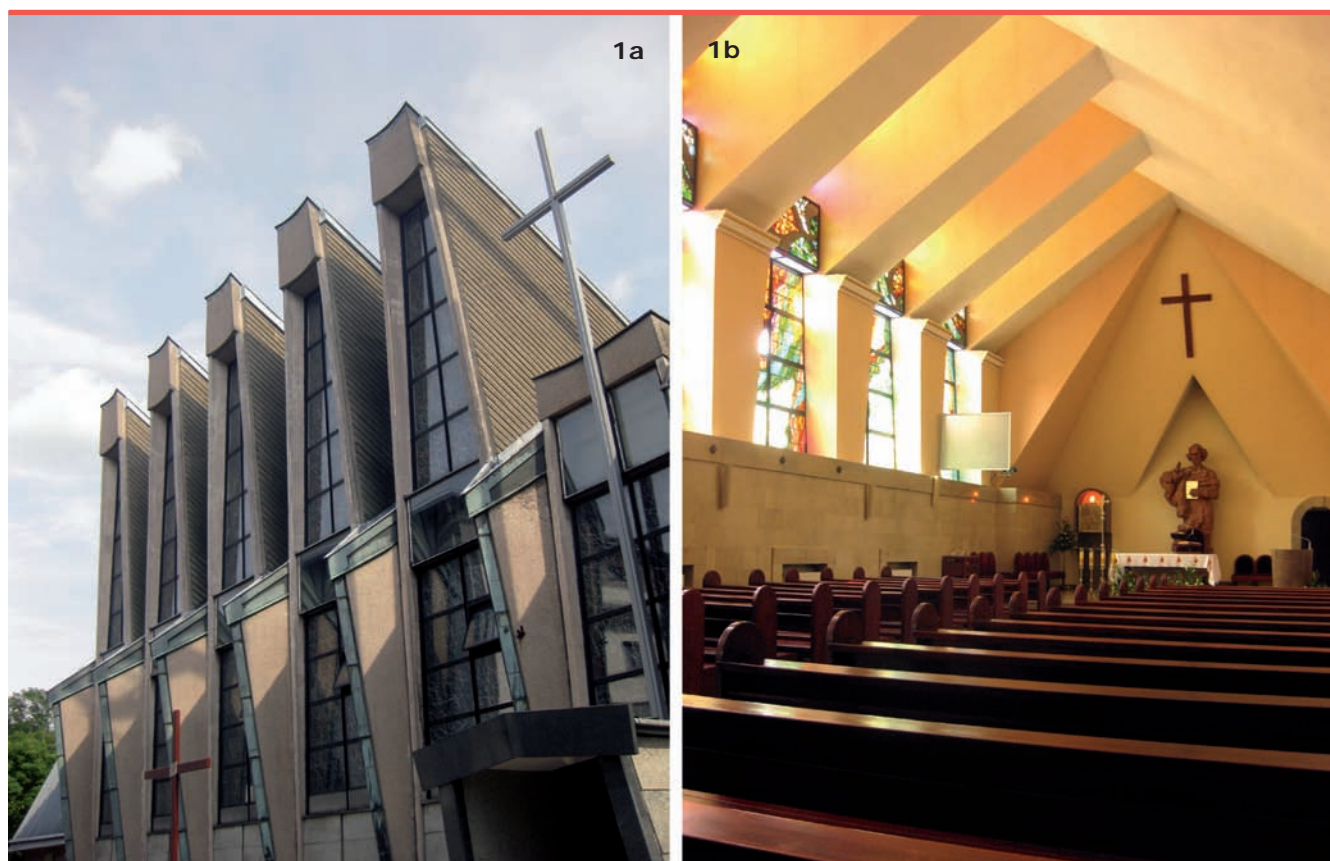
1ab. Kościół Boskiego Zbawiciela, ul. św. Jacka 16 (elewacja i wnętrze), arch. Janusz Gawor, projekt 197?, realizacja 1971-76