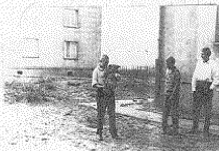
BLOK, W KTÓRYM MIESZKAŁAM Z RODZICAMI TYLKO OD 1986 r. GDYNIA - GRABÓNEK

Rodzice mojej mamy uciekali przed Niemcami do Gdyni. Lecz z ich pomocą powstała dosyć duża rodzinka. Kiedy moja mama stała się doświadczonej przyjechała do Gdyni, gdzie zamieszkała i zaczęła prowadzić odpowiedzialne życie. Poznała wtedy mojego tatę, a dnia 26. XI. 1976 pobrali się. Dnia 4. V. 1977 w Gdyni urodziła się moja siostra. Dwie lata później 4. II. 1986 urodziłam się ja również w Gdyni. Po dziś razem z rodzicami zamieszkał w Gdyni. Mam wielką nadzieję, że nawet kiedyś zastąpię w tym rodzinnym domu mieszkać w Gdyni.