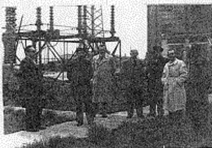
ZAKŁAD ENERGETYCZNY, KIEDYŚ MIESZKAŁ TAM MÓJ TATA Z RODZICAMI. GDYNIA - GRABÓNEK.