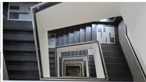
Klatka schodowa kamienicy przy ul. Abrahama 28 po pracach konserwatorskich w 2019 r.