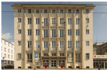
Budynek BGK ul.10 Lutego 8/Zygmunta Augusta 13, prace konserwatorskie przy elewacjach prowadzono w latach 2013-2019.