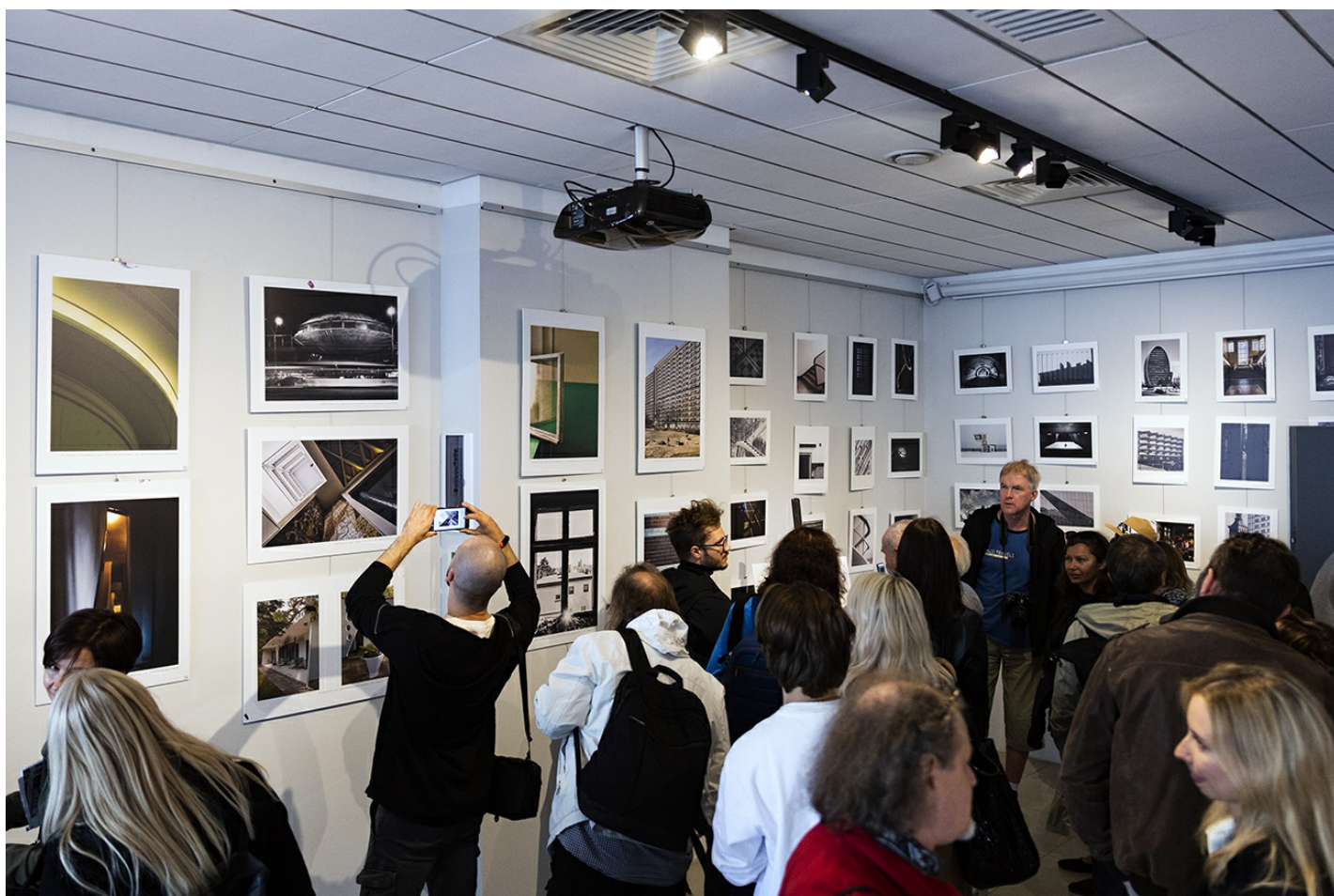
Wystawa pokonkursowa Gdyński Modernizm w Obiektwie 2021.