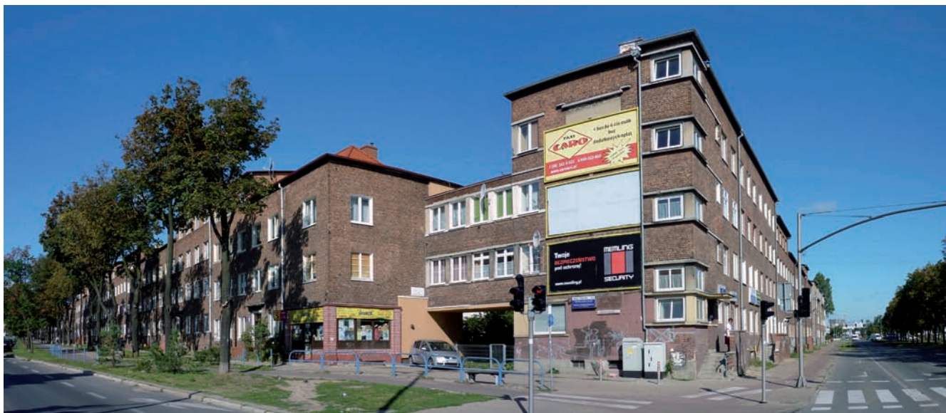
6. Narożnik budynku przy ulicy Tadeusza Kościuszki (od lewej) i alei Legionów (od prawej) z podwyższonymi o jedną kondygnację segmentami przy alei Legionów 58 i 60. Wtórne nadbudowy w poziomie poddasza w pierzei ulicy Tadeusza Kościuszki maskują korony szpaleru drzew będącego efektem nasadzeń z okresu powstania osiedla

uksztaltowaniem elewacji poprzez zaprojektowanie niszy, podcienia, pionu złożonego z balkonów, odmiennego wystroju elewacji itp. W szczególnych przypadkach stosowano jednocześnie po kilka zabiegów kompozycyjnych.