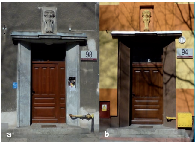
8. Pierwotnie identyczne portale segmentów w zabudowie ciąglej: a. Przy ul. Tadeusza Kościuszki 98 (segment nie ocieplony); b. przy ul. Tadeusza Kościuszki 94 (segment po ociepleniu i wykonaniu nowej kolorystyki)

profilowanych obramieniach (il. 7). Ta forma portalu wyróżnia opisywany budynek. Na analizowanym obszarze nie odnotowano powtórzeń tego detalu. Dopełnieniem kompozycji portali są profilowane schodkowe zadaszenia ze sztucznego kamienia. Natomiast wejście do wyodrębnionego kompozycyjnie centralnego segmentu założenia, stanowią schody wolne wypukłe prostokątne. W segmencie zastosowano wariant portalu o zaokrąglonym obramieniu z charakterystycznym dla budynku daszkiem. W skrajnych segmentach przy ulicy Tadeusza Kościuszki 12 i 38 powtarzają się znajome formy: portali w wersji o zaokrąglonym (nr 12) i o prostokątnym (nr 38) obramieniu oraz zadaszeń nad wejściem. Dla odmiany w obu segmentach zaprojektowano schody zewnętrzne w najprostszym jednobiegowym układzie, prostopadle do fasady budynku. Zupełnie inną oprawę uzyskały strefy wejściowe skrajnych segmentów budynku. Na przedłużeniu prostego otworu drzwiowego zastosowano płytkie wertykalne wycofanie lica fasady, podkreślające pion klatki schodowej. Natomiast doświetlenie klatki schodowej zapewniają dwie identyczne sekwencje dwuskrzydłowych okien, rozplanowanych po trzy w pionie i rozdzielonych poziomymi listwami ze sztucznego kamienia. Ewenementem jest kompletne zachowanie oryginalnej drewnianej stolarki okiennej w pomieszczeniach klatki schodowej segmentu położonego przy alei Legionów 66.