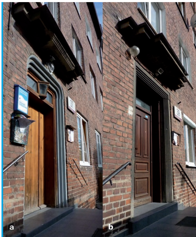
7. Charakterystyczne frontowe portale budynku wraz z daszeniami: a. W segmencie przy ul. Jana Kilińskiego 37, zachowana oryginalna drewniana ościeżnica (bez powłoki malarskiej) z wysuniętym naświetlem i przeszkloną osłoną o kształcie imitującym obudowę latarni, skrzydło drzwiowe wtórne; b. W segmencie przy ul. Jana Kilińskiego 39, stolarka drzwiowa wtórna

Kształt architektoniczny omawianego budynku zgodny jest z konwencją estetyczną całego zespołu. W jego układzie przeważa rytm 3-kondygnacyjnych, prostopadłościennych segmentów przekrytych stromymi dachami pokrytymi tradycyjną dachówką (obecnie z częściowo użytkowanymi poddaszami), który urozmaicono 2-kondygnacyjnymi łącznikami o płaskich dachach. Dzięki temu zabiegowi projektowemu, pomimo znacznych gabarytów (długość elewacji frontowych w rozwinięciu przekracza 450 m), budynek cechuje przyjazna skala. Celowym rozwiązaniem okazało się tu podwyższenie ścian zewnętrznych poszczególnych członów budynku, przekrytych dachami stromymi, o niewysokie mury attykowe, maskujące anachroniczną w okresie wznoszenia budynku spadzistość dachów. Dwa segmenty budynku na rogu alei Legionów i ulicy Tadeusza Kościuszki, dla zaakcentowania znaczenia narożnika kwartału, podwyższono w stosunku do pozostałych o jedną kondygnację (aleja Legionów 58 i 60, il. 6). Odmiennie kubaturowo opracowanie, polegające na rozczłonkowaniu bryły