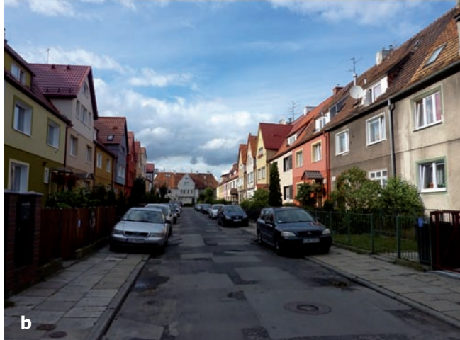
2. Zespół zabudowy szeregowej jednorodzinnej przy ul. Bolesława Prusa wraz z zamykającym perspektywę ulicy budynkiem przy ul. Lucyny Krzemienieckiej 3-4-5, wzniesiony wg projektu Erwina Lentza, 1929 r. – porównanie stanu elewacji budynków: a. Widok z ok. 1930 r., na podstawie „Był sobie Gdańsk – Dzielnice Wrzeszcz”, (red.) G. Fortuna, Gdańsk 2002, s. 154-155; b. Widok z 2014 r.

Założenie charakteryzuje się czytelną strukturą przestrzenną, na którą składają się: