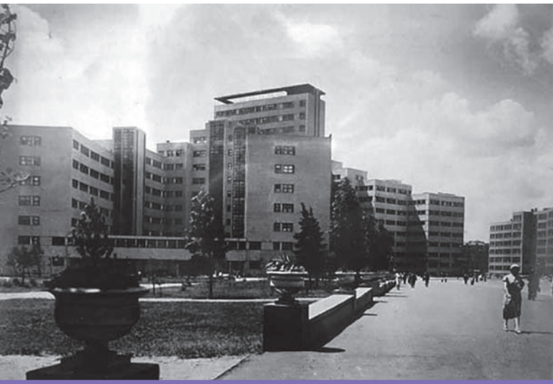
2. Dom Projektów na pl. Wolności 4, Charków, Serafimov S., Zandberg-Serafimova M., 1931-32 (zdjęcie z lat 30. XX w. z archiwum A. Bouryaka)