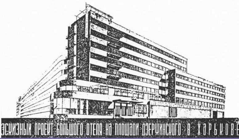
4. Hotel Internacional, plac Wolności 7, Charków, Janovitsky G., 1932-35