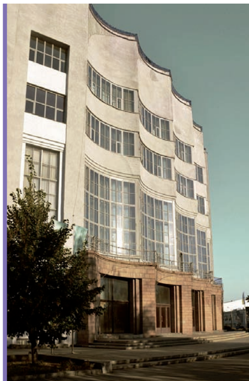
5. Pałac Kultury Kolejarzy, ul. Bolshaya Panasovskaya 83a, Charków, Dmitriev A.I., 1928-32.

Naukowa porażka historyków i teoretyków miała dość konkretne konsekwencje materialne. Na Ukrainie niepokonane w latach powojennych, negatywne nastawienie do dziedzictwa modernizmu międzywojennego, doprowadziło do niekontrolowanych przebudów i zniekształceń setek obiektów – budynków mieszkalnych i dydaktycznych, klubów robotniczych, zespołów fabrycznych. Zabytki, nawet te największe, nie mając statusu chronionego, były nadbudowywane i przebudowywane, traciły oryginalne detale – zegary, balkony, ogrodzenia, kraty witrażowe. Charakterystyczne jest, że nawet słynny na cały świat budynek Derzhpromu (Gospromu) dopiero w 1980 r. po raz pierwszy otrzymał status zabytku, i to „zabytku o znaczeniu lokalnym”. Przez wspomnianą już nieudaną odbudowę